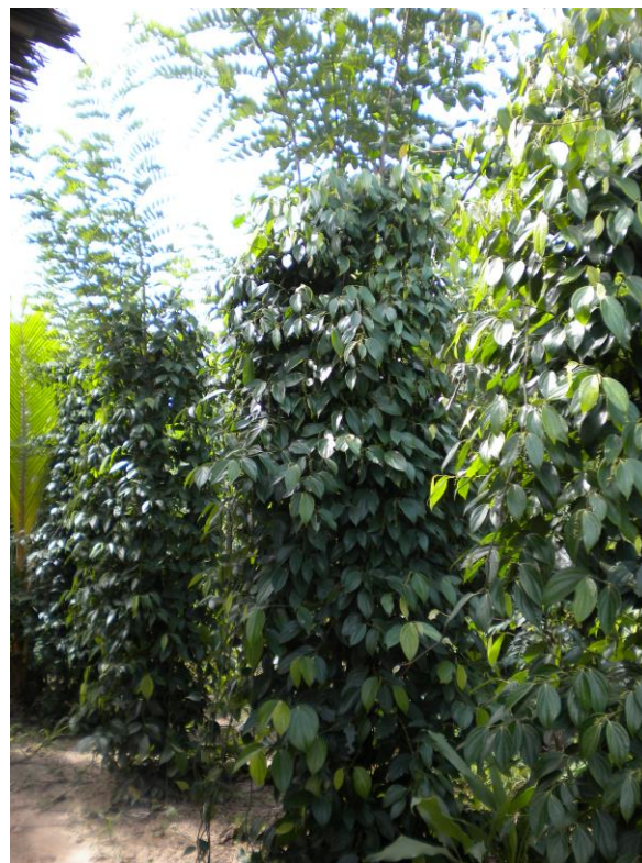
Gambar 1. Budidaya lada menggunakan tajar hidup pendek (2-3 m) di Indonesia.

Apapun jenis/macam tajar lada yang digunakan, ukuran tinggi tajar adalah permasalahan yang menarik untuk dicermati kembali, karena berpengaruh terhadap hasil lada. Sampai saat ini, petani lada Indonesia umumnya menggunakan tajar berukuran pendek (Gambar 1), baik tajar mati maupun hidup, berkisar 2.5 - 3 m. Di Malaysia, petani menggunakan tajar mati dengan tinggi 3,5 m (Rosli, 2013). Pola pikir demikian, secara sadar atau tidak para petani sebenarnya telah kehilangan potensi hasil lada yang seharusnya didapatkan. Sebaliknya, apabila petani menggunakan tajar tinggi (> 5 m), maka hasil yang dicapai diharapkan lebih banyak asal