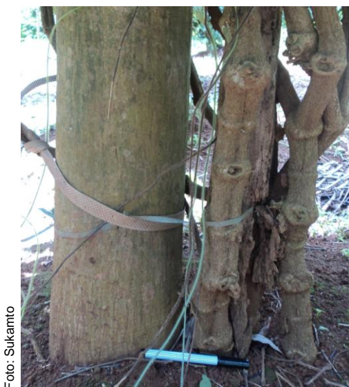
Gambar 6. Budidaya lada di Vietnam dengan menanam lebih dari satu pohon per tajar

penggunaan jarak tanam lebih lebar. Hal ini menjadi tantangan dan sekaligus peluang dalam upaya meningkatkan produktivitas lada Indonesia. Dasar pemikirannya adalah bahwa volume dan produksi menjadi lebih luas dan masif. Hanya saja, untuk merubah kebiasaan (tradisi lama) ke hal baru, bukan pekerjaan mudah dan memerlukan waktu lama. Diperlukan riset-riset yang komprehensif dan terencana baik, sehingga inovasi teknologi budidaya dimaksud dapat diterima dan diaplikasikan. Namun kondisi iklim Indonesia yang lebih basah, khususnya di sentra-sentra produksi adalah sisi lain yang perlu dipertimbangkan karena penyakit BPB sangat mudah dan cepat berkembang. Sebagai contoh, pengusahaan lada di Bangka dengan sistem tanam pagar menunjukkan bila ada tanaman dalam baris pagar terkena penyakit BPB, maka dalam waktu tidak terlalu lama semua tanaman dalam satu baris terserang. Lebih jauh, sebelum teknik budidaya tersebut dianjurkan secara luas ke petani maka perlu dilakukan demplot-demplot berkala luas di lahan petani dengan penetapan CP-CL (calon petani dan calon lahan). Apabila terbukti teknologi tersebut memberikan hasil lebih baik, maka dapat dilanjutkan dengan kegiatan temu lapang atau gelar teknologi bersama Direktorat Jendral Perkebunan dengan mengundang kontak tani lada dari daerah penghasil lainnya.