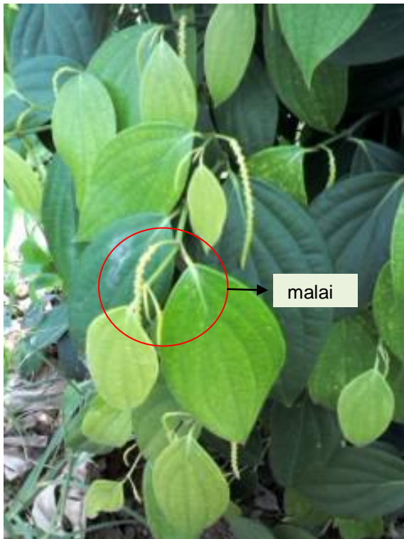
Gambar 3. Keragaan pertumbuhan tanaman lada, setiap daun di sebelahnya terbentuk malai bunga lada (Yap, 2012).

Dengan demikian, jelas bahwa tindakan pemangkasan dalam budidaya lada menjadi sangat penting, meskipun fakta lapang masih banyak pertanaman lada petani yang gagal membentuk kanopi ideal karena sistim percabangan buah sangat sedikit. Hal tersebut karena bibit tanaman yang digunakan belum memasuki fase generatif dan tidak dipangkas secara optimal sejak dini. Akibatnya, pada tingkat lapang masih sering dijumpai arsitektur kanopi lada dengan ruas-ruas batang pokok lada yang tidak tumbuh/keluar cabang buahnya. Bukti atau petunjuk ke arah itu diperlihatkan oleh bentuk kanopi yang tidak ideal, ramping atau miskin percabangan di bagian bawah pada zone sampai 1,5 – 2,0 m di atas permukaan tanah, karena jumlah cabang buah yang terbentuk sedikit (Gambar 4). Jika dihitung secara ekonomis, berarti petani telah kehilangan potensi hasil lada yang secara ilustratif sebesar volume kanopi yang seharusnya berisi cabang-cabang buah produktif.