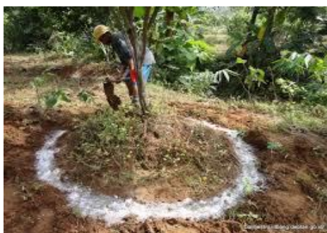
Gambar 6. Bimtek cara aplikasi pupuk pada tanaman jeruk