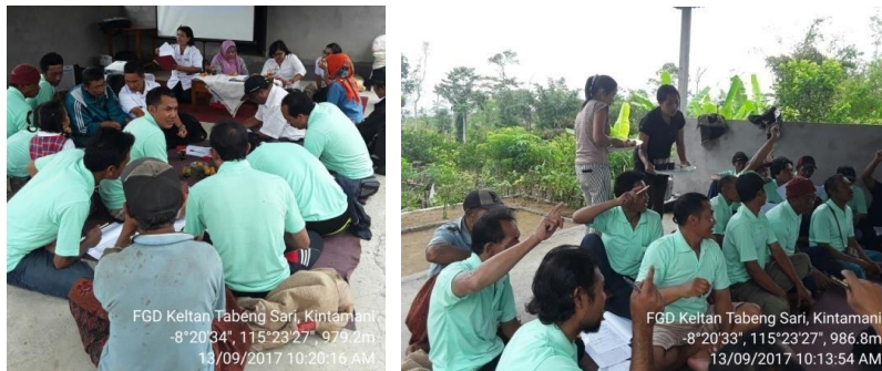
Gambar 5. Suasana FGD jeruk pada Kelompok Tani Tabeng Sari, Kintamani