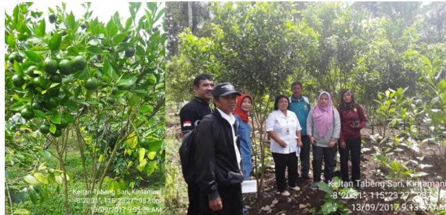
Gambar 4. Kondisi tanaman jeruk pada demplot (a); Penjab dan petani kooperator menerangkan hasil kegiatannya (b)