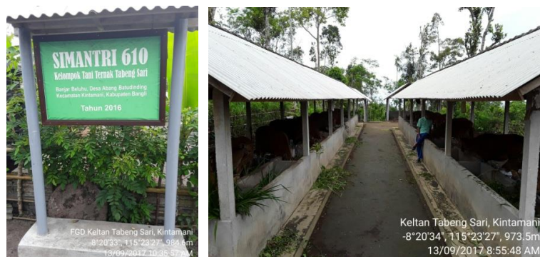
Gambar 2. Lokasi Demplot jeruk terintegrasi dengan Simantri

Kegiatan pendampingan pengembangan kawasan komoditas jeruk dilaksanakan di Kecamatan Kintamani, Kabupaten Bangli. Lokasi terpilih merupakan lokasi pengembangan kawasan jeruk tahun 2016 karena pada Tahun 2017 Kabupaten Bangli sebagai sentra jeruk di Provinsi Bali sesuai Keputusan Menteri Pertanian RI Nomor 830/Kpts/RC.040/12/2016, tidak lagi menentukan lokasi pendampingan kawasan komoditas jeruk mengingat lebih mendahulukan program cabai dan bawang merah. Kelompok tani yang dipilih secara sengaja atau purposive sampling sebagai lokasi pendampingan kawasan jeruk adalah Kelompok Tani dan Ternak Tabeng Sari, Banjar Beluhu, Desa Abang Batudinding dan Kelompok Tani Laba Sari Artha, Banjar Puseh, Desa Trunyan. Kedua kelompok ini berada di Kecamatan Kintamani, Kabupaten Bangli (Gambar 2 s.d 5).