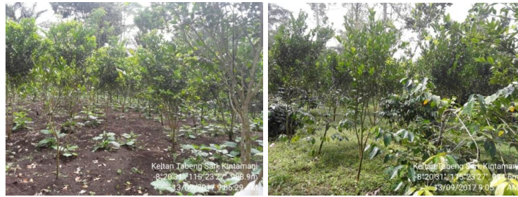
Gambar 3. Kondisi demplot jeruk (a); dan lahan kontrol (petani) (b)