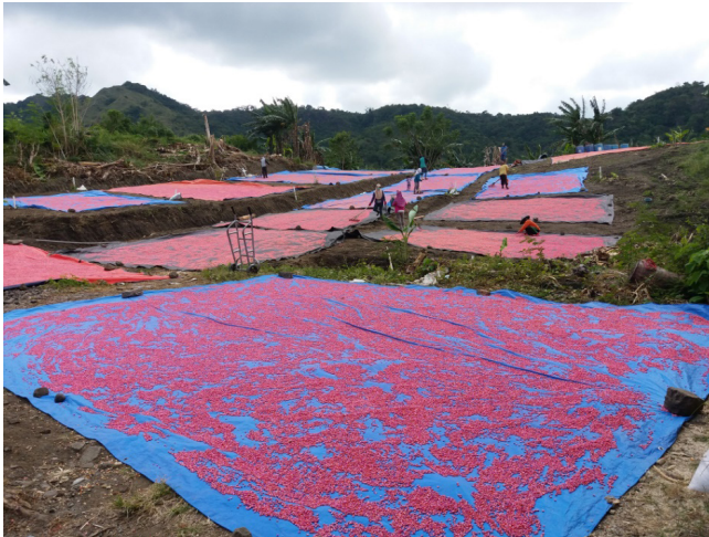
Gambar 5. Perlakuan seed treatment dan pengeringan benih menggunakan lantai jemur