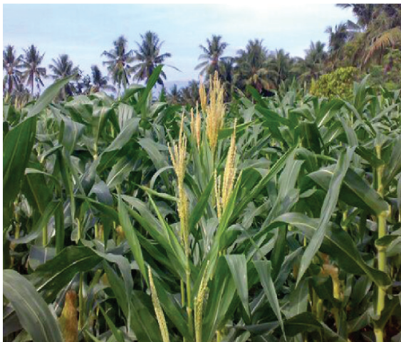
Gambar 2. Roguing barisan tanaman jantan

Untuk mengurangi tanaman yang menyimpang dari tipe rata-rata dan yang tertular penyakit berdasarkan hasil pengamatan secara visual, maka perlu dilakukan pencabutan (roguing). Roguing harus dilakukan minimal 2 kali selama pertumbuhan tanaman yaitu pada saat pertumbuhan vegetatif (32 – 35 hst) dan rouging generatif (45 – 52 hst). Deskripsi varietas sebagai standar evaluasi mutu genetik harus dipahami oleh petugas.