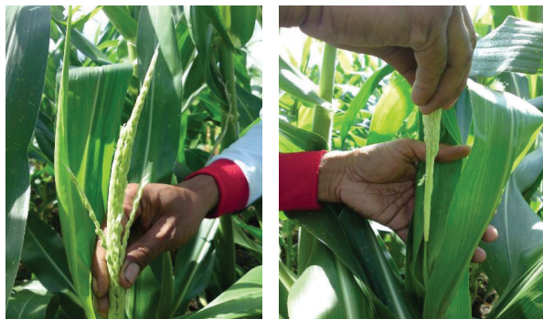
Gambar 3. Pencabutan malai tanaman betina

Detasseling/pencabutan bunga jantan pada barisan tanaman induk betina harus dilakukan sebelum bunga jantan terbuka/muncul dari daun terakhir (daun pembungkus mulai membuka tetapi malai belum keluar dari gulungan daun). Untuk mencegah agar tidak ada tanaman yang terlewatkan tidak tercabut bunga jantannya, maka pencabutan dilakukan setiap hari selama periode berbunga biasanya pada umur antara 45-56 hst (bergantung pada kondisi cuaca/iklim mikro di pertanaman).