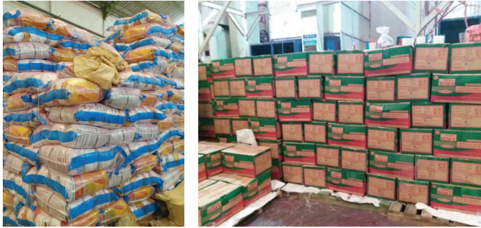
Gambar 6. Pengemasan dan penyimpanan benih