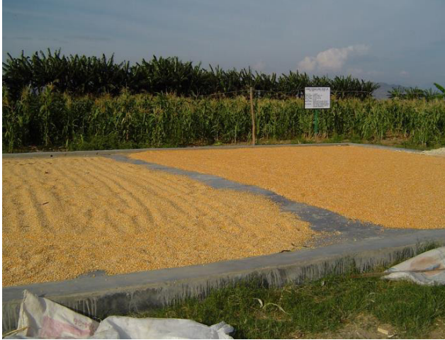
Gambar 4. Pengeringan benih menggunakan lantai jemur