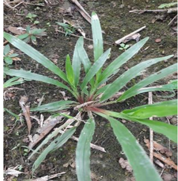
Axonopus compressus (R. Karpet)