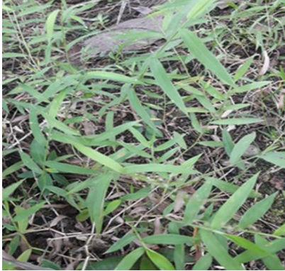
Paspalum conjugatum (R. Pahit)