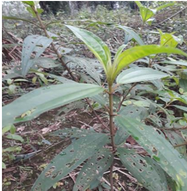
Clidemia hirta (Harendong bulu)