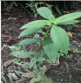
Asystasia gangetica (Ara sunsang)

Gambar 2. Jenis gulma ( Melastoma Hirta , Clidemia , Sida , Nephrolepis , Borreria , Alystasia , Carex muskingumensis dan Sonchus ) yang ditemukan tumbuh di bawah tegakan kelapa sawit