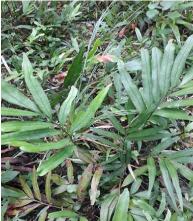
Nephrolepis cordifolia (Paku sepat)