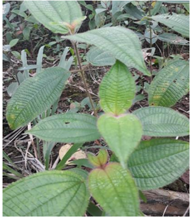
Melastoma candidum (Harendong)