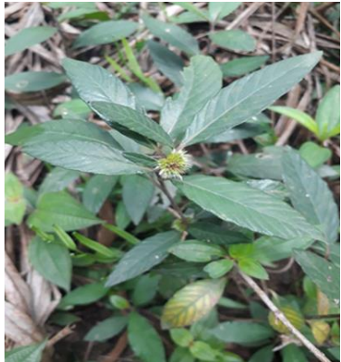
Sida rhombifolia (Sadagori)