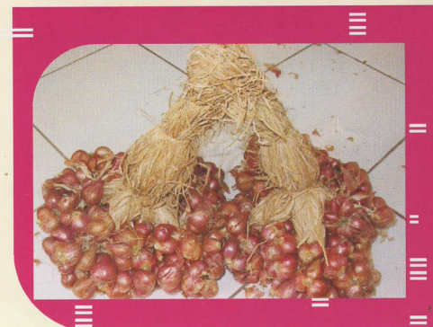
Gambar 4: Hasil Panen siap dijual/disimpan