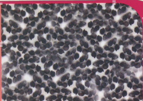
Gambar 1: Biji Bawang Merah