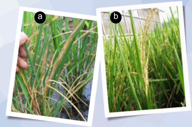
Gambar 2. : (a) Sundep (pada fase pertumbuhan vegetatif) (b) Beluk (pada fase pertumbuhan generatif)