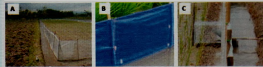
Gambar 2. Pagar plastik TBS dengan plastik bening (A), dan terpal (B). Bagian bawah pagar plastik selalu terendam air dan perhatikan posisi ajir bambu, Bubu perangkap dan cara pemasangannya (C).