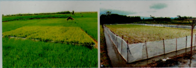
Gambar 1. Tanaman perangkap untuk menarik tikus dari sekitarnya