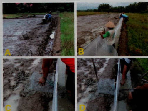
Gambar 4. Pembuatan parit (A), Pemasangan pagar plastik (B), Pemasangan bubu perangkap (C), Pemasangan jembatan kayu (D)