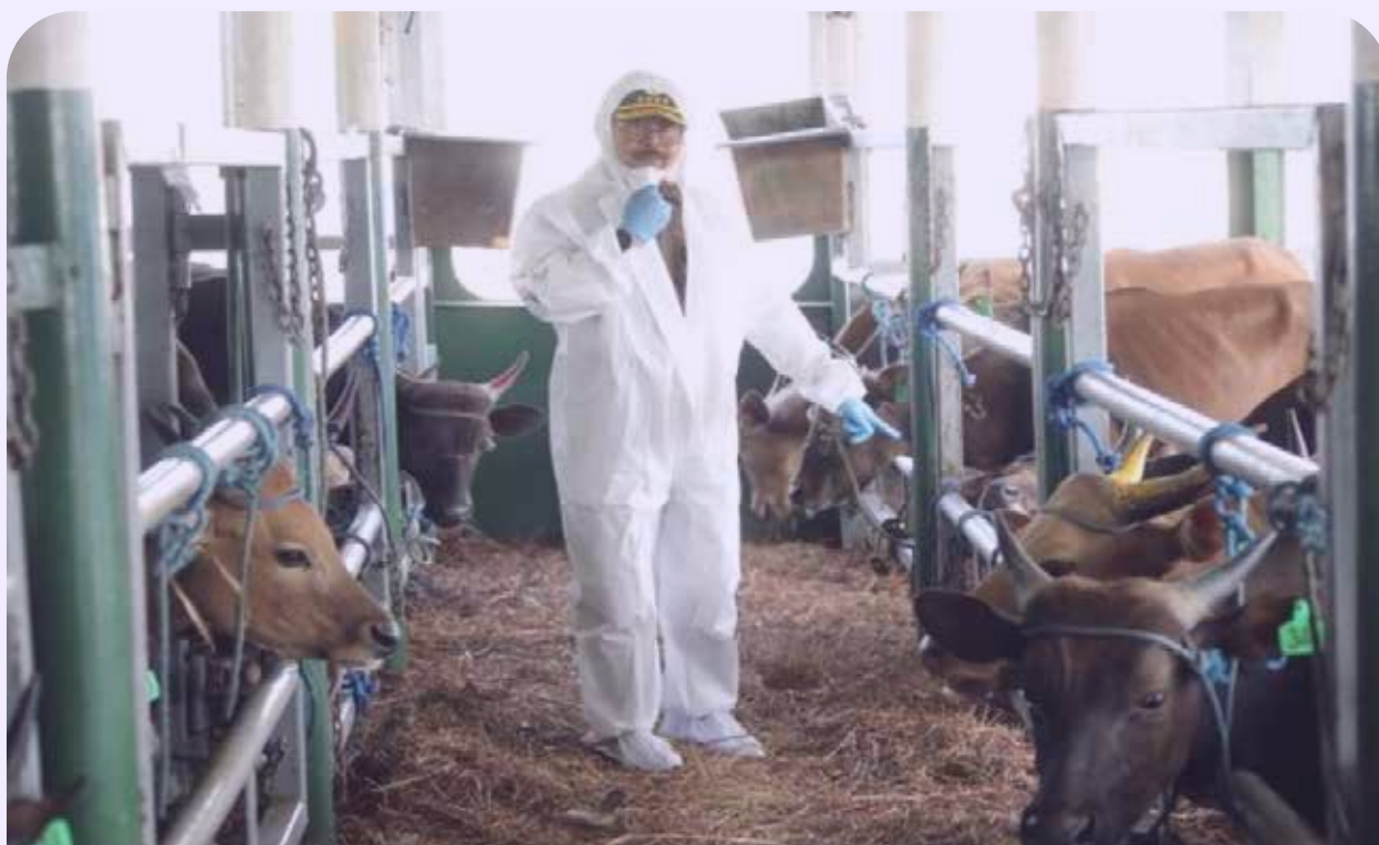
Menteri Pertanian Republik Indonesia, Syahrul Yasin Limpo sedang melakukan peninjauan pada kapal khusus angkutan ternak Camara Nusantara (CN)/The Minister of Agriculture of the Republic of Indonesia, Syahrul Yasin Limpo is conducting an inspection of the Camara Nusantara (CN) livestock vessel.

diperoleh dengan mudah dan harga yang terjangkau.