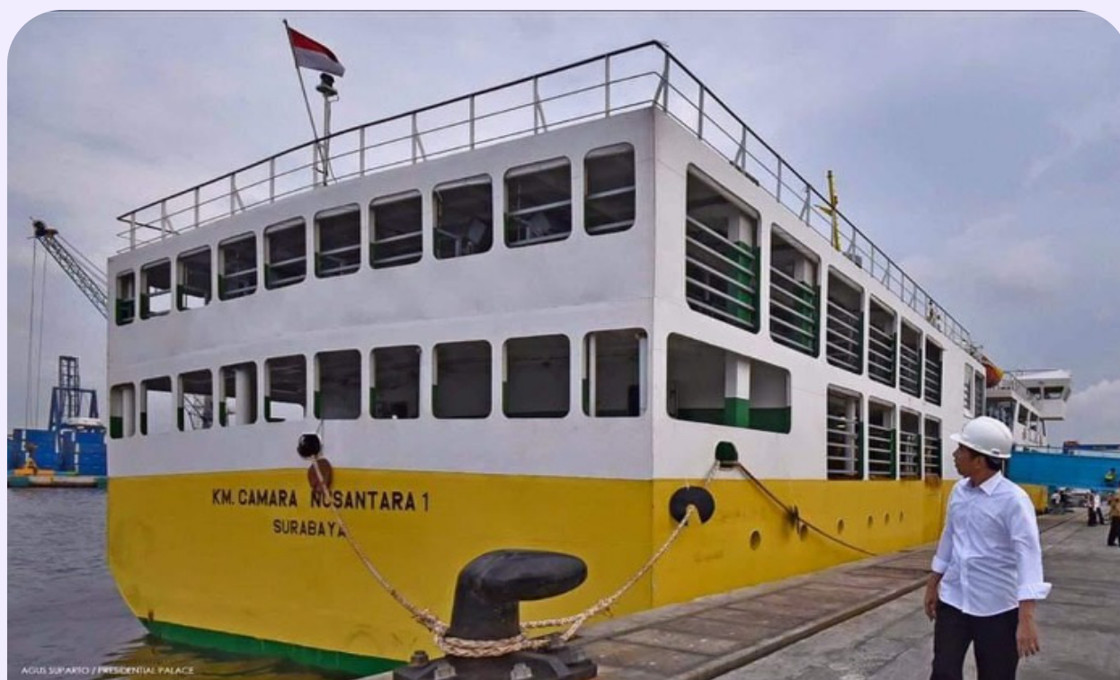
Presiden Republik Indonesia, Joko Widodo melihat kapal khusus angkutan ternak Camara Nusantara (CN)/The President of the Republic of Indonesia, Joko Widodo looks at the Camara Nusantara (CN) livestock vessel

khusus angkutan ternak telah beroperasi sejak 2015 silam dengan 1 armada kapal yang dioperasikan oleh PT. PELNI. Seiring bertambahnya animo pelaku usaha untuk memanfaatkan kapal khusus angkutan ternak Camara Nusantara (CN), pemerintah terus berupaya untuk menambah jumlah armada kapal khusus angkutan ternak. Hingga saat ini terdapat 6 (enam) unit kapal khusus angkutan ternak Camara Nusantara (CN) yang beroperasi dari daerah sentra produsen ke daerah sentra konsumen sesuai dengan jaringan trayek ada.