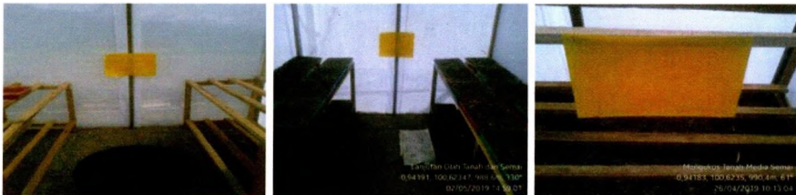
Perangkat lekat kuning