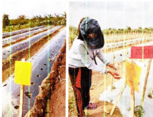
Perangkap lekat kuning