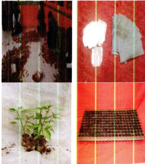
Wadah semai (bungkus nasi, kantong plastik, daun pisang, dan nampan)

Selanjutnya siapkan wadah semai berupa polibag kecil berupa: kertas bungkus nasi, kantong plastik es, bumbungan daun pisang, nampan persemaian (128 lubang), dan lain-lain. Disarankan menggunakan kertas bungkus nasi yang dipotong kecil-kecil (tinggi 3 cm) dan diletakkan di dalam nampan plastik (1 nampan plastik dapat diisi 100-120 polibag kecil). Media ini lebih mudah, murah, dan efisien.