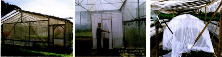
Berbagai macam tempat persemaian (dapat juga menggunakan rak-rak bertingkat)

Ukuran tempat persemaian disesuaikan dengan jumlah benih yang akan ditanam di lapangan. Kunci persemaian sehat adalah meminimalkan serangan hama/penyakit terutama infeksi karena serangga kutu kebul atau penyebaran virus. Untuk itu, persemaian harus ditutup dengan menggunakan kain kelambu (sifon) dan di bagian atas memakai plastik transparan. Sebelum melakukan penyemaian, pastikan tempat persemaian sudah steril dengan cara: (1) Penyemprotan tempat persemaian dengan insektisida spirotetramat (Movento untuk kutu kebul) + imidakloprid (Providor/Demolish untuk kutu dan thrips); dan (2) Memasang perangkat kuning untuk memantau Bemisia tabaci sampai populasi nol.