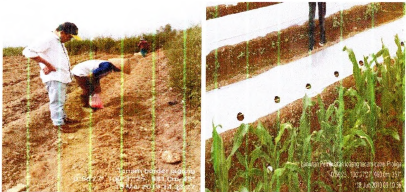
Tanam border jagung dan tampilan jagung sebelum tanam cabai merah

Sebulan sebelum tanam, lakukan penanaman tanaman border jagung di sekeliling hamparan pertanaman cabai merah dengan jarak rapat (10x10 cm) sebanyak 2-4 baris. Selanjutnya, seminggu sebelum tanam, pasang alat perangkap lekat kuning sebanyak 40 bh/ha. Sebelum penutupan MPHP, lakukan penyemprotan bedengan dengan pestisida nabati. Setelah tanam, berikan insektisida Curater 3G di lubang tanam sesuai dosis anjuran.