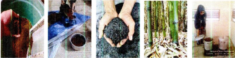
Media semai (tanah, pupuk kandang, sekam bakar, dan tanah rumpun bambu) dan proses pengukusan

lakukan pencampuran dengan tanah halus yang berasal dari rumpun bambu.