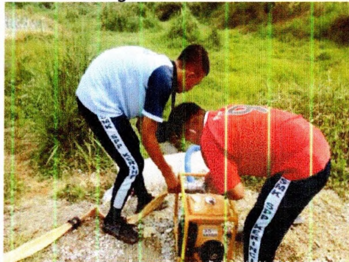
Mengairi lahan saat berbunga