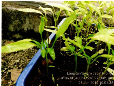
Benih cabai merah siap ditanam

Benih sehat dan berumur 4-5 minggu setelah semai, diangkut ke lapangan. Benih ditanam pada lubang yang telah disiapkan, dengan pola dua-satu dua-satu benih per lubang tanaman. Artinya, pada setiap barisan tanaman, benih ditanam dengan jumlah 1 benih/lubang tanam, lalu 2 benih/lubang tanam, dan dilanjutkan lagi dengan 1 benih/lubang tanam, dan seterusnya. Lakukan penyisipan bila mendapatkan benih tidak tumbuh/mati pada umur 1 minggu setelah tanam. Siapkan benih cadangan yang dipindahkan ke dalam polibag besar (sebanyak 5-10%). Benih cadangan ini digunakan untuk menyisip tanaman yang mati setelah tanaman cabai merah cukup besar di lapangan.