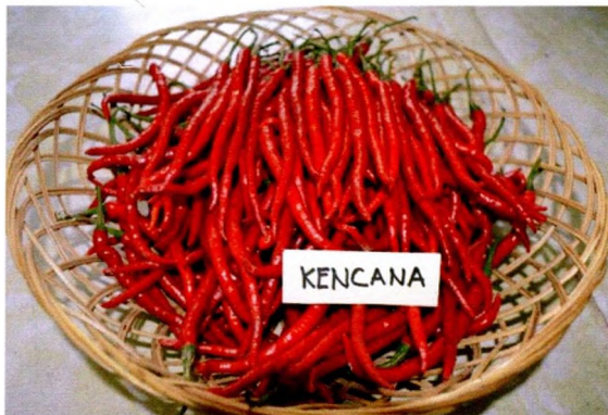
Varietas Kencana (produktivitas 12,1-22,9 t/ha)