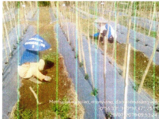
Penyiangan secara manual