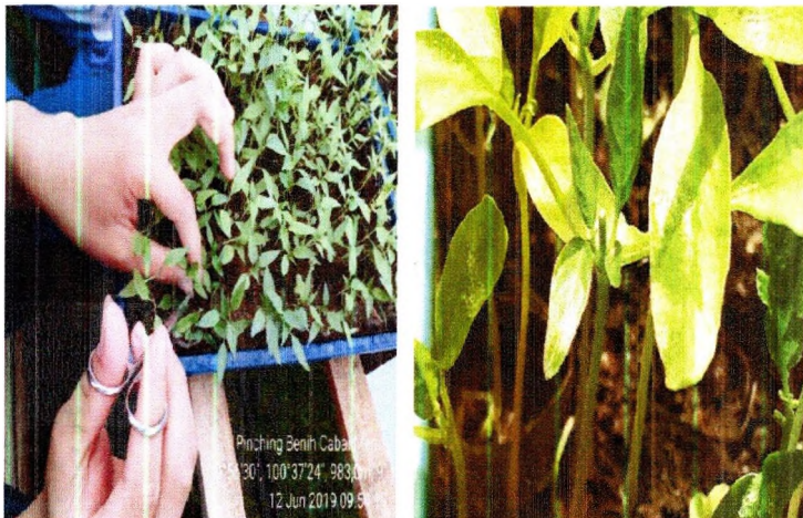
Teknik pinching dan hasil pinching di persemaian

Pada saat semai telah berumur 2-3 minggu (telah muncul 2 cabang ke samping (lateral) dan 1 cabang ke atas (apikal)), lakukan kegiatan " pinching ". Kegiatan pinching (jepitan) merupakan tindakan pembuangan pucuk terminal dari benih asal, untuk menghentikan dominasi tunas apikal (tunas yang tumbuh dipucuk/puncak batang). Bertujuan untuk: (1) merangsang tumbuhnya tunas-tunas lateral dari ketiak daun; dan (2) menstimulasi pertumbuhan tunas-tunas lateral yang kemudian dipelihara lebih lanjut hingga membentuk kuncup bunga. Dominasi apikal diartikan sebagai persaingan antara tunas pucuk dengan tunas lateral dalam hal pertumbuhan. Selama masih ada tunas pucuk/apikal, pertumbuhan tunas lateral akan terhambat sampai jarak tertentu dari pucuk. Kelebihan pinching adalah dapat menjadikan arsitektur tanaman lebih baik, jumlah cabang lebih banyak, dan produktivitas lebih tinggi. Namun juga memiliki kelemahan, antara lain: pertumbuhan tanaman terhambat dan masa berbunga lebih lambat (2-3 minggu).