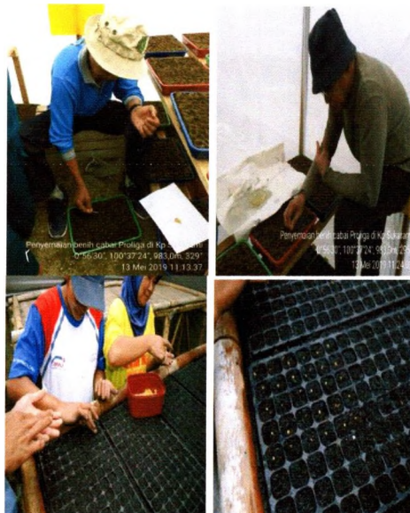
Teknik menyemai di wadah semai

Pastikan terlebih dahulu media semai disiram sampai jenuh air. Selanjutnya lakukan penyemaian sebanyak 1-2 biji per wadah semai. Setelah 5-7 hari setelah semai, benih akan tumbuh.