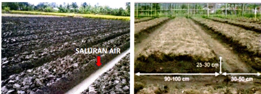
Ukuran bedengan (guludan)

Lakukan pengolahan tanah yang bertujuan untuk memperbaiki drainase dan aerasi tanah dengan cara meratakan permukaan tanah, serta mengendalikan gulma dan akar-akar tanaman yang dapat tumbuh dan berkembang dengan leluasa sehingga akan mengganggu pertumbuhan tanaman cabai merah nantinya. Lahan dicangkul sedalam 30-40 cm sampai gembur. Selanjutnya dibuat bedengan (guludan) dengan ukuran lebar 90-100 cm, tinggi 25-30 cm, dan jarak antar bedengan 30-50 cm.