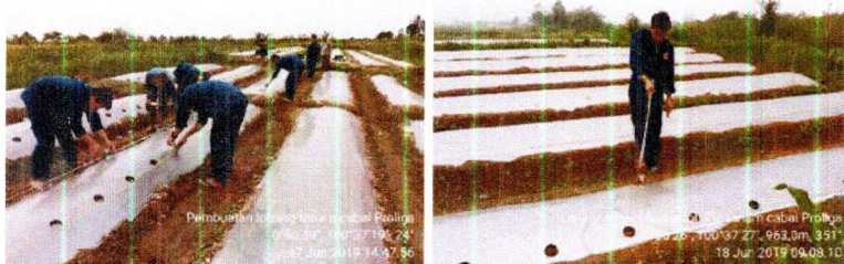
Pembuatan lubang tanam menggunakan pisau atau kaleng panas

Lubang tanam dapat dibuat dengan menggunakan pisau atau kaleng panas. Jarak tanam yang dianjurkan adalah 70 X 50 cm atau 60 x 50 cm atau 70 x 40 cm atau 60 x 40 xm dengan sistem tanam dua satu zig zag sehingga didapatkan populasi tanaman sekitar 30.000 tanaman (populasi tanaman dengan sistem satu-satu sekitar 19.000-20.000 tanaman/ha).