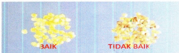
Contoh biji yang baik (kiri) dan tidak baik (kanan)

Tahapan membuat benih cabai terdiri dari: (1) buah dipotong bagian ujung dan pangkalnya; (2) dibelah membujur dan diambil bijinya; (3) dijemur sampai kering; (4) dibuang biji yang keriput dan hitam karena kemungkinan terinfeksi penyakit antraknos; dan (5) setelah kering, biji disimpan dalam botol dan ditutup dengan abu, lalu disimpan di tempat kering bersuhu rendah atau di dalam kulkas.