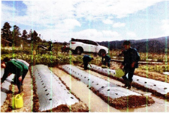
Mengairi lahan sebelum tanam