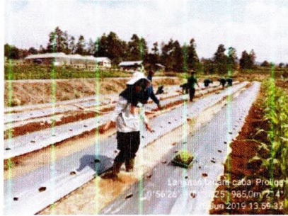
Menanam saat kondisi bedengan lembab