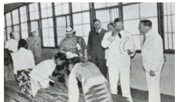
Kunjungan Gubernur Jenderal Tjarda van Starckenbower ke pabrik tembakau Besuki