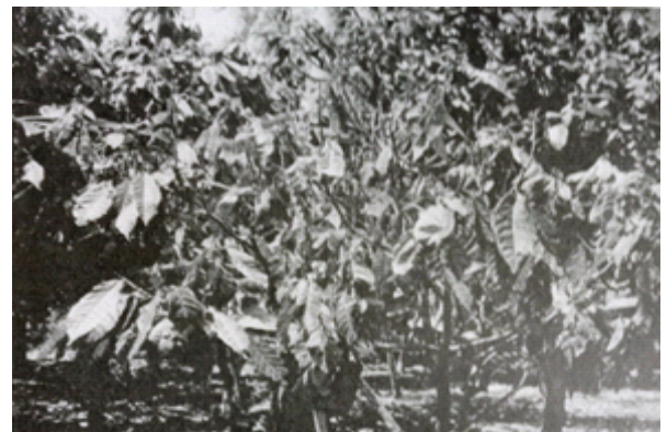
Pohon coklat yang terserang Helopelthis

Buku “ De Landbouw in De Indische Archipel ”. memiliki 4 jilid, yang menjelaskan kondisi pertanian saat itu. Buku tersebut berisi tentang kondisi pertanian sebelum tahun 1949. Digambarkan bagaimana pertanian tentang budi daya, pemanenan, dan