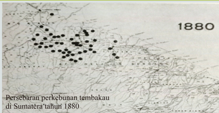
Persebaran perkebunan tembakau di Sumatera tahun 1880