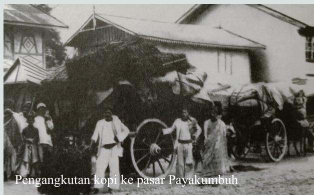
Pengangkutan kopi ke pasar Payakumbuh