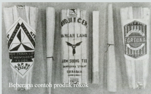
Beberapa contoh produk rokok