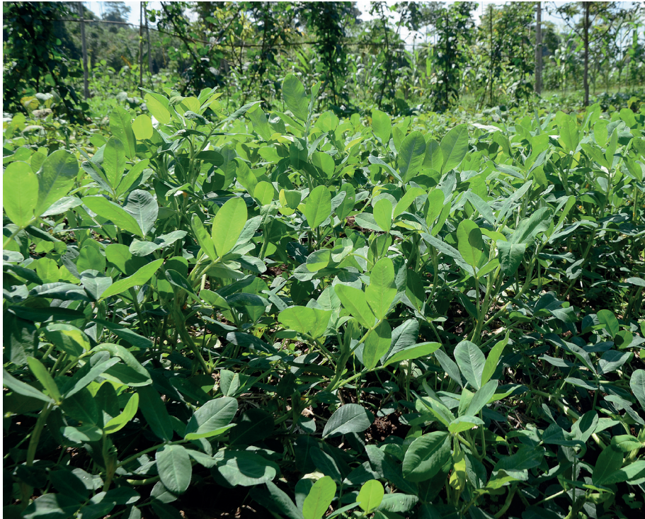
Budi daya kacang tanah secara organik meningkatkan hasil panen

Jika ginofor di ruas ketiga dan seterusnya ikut dibumbun, maka ukuran kacang yang terbentuk belakangan belum optimal saat panen. Selain itu, pengisian polong yang terbentuk belakangan bakal mengurangi aliran fotosintat—energi dan zat tepung hasil fotosintesis—ke polong yang lebih dahulu muncul. Padahal ketika panen, ukuran dan biji polong yang terakhir terbentuk tidak maksimal sehingga hanya masuk kategori apkir. Lazimnya petani membiarkan semua