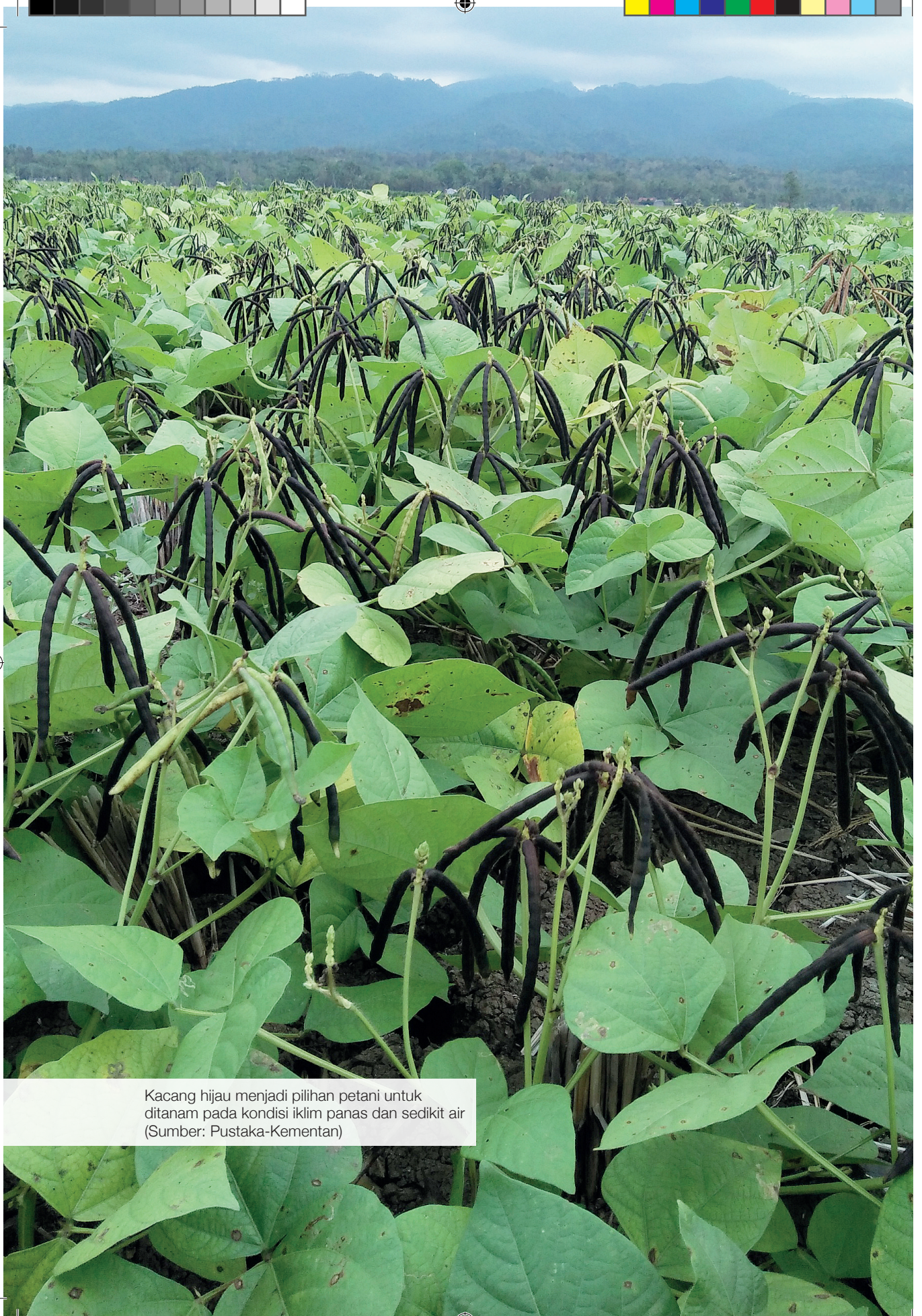
Kacang hijau menjadi pilihan petani untuk ditanam pada kondisi iklim panas dan sedikit air