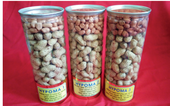
Varietas unggul kacang tanah di Indonesia