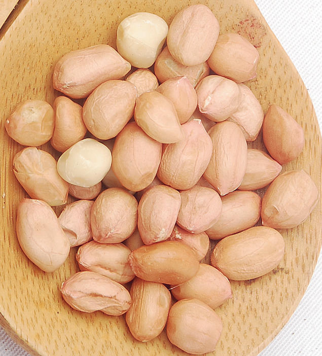
Kacang tanah dan kacang hijau termasuk komoditas pangan multifungsi