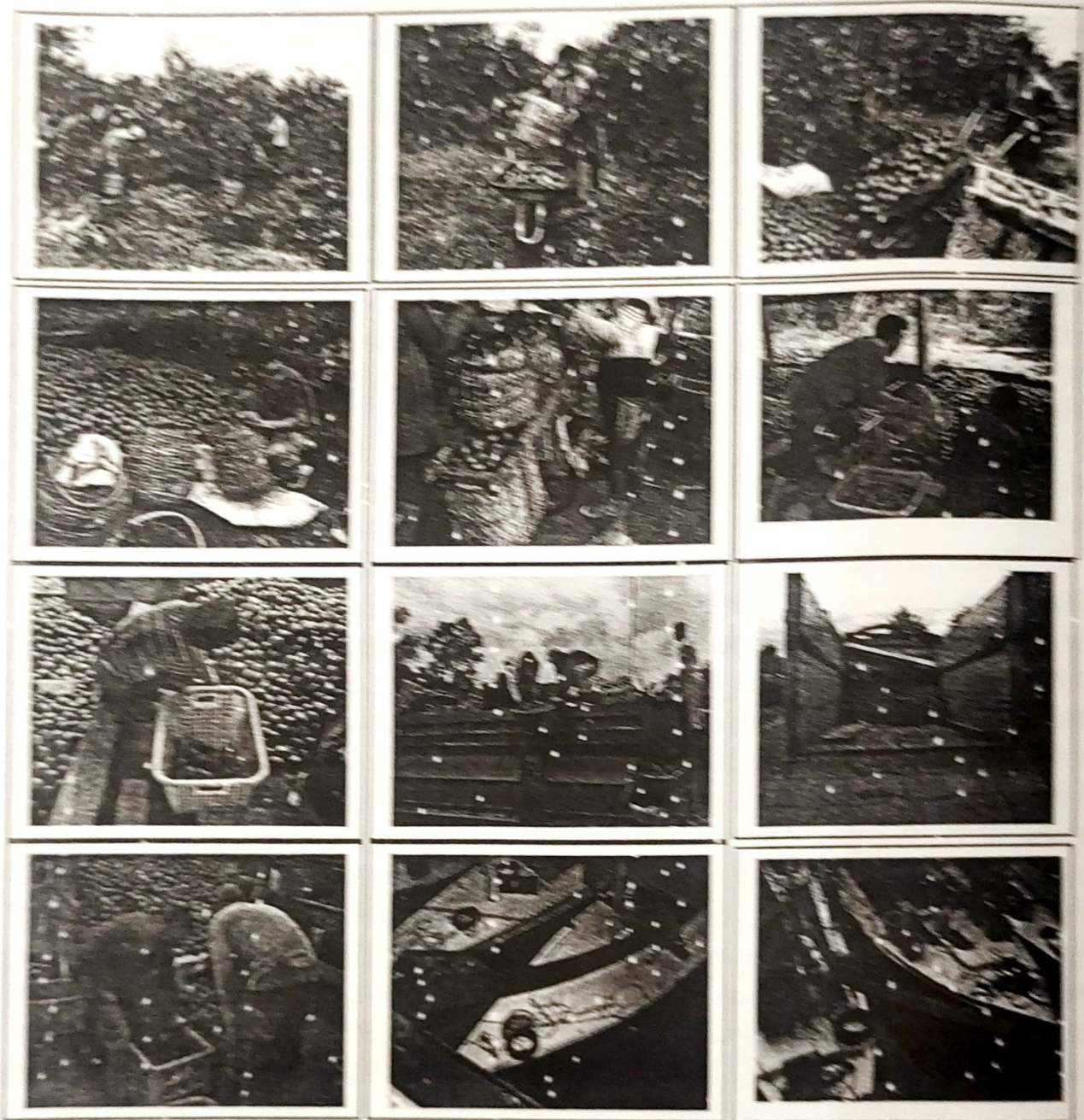
Gambar 1. Proses Pemindahan Produksi Jeruk dari Kebun Sampai ke Kapal di Sentra Produksi Jeruk Mamuju Utara

dan muncul novel, namun dari segi daya simpan ketebalan ini mampu meningkatkan daya saing tersendiri karena ketahanannya.