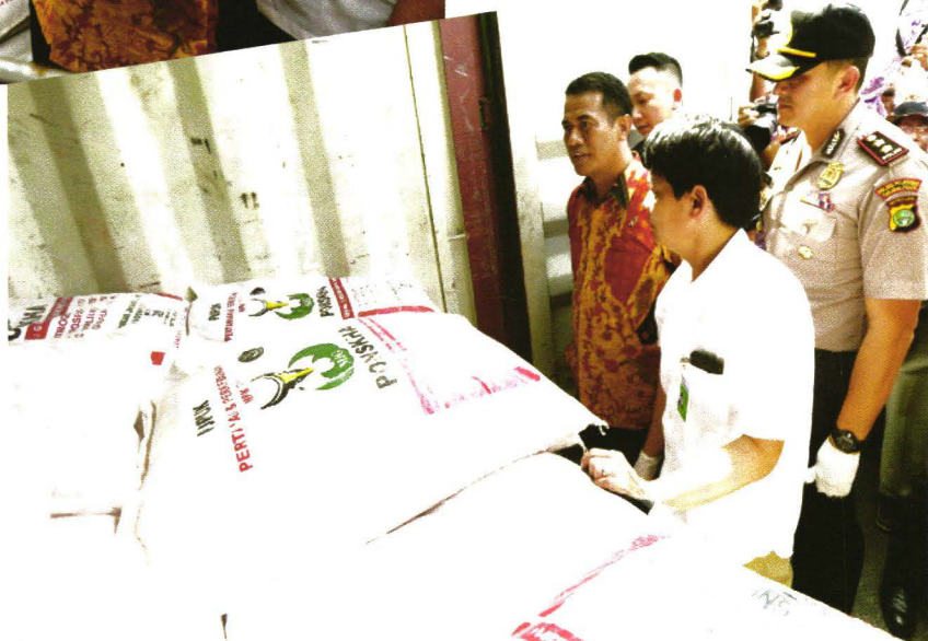
Mentan Andi Amran Sulaiman saat menyaksikan temuan pupuk ilegal di Pelabuhan Tanjung Priok.

Para tersangka memproduksi dan mengedarkan pupuk tanpa ijin yang sah, diwaktu menjalankan operasinya