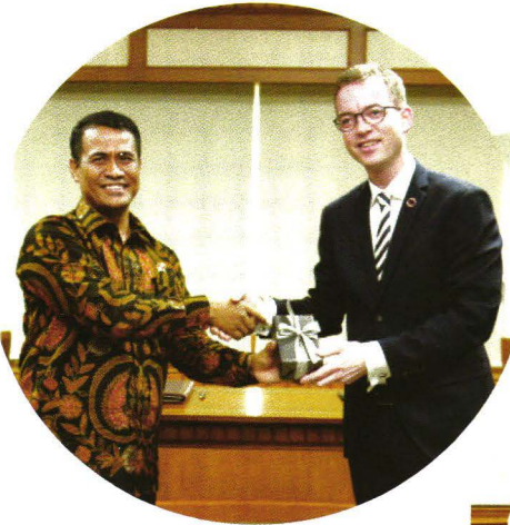
Mentan Andi Amran Sulaiman dengan Menteri Lingkungan dan Pangan Denmark menandatangani nota kesepahaman di Kanpus Kentan