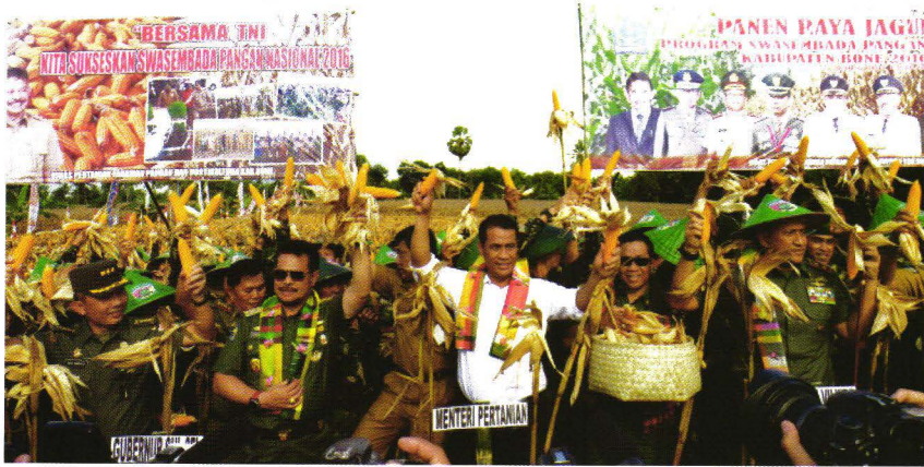
Mentan Andi Amran Sulaiman beserta Gubernur Sulsel, Aster TNI, DPRD, Bupati Bone saat melakukan panen raya jagung di Tabbae, Banteng Tellue, Kecamatan Amali, Bone.

pertanian jagung seluas 600 Ha di Dusun Benteng Tellue Desa Tambbae Kab. Bone. Mentan sangat mengapresiasi kinerja Pemda Bone yang dibantu oleh TNI, Polri dan penyuluh yang mampu menghasilkan 13 Ton per Hektarnya.