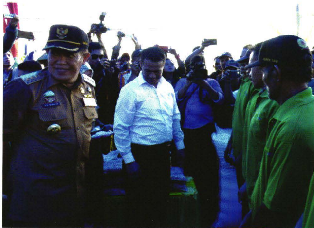
Mentan Andi Amran Sulaiman beserta DPR RI, Bupati Bulukumba, Aster TNI, saat melakukan audiensi dengan masyarakat pada acara Panen dan Serap Gabah Petani.