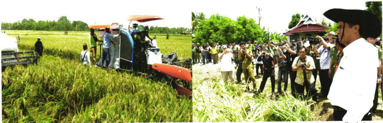
Mentan Andi Amran Sulaiman beserta Aster TNI, Bupati Wajo pada saat Panen dan Serap Gabah Petani di Desa Tonralipu, Kecamatan Tansitolo, Kabupaten Wajo, Sulsel.