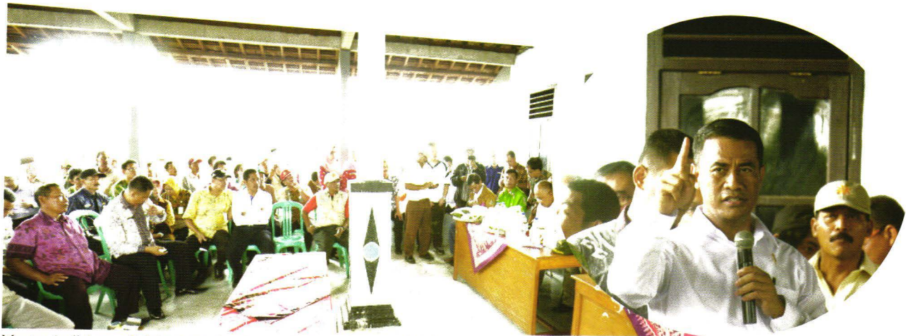
Mentan Andi Amran Sulaiman memberikan sambutan pada saat melakukan panen raya padi di Desa Bungo, Kecamatan Wedung, Kabupaten Demak Jawa Tengah.