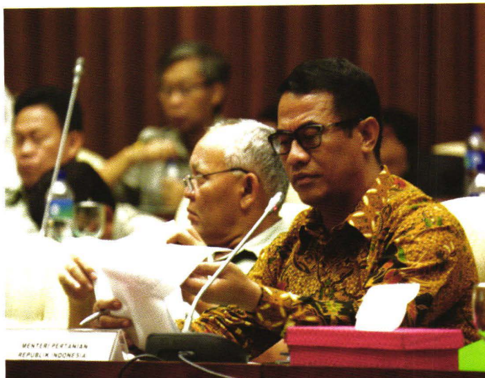
Mentan Andi Amran Sulaiman saat mengikuti rapat kerja dengan Komisi IV DPR RI di Gedung Nusantara, kompleks MPR/DPR/DPD, Senayan, Jakarta.

“Penurunan harga gabah menunjukkan bahwa petani merupakan pihak selalu merugi. Masalah itu harus mendapat perhatian semua pihak terkait. Hingga saat sekarang Kementan terus mengupayakan langkah konkret dengan meminta pihak Bulog agar melakukan langkah penyerapan gabah dengan cepat, sehingga petani bisa memperoleh harga yang menguntungkan”