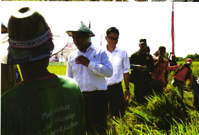
Mentan Andi Amran Sulaiman beserta Bupati Soppeng dan Aster TNI pada saat Panen Raya Serap Gabah Petani di Salokaraja, Kabupaten Soppeng.

Dihadapan anggota DPR-RI, Bupati dan Wakil Bupati Soppeng serta