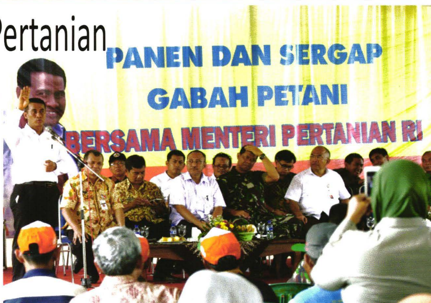
Mentan Andi Amran Sulaiman saat memberikan sambutan di depan para petani serap gabah petani di Kabupaten Brebes, Jawa Tengah.

"Penggunaan combine harvester, terbukti menguntungkan petani. Menghemat biaya panen dan tanam sebesar 50 persen. keberadaan teknologi ini tidak akan merusak nilai sosial seperti gotong royong yang telah dilakukan masyarakat saat panen gabah. Buruh panen tetap berfungsi seperti biasanya hanya dilengkapi dengan teknologi, sehingga pendapatannya meningkat tiga kali lipat"