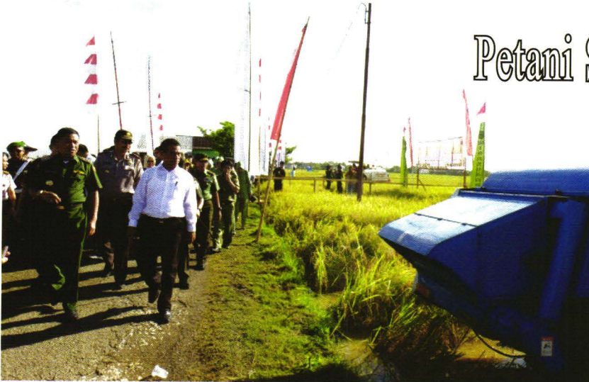
Mentan Andi Amran Sulaiman beserta Anggota DPR RI, Aster TNI, Bupati, SKPD Pangkep saat panen raya padi di Desa Bontolangkasa, Kecamatan Minasate'ne, Kabupaten Pangkep, Sulse.

"Oleh itu, dibutuhkan perhatian pemerintah pusat untuk menyalurkan bantuan agar petani di Wajo lebih bergairah melakukan penanaman," terang Bupati Wajo.