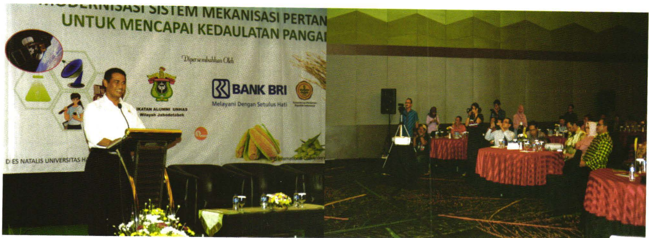
Mentan Andi Amran Sulaiman memberikan Sambutan pada Seminar Nasional Modernisasi Sistem Mekanisasi Pertanian Ikatan Alumni Universitas Hasanudin (Unhas) di Kota Bogor.