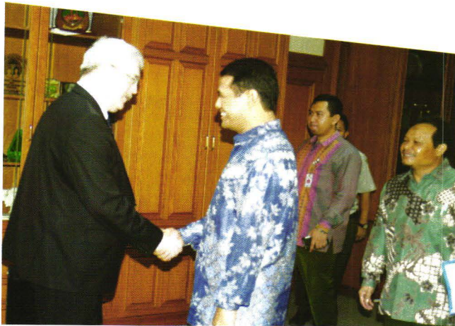
Mentan Andi Amran Sulaiman melakukan pertemuan dengan Menteri Pangan dan Pertanian Jerman di Hotel Mulia.

"Besaran alokasi anggaran DAK tidak dipengaruhi oleh siapa pejabatnya akan tetapi dipengaruhi oleh kriteria khusus dan kriteria umum, dalam hal ini Kementerian Pertanian yang menentukan kriteria khusus" ujar Sekjen.