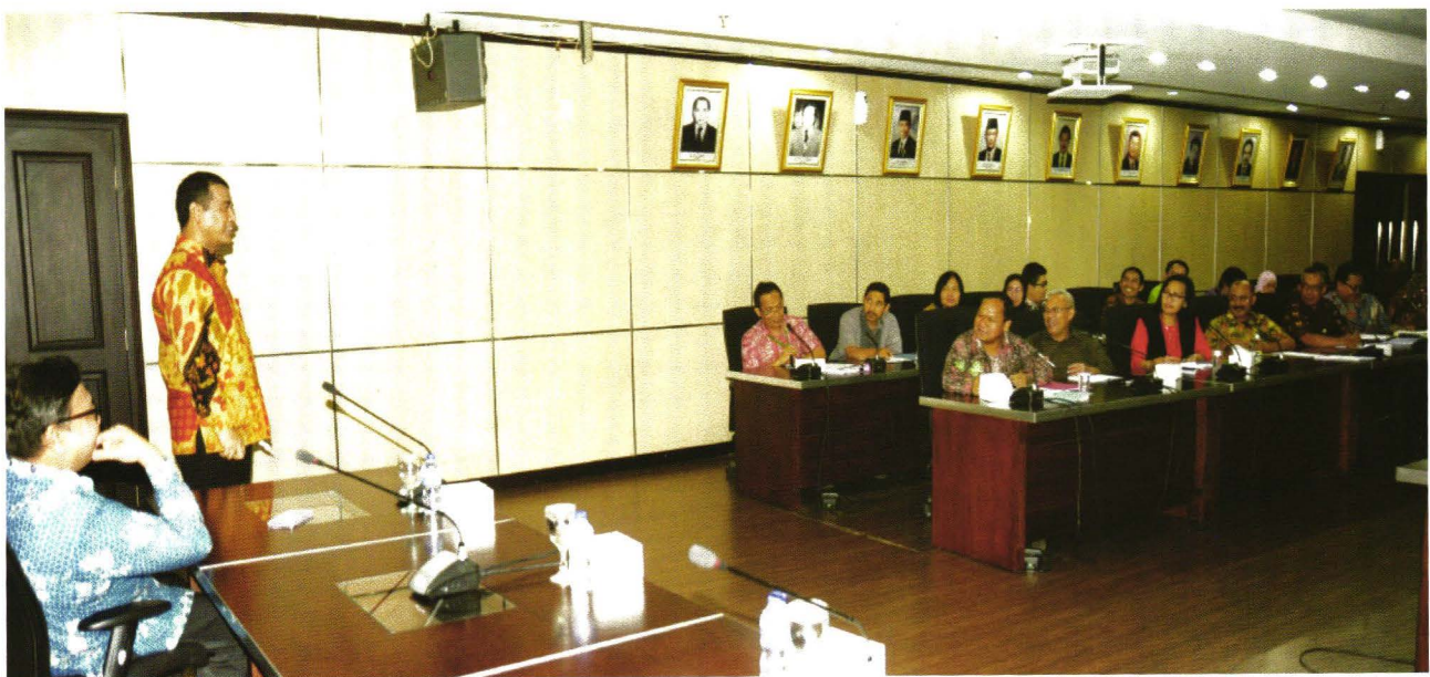
Mentan Andi Amran Sulaiman saat melakukan kunjungan mendadak di Ditjen PKH, di Gedung C Kanpus Kementan.