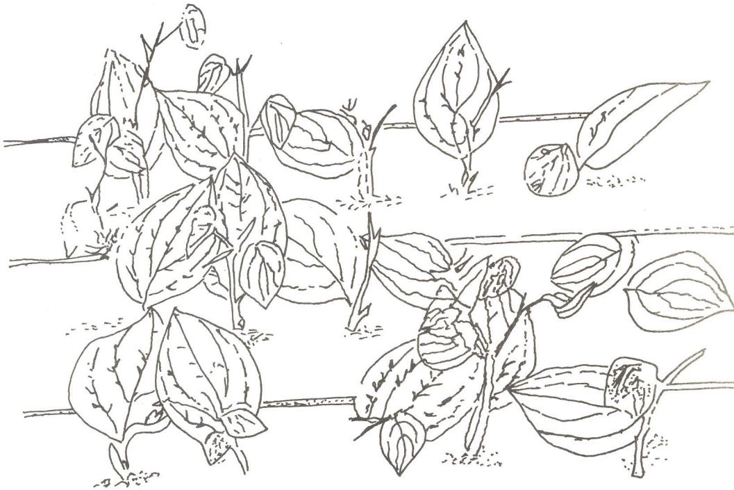
Gambar 2. Semaian setek lada umur 30 hari dengan 2 - 3 daun muda, sudah harus dipindah ke pembibitan.

Lama penyemaian di bak pasir \pm 30 hari, pada saat mana akar dan tunas telah tumbuh dengan 2 - 3 daun muda (Gambar 2).