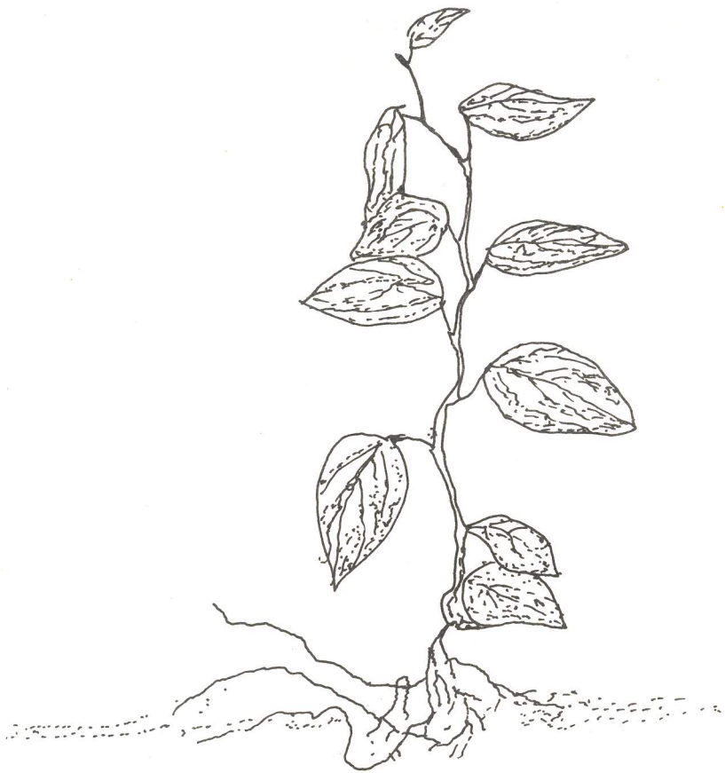
Gambar 3. Bibit lada asal setek satu ruas berdaun tunggal siap untuk ditanam di kebun.