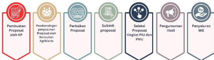
Gambar 1. Proses Bisnis