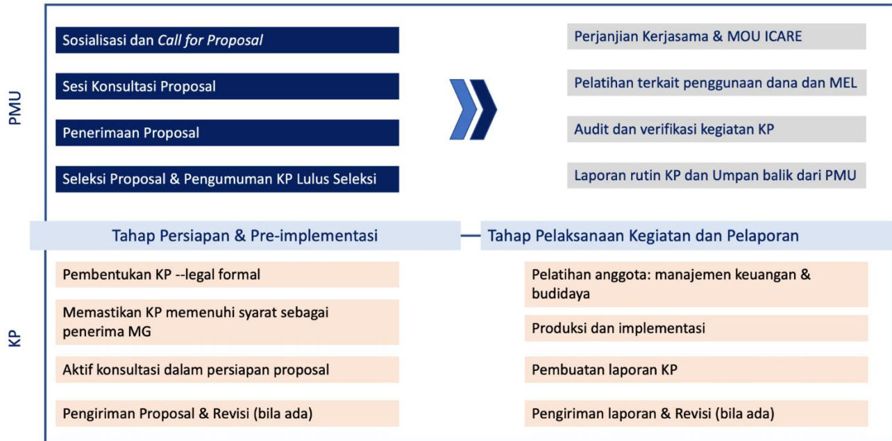
Gambar 2. Skema pelaksanaan Matching Grant (MG)