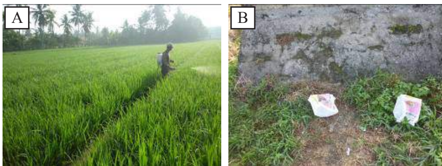
Gambar 2. (A) Aplikasi pestisida yang dilakukan petani dan (B) kemasan pestisida yang dibuang secara sembarangan.

dan ketika tanaman padi berumur 15, 30, 45 hari setelah tanam (hst). Sedangkan aplikasi fungisida dilakukan pada 45-60 hst dan biasanya dicampur dengan insektisida. Penyemprotan dilakukan jam 6-9 pagi atau 4 sampai dengan 5.30 sore. Pencampuran beberapa pestisida sering dilakukan oleh petani selain karena untuk menekan jumlah tenaga untuk menyemprot, juga disebabkan karena mereka beranggapan pestisida tersebut akan lebih efektif dalam mengendalikan hama dan penyakit. Hasil wawancara diketahui bahwa petani belum memperhatikan keamanan dan keselamatan dalam menyemprot. Penggunaan pakaian pelindung yang seadanya serta menyemprot tanpa memperhatikan kecepatan dan arah angin masih dilakukan petani. Bahkan beberapa petani membuang sisa kemasan pestisida yang telah habis secara sembarangan (Gambar 2). Padahal kesalahan dalam aplikasi ini dapat berakibat pada keracunan yang dialami petani itu sendiri.