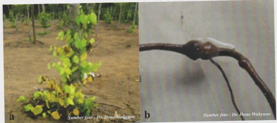
Gambar 1. Serangan penyakit kuning pada tanaman lada. Gejala penyakit kuning pada lada (a) dan akar lada yang terserang nematoda peluka dan puru akar (b).

semakin lama daun akan mengarah ke bagian batang (Gambar 1a). Untuk memastikan patogen penyebab penyakit kuning, Suryanti et al. (2017) telah melakukan penelitian dengan menginokulasikan nematoda Meloidogyne incognita dengan Fusarium solani pada lada. Interaksi antara kedua patogen tersebut bersifat sinergis karena setelah dilakukan inokulasi kedua patogen secara bersamaan, gejala penyakit kuning lebih tinggi tingkat keparahannya dibandingkan dengan lada yang diinokulasi patogen tersebut secara terpisah. Ciri akar tanaman lada yang terserang nematoda parasit Radopholus similis , yaitu rongga akar tampak luas, terdapat lesi, bagian floem dan kambium menjadi hancur akibat infeksi nematoda ini. Pengambilan sampel akar dan tanah merupakan cara yang tepat untuk mendeteksi keberadaan nematoda peluka akar (Anonim, 2008).