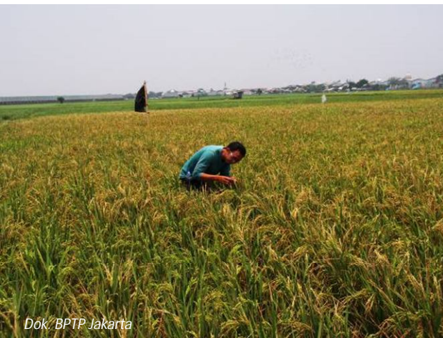
Dok. BPTP Jakarta

antara wadah gabah dengan lantai semen. Sedangkan penyimpanan gabah untuk benih dapat menggunakan kantong plastik yang dimasukkan lagi dalam kaleng dan ditutup sampai kedap udara dengan menggunakan lilin.