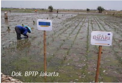
Dok. BPTP Jakarta

Sistem tanam yang direkomendasikan oleh Badan Penelitian dan Pengembangan Pertanian adalah sistem jajar legowo. Cara tanam jajar legowo untuk padi sawah dapat dilakukan dengan