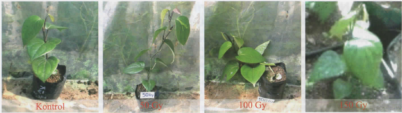
Gambar 3. Penampilan benih lada hasil irradiasi dibandingkan dengan kontrol