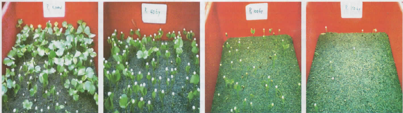
Gambar 1. Perkecambahan biji lada yang diberi irradiasi sinar gamma 10; 50, 100, dan 150 Gy

kegiatan ini LD50 berada di antara 10-150 Gy sehingga perlu dicari dosis LD50 pada biji lada Petaling 1.