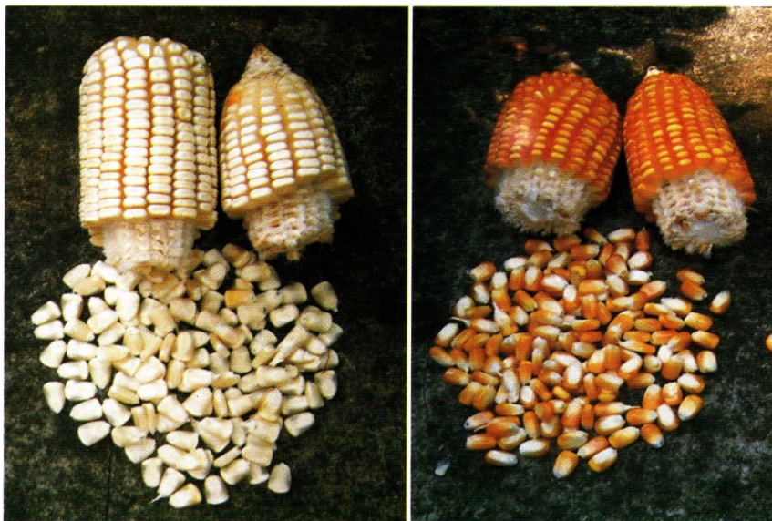
Jagung berprotein tinggi varietas Srikandi Putih-1 dan Srikandi Kuning-1, dilepas tahun 2004