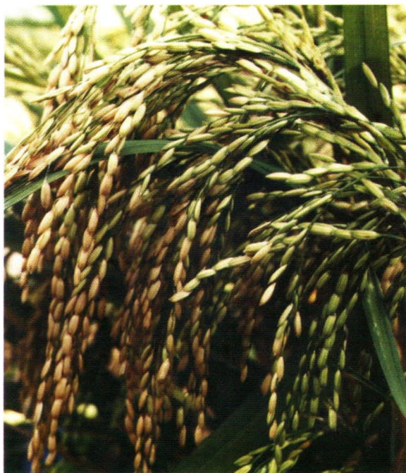
Padi semi tipe baru varietas Gilirang, aromatik, hasil 6,0-7,3 t/ha, dilepas tahun 2002