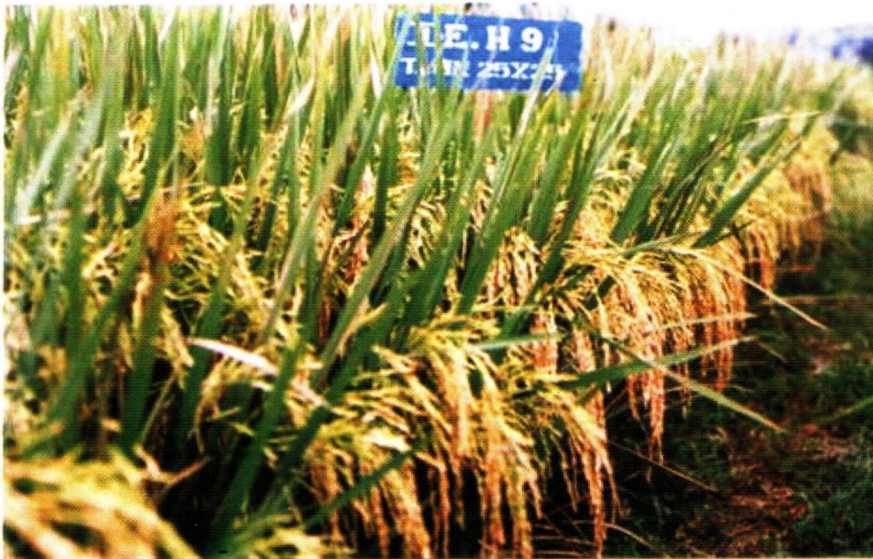
Padi hibrida varietas HIPA-4, daya hasil 7,8-10,4 t/ha, cocok dikembangkan di lahan sawah irigasi, dilepas tahun 2004