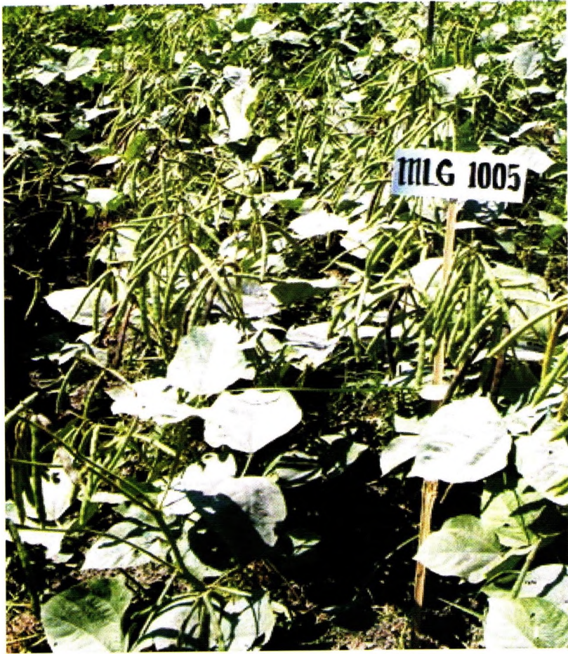
Kacang hijau varietas Kutilang, tahan penyakit embun tepung, hasil 1,1-2,0 t/ha, dilepas tahun 2004.