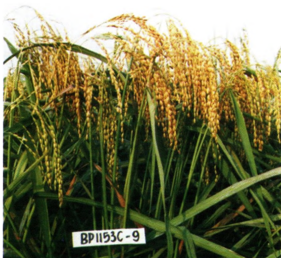
Padi gogo varietas Situ Patenggang, hasil 3,4-5,6 t/ha, aromatik, dilepas tahun 2002