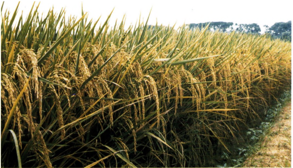
Padi sawah varietas unggul tipe baru Fatmawati, hasil 6,0-9,0 t/ha, dilepas tahun 2003