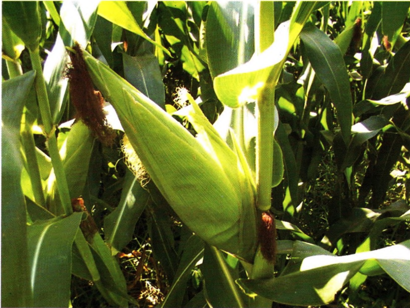
Jagung varietas Sukmaraga, adaptif di lahan masam, hasil 6,0-8,5 t/ha, dilepas tahun 2003