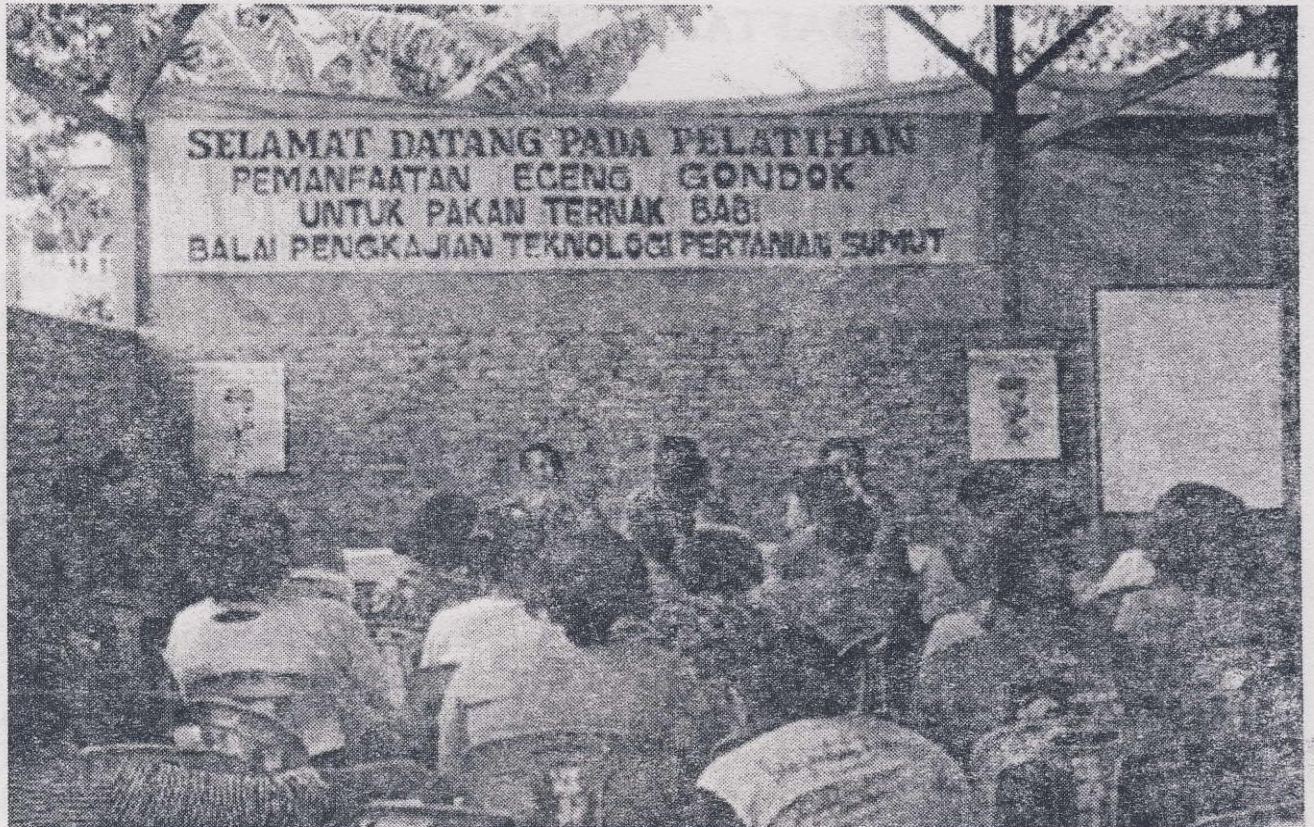
Gambar 3. Sosialisai dan Pelatihan Pemanfaatan Tepung Eceng gondok Bahan akan Ternak di Pangururan