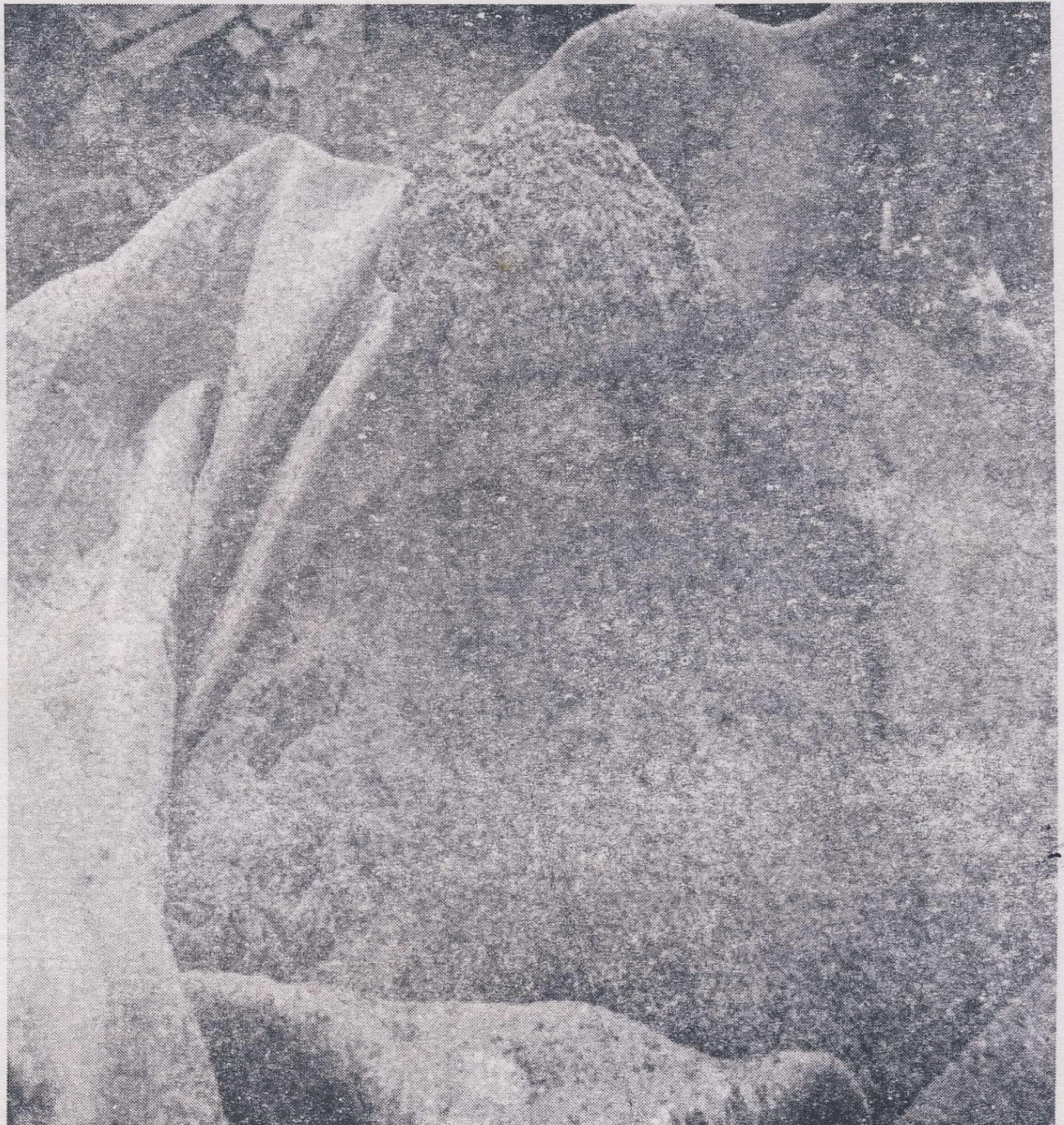
Gambar 2. Tepung Eceng gondok Sebagai Campuran Bahan Pakan Ternak

telah dikeringkan, digiling secara mekanis menggunakan alat penggiling ( hammer mill ) sehingga berbentuk tepung.