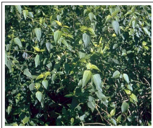
Gambar 3. Ki rinyuh dewasa membentuk semak

Menurut DEPARTMENT OF NATURAL RESOURCES, MINES AND WATER (2006), setiap tumbuhan dewasa mampu memproduksi sekitar 80 ribu biji setiap musim. Sifat-sifat inilah yang mungkin ditakuti peneliti padang rumput Australia sehingga berupaya untuk menangkalnya dengan berbagai cara.