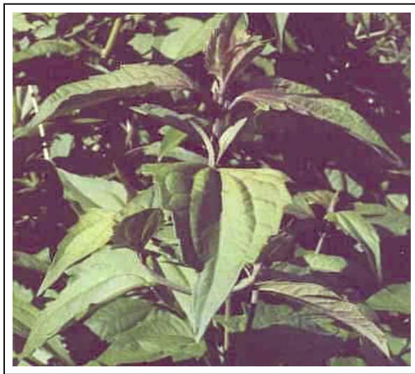
Gambar 2. Ki rinyuh dewasa

Tinggi tumbuhan dewasa bisa mencapai 5 m, bahkan lebih (DEPARTMENT OF NATURAL RESOURCES, MINES AND WATER, 2006). Batang muda berwarna hijau dan agak lunak yang kelak akan berubah menjadi coklat dan keras (berkayu) apabila sudah tua (Gambar 2). Letak cabang biasanya berhadap-hadapan (oposit) dan jumlahnya sangat banyak. Percabangannya yang rapat menyebabkan berkurangnya cahaya matahari ke bagian bawah, sehingga menghambat pertumbuhan spesies lain, termasuk rumput yang tumbuh di bawahnya (Gambar 3). Dengan demikian gulma ini dapat tumbuh sangat cepat dan mampu mendominasi area dengan cepat pula. Kemampuannya mendominasi area dengan cepat ini juga disebabkan oleh produksi bijinya yang sangat banyak.