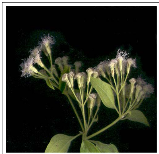
Gambar 1. Bentuk daun dan bunga Ki rinyuh