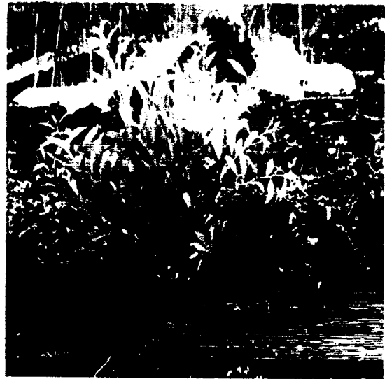
Gambar 2. Keragaan pertumbuhan kopi klon Andongsari dan penaung, di Desa Renah Kayu Embun, Kerinci, 2003.

Dengan adanya pohon penaung/pelindung dapat menurunkan suhu udara rata-rata 7^{\circ}\text{C} pada siang hari dan meningkatkan suhu udara rata-rata 3^{\circ}\text{C} pada malam hari di Indonesia, sementara di Afrika Timur mampu meningkatkan suhu rata-rata 4-5^{\circ}\text{C} pada malam hari (Wrigley 1988). Penggunaan pohon pelindung mampu menekan kerusakan oleh kabut karena suhu udara pada malam hari dapat ditingkatkan (Carramori et al 1996). Hasil penelitian di Meksiko dilaporkan bahwa disamping menurunkan kecepatan angin, pohon pelindung pada tanaman kopi dapat juga menurunkan suhu sekitar 5,4^{\circ}\text{C} pada siang hari dan 1,5^{\circ}\text{C} pada malam hari (Boer et al 1998).