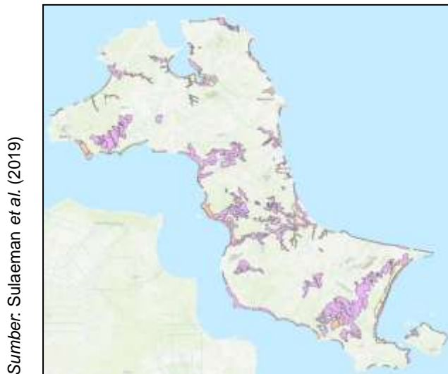
Gambar 1. Sebaran tanah berpasir di Pulau Bangka, Provinsi Kepulauan Bangka Belitung

Gambar 1 menyajikan contoh sebaran tanah berpasir di Pulau Bangka. Peta ini mengidentifikasi areal tanah berpasir berdasarkan satuan peta tanah dan warna menunjukkan proporsi tanah berpasir di areal tersebut. Seperti dilihat, peta menyajikan 3 warna berbeda: warna kuning untuk kurang dari 50%, warna orange untuk 75% atau lebih dan sisanya antara 50-75%. Persentase ini juga sekaligus menunjukkan akurasi data 50% artinya setengah wilayah tersebut kemungkinan akan dijumpai tanah berpasir. Karena ini hanya estimasi saja, maka pemetaan tanah berpasir yang diperlukan dan dilakukan secara selektif sesuai dengan prioritas dan tujuan pemanfaatannya.