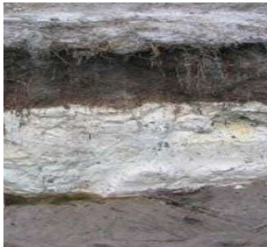
Gambar 3. Profil tanah berpasir (Jenis tanah Podsol/Spodosols) di Kalimantan Barat

Pupuk bukan satu-satunya input untuk tanah Spodosols, tetapi juga membutuhkan perbaikan untuk meningkatkan kemampuan tanah dalam menahan unsur hara tanah dan unsur hara yang ditambahkan dengan pemupukan. Untuk keperluan perkebunan perlu menerapkan sistem lubang lebar dan dalam untuk yang kemudian ditimbun dengan tanah yang sudah dicampur dengan bahan organik yang merupakan media yang aman untuk pertumbuhan akar dengan optimal.