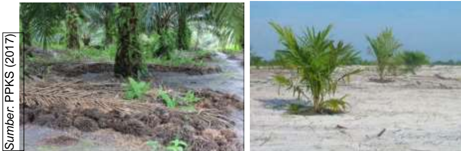
Gambar 4. Tanaman kelapa di sawit pada tanah pasir (Jenis tanah Spodosols)

menghindari kelebihan air saat musim hujan dan menyediakan air saat musim kemarau. Untuk meningkatkan kapasitas memegang air dan meningkatkan kesuburan tanah perlu dilakukan pemberian bahan organik secara rutin menggunakan tandan kosong sawit (TKS) atau kompos dengan dosis TKS 200kg/pohon atau kompos 100kg/pohon.