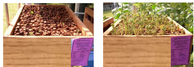
Gambar 1. Bibit unggul rami dari rizoma

Secara umum mutu bibit tanaman rami dipengaruhi oleh faktor-faktor ekologi, teknik produksi serta panen dan penanganan bibit. Faktor-faktor ekologi meliputi: tanah, curah hujan, cahaya, temperatur, dan kelembapan udara. Teknik produksi meliputi, teknik budi daya (pengolahan tanah, jarak tanam, pemupukan, penyiraman, penyiangan, seleksi/ roguing dan pengendalian hama dan penyakit) serta isolasi jarak. Sedangkan panen dan penanganan bibit mencakup: umur induk, umur bibit, cara panen, sortasi, pengolahan dan pengemasannya serta perawatan bibit sebelum ditanam.