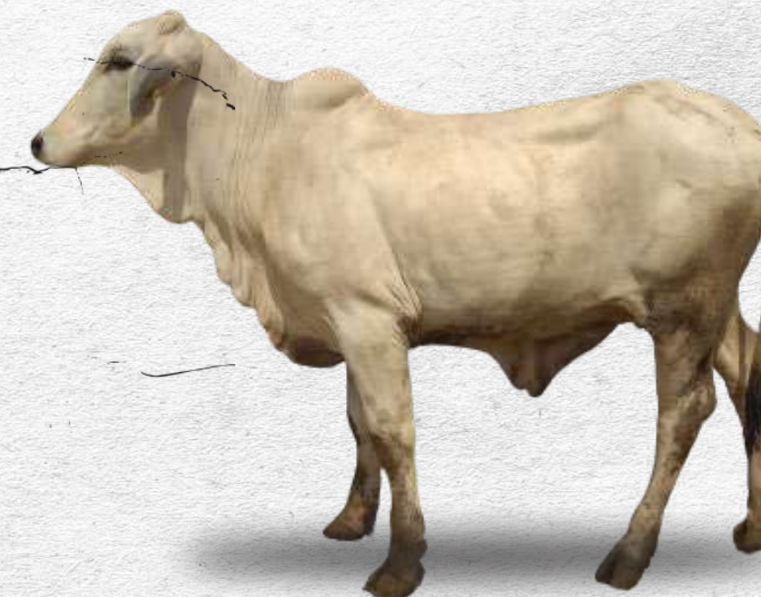
Bibit sapi brahman betina dewasa