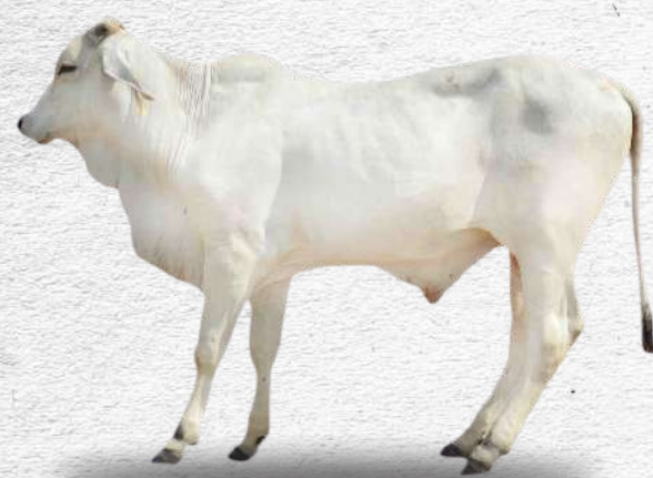
Bibit sapi brahman jantan muda

Bibit betina: sehat; tidak cacat fisik; ambing simetris, puting 4, bentuk puting normal; organ reproduksi normal; dan silsilah minimum 1 generasi.