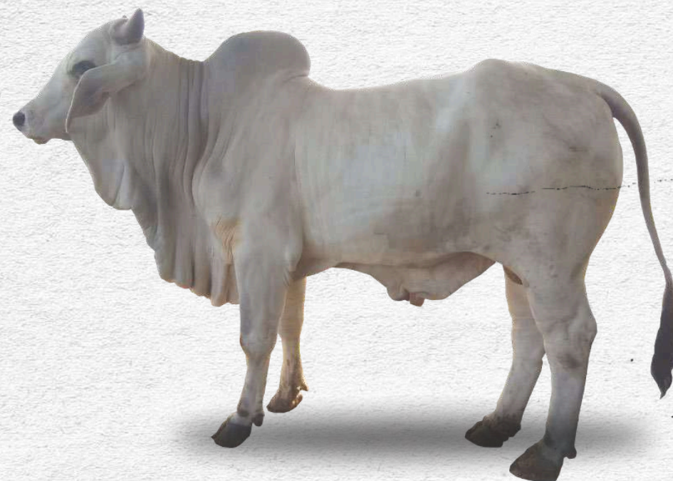
Bibit sapi brahman jantan dewasa