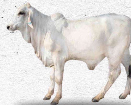
Bibit sapi brahman betina muda