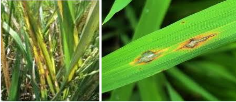
Gambar 22. Penampilan penyakit Bercak coklat padi gogo

Penyakit Bercak Coklat dapat dikendalikan dengan, Penanaman varietas yang tahan, menggunakan benih yang sehat, Pemupukan yang berimbang dengan pemberian unsur K yang cukup, Sanitasi lahan, pengolahan tanah yang sempurna, pengaturan jarak tanam sebaiknya system legowo, Aplikasi fungisida sebagai seedtreatment dan dipertanaman. Gunakan fungisida berbahan aktif mankozeb, ziram, klorotalonil dan tembaga hidroksida sebagai pencegah.