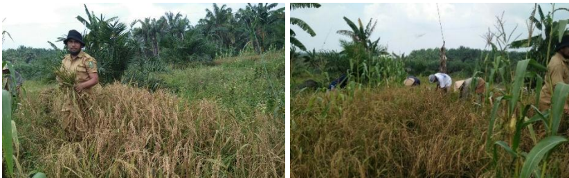
Gambar 29. Penampilan padi saat umur masak dan pemanenan

Panen dilakukan bila gabah 95% sudah menguning atau umur masak fisiologis. Tanaman padi gogo dapat dipanen pada umur 100-125 HST atau tergantung varietas padi gogo yang ditanam. Untuk varietas inpage 9 yang ditanam di desa Dayun, Kecamatan Dayun, Kabupaten Siak panen dilakukan pada umur 96 hari setelah tanam