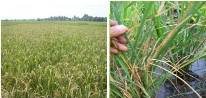
Gambar 12. Performan Penggerek batang pada fase vegetatif dan generatif (Artikel padi.com, 2018)

Hama Penggerek Batang menyerang pada fase vegetative dan generatif. Pada fase vegetatif larva, memotong bagian tengah anakan menyebabkan pucuk layu, kering dan mati. Serangan pada fase generatif menyebabkan malai muncul putih dan hampa.