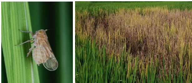
Gambar 11. Performa wereng coklat dan bentuk serangannya

Hama wereng coklat ini menyerang tanaman padi gogo pada fase muda dan fase tanaman tua, pada fase muda wereng coklat mengisap cairan tanaman, dan padi akan mulai menguning, mengering dan mati. Serangan wereng coklat pada tanaman tua pertumbuhan tanaman menjadi terhenti dan mengakibatkan bulir padi menjadi hampa.