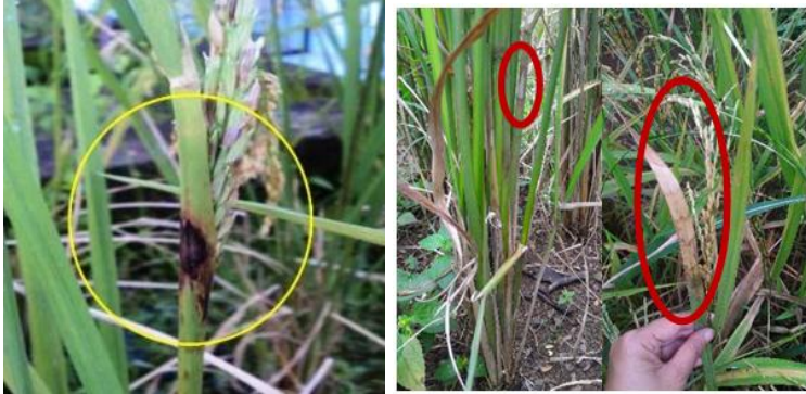
Gambar 21. Penampilan penyakit busuk pelepah pada tanaman padi gogo.

Pengendalian penyakit busuk pelepah pada tanaman padi gogo adalah dengan menggunakan varietas tahan, penyemprotan dengan menggunakan fungisida pada saat pembentukan anakan, Fungisida yang dipakai adalah Delsen, MX 200, Fujiwan atau Dithane M.45.