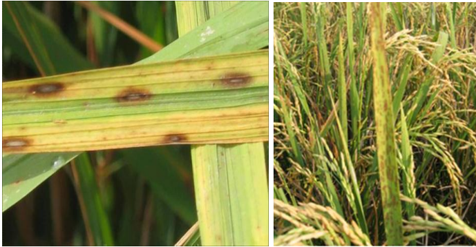
Gambar 24. Penampilan penyakit Bercak coklat sempit

1-1,5 mm. Banyaknya bercak makin meningkat pada waktu tanaman membentuk anakan. Pada serangan yang berat, bercak-bercak terdapat pada upih daun, batang, dan bunga. Pada saat tanaman mulai masak, gejala yang berat mulai terlihat pada daun bendera dan gejala paling berat menyebabkan daun mengering. Infeksi yang terjadi pada pelepah dan batang menyebabkan batang dan pelepah daun busuk sehingga tanaman menjadi rebah.