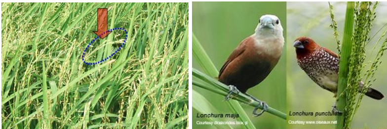
Gambar 17. Gejala serangan gerombolan burung pipit pada padi menyebabkan banyak bulir hilang (tanda panah) dan beberapa jenis burung yang memakan padi

Hama burung pada tanaman padi menimbulkan kerusakan pada pertanaman padi fase generatif, terutama padi stadia matang susu hingga pemasakan bulir (menjelang panen). Serangan burung mengakibatkan banyak biji yang hilang sehingga malai tidak ada bijinya (Gambar 2)