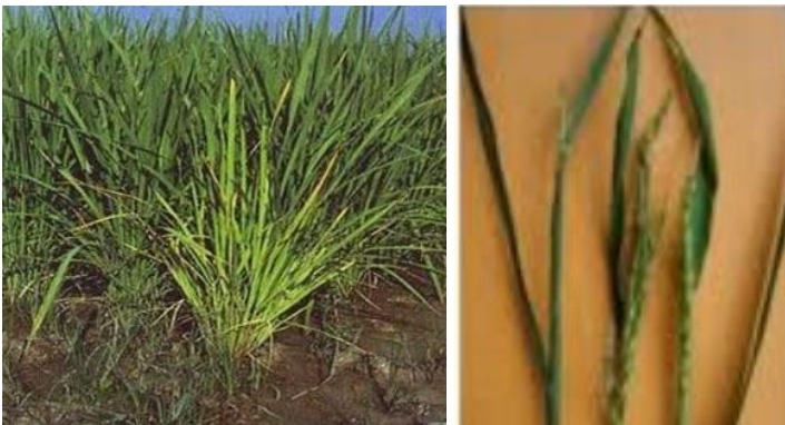
Gambar 26. Penampilan penyakit Kerdil Hampa tanaman padi gogo (artikel padi.com)

ditentukan oleh varietas padi dan umur tanaman pada saat terinfeksi. Pada umumnya semakin tua umur tanaman pada saat terinfeksi, semakin rendah persentase pertanaman yang rusak bahkan gejala penyakit tidak tampak sampai tanaman dipanen. Gejalanya baru akan tampak pada ratun sehabis panen. Penularan virus kerdil rumput terjadi secara persisten oleh wereng cokelat Nilaparvata lugens dan virus ini dapat memperbanyak diri di dalam tubuh vektor, tetapi tidak ditularkan melalui telur. Virus ini juga mempengaruhi umur dan reproduksi vektornya. Bila terjadi ledakan serangan wereng cokelat yang merupakan vektor dari kedua virus tersebut maka akan timbul endemi penyakit kerdil hampa dan kerdil rumput. Penyebaran penyakit kerdil hampa dan kerdil rumput di lapangan tergantung pada beberapa faktor, antara lain serangga vektor, sumber virus, varietas padi dan faktor lingkungan.