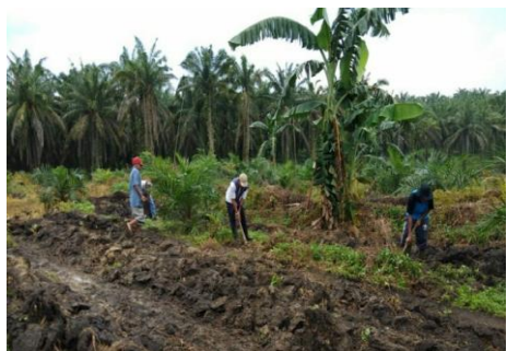
Gambar 6. Dokumentasi Pengolahan tanah dan Pembersihan Loron antara tanaman sawit