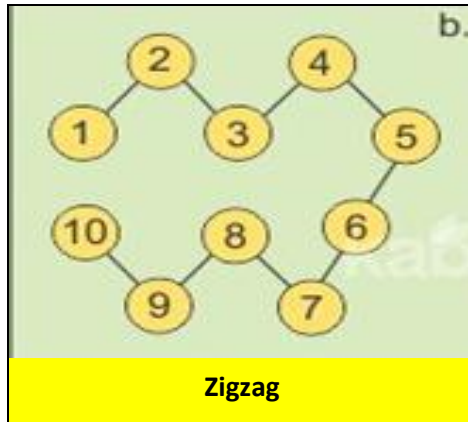
Gambar 2 . Pengambilan sampel tanah secara Zig-zag (Setyorini et al, 2016)