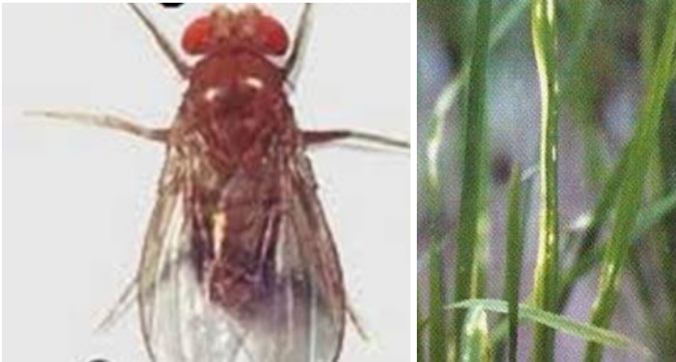
Gambar 14. Performan lalat bibit dan bentuk tanaman terserang (Balitabangtan, 2018)

terserang sundep. Anakan yang dapat bertahan daunnya cacat dan mudah sobek dan pada umumnya tanaman padi akan pulih kembali, namun demikian tanaman padi akan terlambat masak sekitar 7 – 10 hari pada gilirannya produksi rendah.