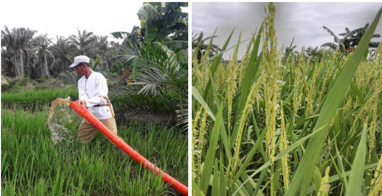
Gambar 28. Pengairan saat terjadi musim keamarau dan penampilan padi gogo saat muncul malai tanaman

Tingkat pemberian air (volume air) sangat berpengaruh terhadap pertumbuhan dan produksi padi gogo pada semua varietas. Pengairan dengan penyiraman selama 2 hari sekali menghasilkan pertumbuhan dan produksi yang baik, karena pada penyiraman 1 kali dalam 2 hari akan mencukupi pertumbuhan tanaman padi gogo dan mampu mengimbangi kehilangan air akibat dari transpirasi dan evaporasi.