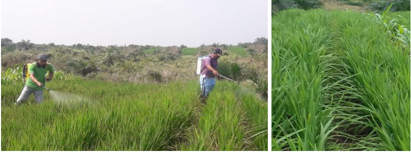
Gambar 27. Pengendalian hama penyakit dan penampilan padi gogo pasca penyemprotan.