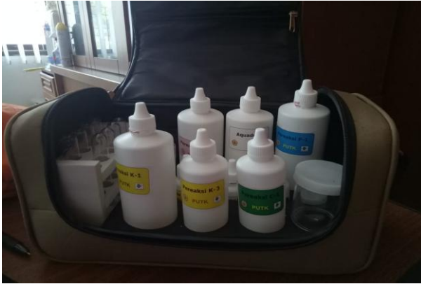
Gambar 5. Perangkat uji tanah sawah

P dan K selanjutnya digunakan sebagai dasar penentuan penetapan takaran pupuk P dan K untuk tanaman padi gogo, jagung dan kedelai, sedangkan penetapan C organik dan kapur untuk perbaikan kesuburan tanah.