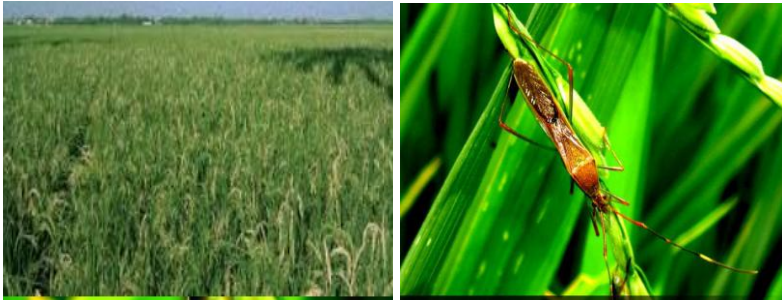
Gambar 16. Serangan hama walang sangit dan saat walang sangit menghisap gabah

Hama walang sangit ( Leptocoriza acuta ) menyerang buah padi yang masak susu dengan cara menghisap cairan di dalamnya.