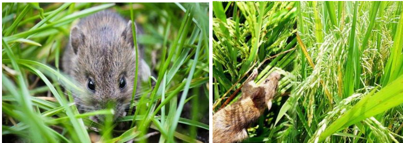
Gambar 13. Performan Tikus dan menyerang tanaman padi gogo (Balitabangtan, dan sumber lainnya 2018)

Hama tikus adalah hama yang paling parah dalam merusak tanaman padi gogo. Hama ini menyebabkan penurunan produksi padi yang cukup besar lebih dari 20 %, menyerang batang muda (umur 1-2 bulan) sampai dengan menyerang tanaman tua sampai siap panen. Gejala serangan hama tikus terlihat adanya tanaman padi yang roboh dan habis pada serangan hebat (Perdana, 2010).