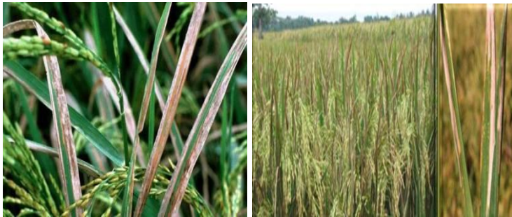
Gambar 19. Serangan penyakit Hawar Daun Bakteri

Penyakit Hawar Daun Bakteri (HDB) merupakan salah satu penyakit padi tersebar di berbagai ekosistem padi di negara-negara penghasil padi, termasuk di Indonesia. Penyakit ini disebabkan oleh bakteri Xanthomonas oryzae pv. oryzae (Xoo) Pathogen ini dapat menginfeksi tanaman padi pada semua fase pertumbuhan tanaman dari mulai muda sampai menjelang panen. Penyebab penyakit (pathogen) menginfeksi tanaman padi pada bagian daun melalui luka daun atau lobang alami berupa stomata dan merusak klorofil daun. Hal ini menyebabkan menurunnya kemampuan tanaman untuk melakukan fotosintesis.