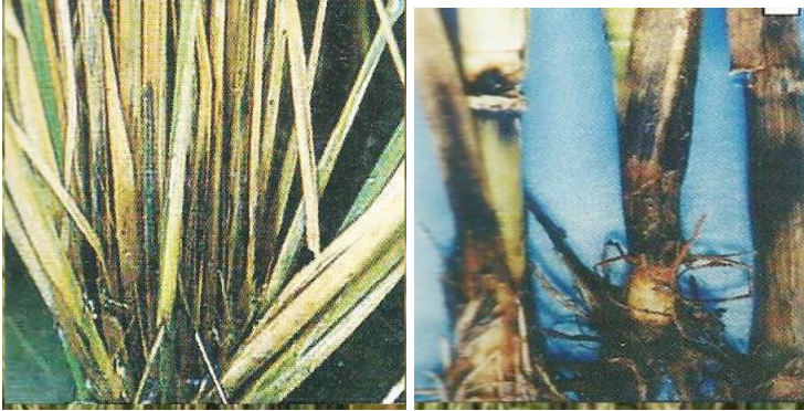
Gambar 20. Serangan penyakit Busuk batang (BPTP Sulawesi Selatan, 2015)

yang paling rentan adalah pada fase anakan sampai stadia matang susu. Kehilangan hasil akibat penyakit ini dapat mencapai 80%.