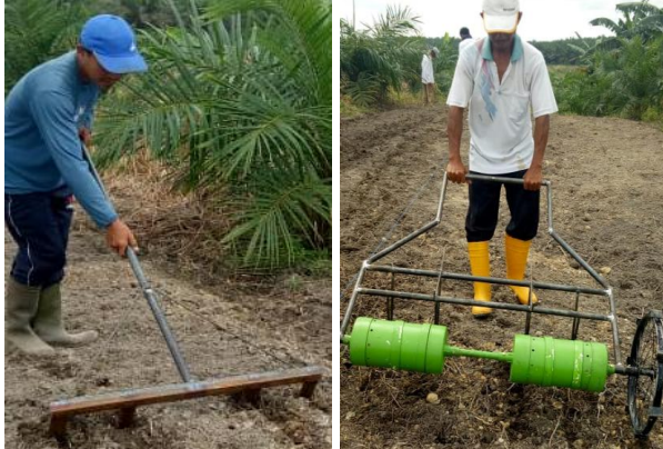
Gambar 8. Alat Tanam Largo Cara Petani (Kiri) Alat Tanam Largo (Kanan)

Ada 2 Jenis alat tanam yang digunakan di lokasi kegiatan yaitu (1) alat tanam cara petani, (2) alat tanam largo hasil inovasi teknologi BB Mektan yang telah dimodifikasi oleh BPTP Riau, sesuai dengan spesifik di antara tanaman sawit.