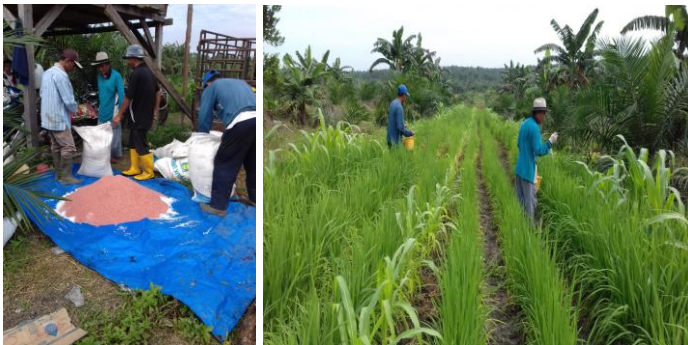
Gambar 10. Pencampuran pupuk urea dan KCl, saat pemupukan susulan pada tanaman Largo Super

Pemupukan berdasarkan hasil pengamatan analisis tanah dengan menggunakan PUTK. Hasil analisis tanah dengan menggunakan PUTK di dapat takaran pupuk yaitu urea sebanyak 250 kg/ha yang diberikan sebanyak 3 kali yaitu 1/3 diberikan awal tanam, 1/3 umur 28 hari setelah tanam (HST) dan 1/3 bagian lagi diberikan pada umur 42 HST. Pemupukan SP 36 sebanyak 200 kg/ha diberikan pada saat tanam atau bersamaan dengan penaburan pupuk kandang atau kompos. Sedangkan pupuk KCl sebanyak 250 kg/ha diberikan 2 kali yaitu pada saat tanam dan umur 28 HST.