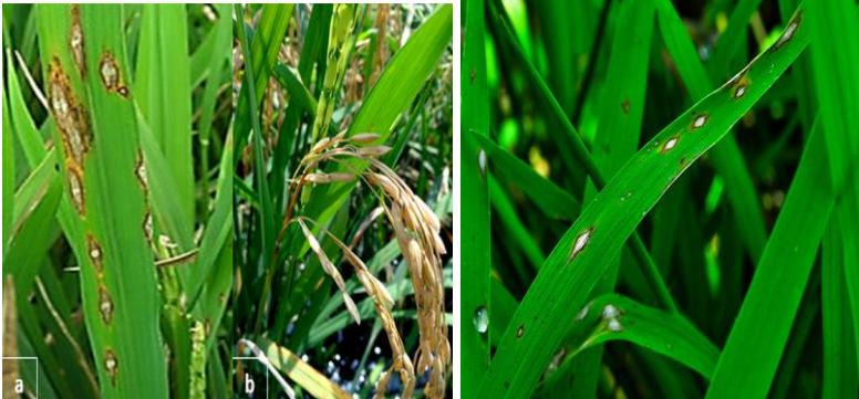
Gambar 23. Penampilan penyakit Blas padi gogo (Sumber : BB Padi (kiri))

Pengendalian penyakit blas adalah dengan menggunakan varietas tahan sesuai dengan sebaran ras yang ada di daerah setempat, menggunakan benih sehat, hindari penggunaan pupuk nitrogen diatas dosis anjuran, hindari tanam padi dengan varietas yang sama terus menerus sepanjang tahun, jarak tanam teratur dengan jarwo, gunakan pupuk kompos. Selain itu juga dilakukan sanitasi lingkungan secara intensif karena inang alternatif patogen dapat berupa rerumputan dan tanam serentak. Alternatif terakhir yaitu dengan cara perlakuan benih sangat dianjurkan untuk menyelamatkan persemaian sampai umur 30 hari setelah sebar dan semprot dengan fungisida sistemik sebaiknya 2 kali pada saat stadia tanaman anakan maksimum dan awal berbunga untuk mencegah penyakit blas daun dan blas leher terutama di daerah endemik.