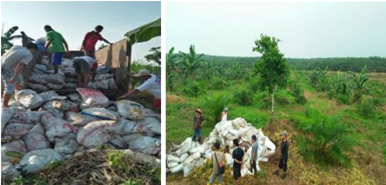
Gambar 7. Pengedropan pupuk kandang ayam dan kandang Sapi

Lahan bergambut yang memiliki pH dan kesuburan yang rendah. Pemberian pupuk organik dan pengapuran perlu dilakukan agar tanaman dapat tumbuh dengan baik. Takaran pupuk kandang sebanyak 5 ton/ha dan kapur 2 t/ha diberikan saat sebelum pengolahan tanah II. Untuk meningkatkan kandungan hara pupuk kandang perlu dilakukan fermentasi dengan menggunakan M-Dec sebagai bahan dekomposer. Penggunaan dekomposer M-Dec pada tanah gambut dapat mempercepat pelapukan bahan organik, sehingga dapat meningkatkan ketersediaan N, P, dan K pada tanah. Demikian juga penggunaan pupuk hayati mampu menciptakan kondisi kesuburan tanah menjadi lebih baik terutama meningkatkan ketersediaan hara baik dari yang ditambahkan melalui pupuk atau dari hara yang sudah tersedia di dalam tanah, seperti P-organik. Pupuk hayati dapat mengurai P-organik di dalam tanah menjadi tersedia bagi tanaman. Sebagaimana telah diketahui bahwa hara fosfor, dan kalium merupakan 12 unsur pembatas utama untuk produktivitas padi sawah (Arafah dan Sirappa, 2003).