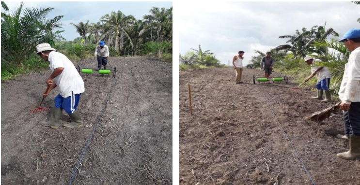
Gambar 9. Penanaman secara larikan dengan alat tanam Largo

Ada 2 Jenis alat tanam yang digunakan di lokasi kegiatan yaitu (1) alat tanam cara petani, (2) alat tanam largo hasil inovasi teknologi BB Mektan yang telah dimodifikasi oleh BPTP Riau, sesuai dengan spesifik di antara tanaman sawit.