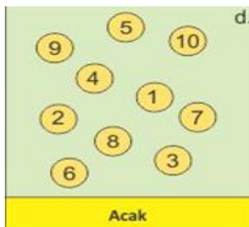
Gambar 4 . Pengambilan sampel tanah secara kelompok (Setyorini et al, 2016)

Pengambilan sampel tanah secara acak dilaksanakan dengan menentukan titik-titik pengambilan sampel tanah secara acak, tetapi menyebar rata di seluruh bidang tanah yang diwakili. Setiap titik yang diambil mewakili daerah sekitarnya (Gambar 4). Pengambilan sampel tanah secara acak ini tidak ada batasan dalam menentukan jumlah contoh tanah yang dipilih. Semua titik pengambilan contoh memiliki peluang yang sama dan saling bebas satu sama lainnya. Pengambilan contoh tanah dengan metode acak sederhana/simple random sampling (SRS) lebih sederhana, mudah dan cepat serta data yang diperoleh akan dapat mencerminkan keadaan tanah yang sebenarnya, jika contoh tanah diambil pada lahan bertopografi datar dengan jenis tanah sama, yang diperkirakan sifat-sifat fisik tanahnya homogen atau perbedaannya tidak nyata (Suganda et al, 2012