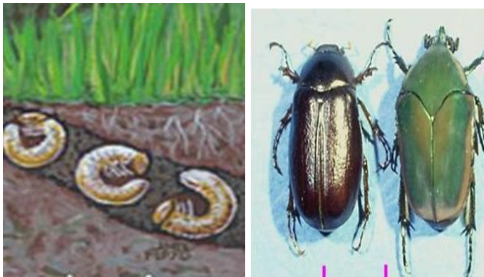
Gambar 15. Ciri khas Tubuh Uret dan uret dewasa

kedua jenis kumbang akan berkopulasi pada pertengahan bulan Juli. Penerbangan kumbang dan masa kawin terjadi selama dua bulan, kemudian kumbang masuk ke dalam tanah untuk bertelur. Telur akan menetas menjadi larva instar 1 antara 7–10 hari. Larva instar 1 akan makan akar rumput selama 2 minggu, kemudian ganti kulit dan menjadi larva instar 2. Dalam 3 minggu larva instar 2 akan makan akar tanaman, ganti kulit dan menjadi larva instar 3. Larva instar 3 mulai muncul antara bulan Oktober–November dan terus makan sampai menjadi pupa pada pertengahan bulan Juni tahun berikutnya.