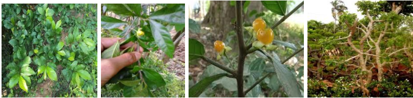
Gambar 18. Pohon serut mulai dari masa vegetative sampai Generatif (Mangyono. Com)

Pohon serut ( Streblus asper . Lour) famili Moraceae (nangka-nangkaan) juga bias dipakai untuk mengusir burung. Cara pemakaiannya adalah siapkan buah serut sebanyak 3 kg lalu cuci bersih, tumbuk halus dan tambahkan air sebanyak 10 liter, rendam selama 24 jam, saring rendaman dengan kain kasa, ekstrak dicampur dengan kapur sirih secukupnya, setiap 25 ml dicampur dengan air sebanyak 400 liter kemudian semprotkan.