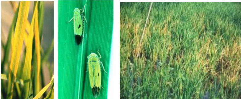
Gambar 25. Penampilan penyakit Tungro dan wereng hijau penular penyakit Tungro

pemupukan. Daun tanaman kadang-kadang bisa saja terlihat menghijau kembali bagaikan telah sembuh, namun daun tersebut dapat menguning lagi atau tidak lagi menghasilkan malai secara optimal. Aplikasi pestisida/racun juga tidak memperbaiki kerusakan tanaman. Gejala lebih lanjut seperti pertumbuhan anakan berikut yang semakin kerdil dibandingkan anakan yang tumbuh sebelumnya. Dengan demikian jumlah anakan produktif pun bisa berkurang. Jumlah malai per rumpun pasti semakin sedikit dan ukuran malainya semakin pendek.