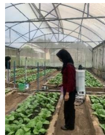
Pengendalian Hama dan Penyakit