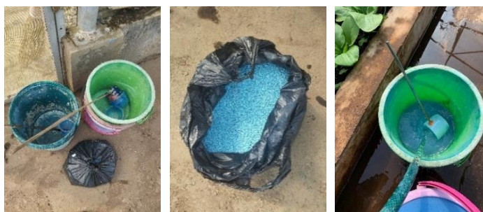
Gambar 16. Alat dan Bahan

Pada gambar 16 merupakan alat dan bahan yang digunakan pada kegiatan pelarutan pupuk yaitu seperti ember, gayung, pupuk majemuk NPK (16:16:16), dan air bersih.