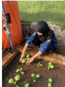
Gambar 11. Penyulaman

Kegiatan penyulaman pada budidaya pakcoy di screen house 5 merupakan langkah penting untuk menjaga keberhasilan tanam dan hasil panen yang optimal. Penyulaman dilakukan dengan cara mengganti bibit yang rusak, mati, atau tidak tumbuh dengan baik dengan bibit baru yang sehat dan seragam agar populasi tanaman tetap ideal dan pertumbuhan optimal tercapai. Proses penyulaman dilakukan setelah masa tanam awal ketika terlihat bibit yang tidak tumbuh atau tanaman mengalami kegagalan tumbuh. Jarak tanam untuk menyulam juga disesuaikan dengan jarak tanam awal, yaitu 20 x 20 cm agar tidak terjadi kepadatan atau jarak berlebih yang mempengaruhi sirkulasi udara dan kesehatan tanaman. Kegiatan penyulaman dapat dilihat pada gambar 11.