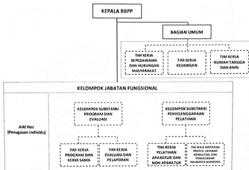
Gambar 1. Struktur Organisasi BBPP Lembang

Struktur organisasi BBPP Lembang berdasarkan Permentan Nomor 14 Tahun 2023 yaitu: