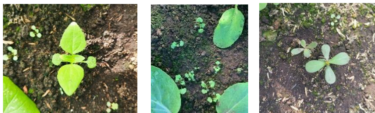
Gambar 13. Gulma Bandotan, Gulma Asam Kecil, dan Gulma Krokot

Adapun jenis gulma yang banyak ditemukan pada screen house 5 adalah gulma bandotan ( Ageratum conyzoides ), gulma asam kecil ( Oxalis corniculata L.), dan gulma krokot ( Portulaca oleracea ). Pada gambar 13 merupakan gulma yang ditemukan di bedengan.