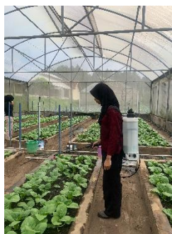
Gambar 18. Penyemprotan Insektisida dan Fungisida

Dalam praktik kerja lapangan yang dilakukan di screen house 5 BBPP Lembang pengendalian hama penyakit dilakukan dengan menggunakan dosis campuran insektisida berbahan aktif emamektin benzoat 5,7% sebanyak 3 gram, abamektin 18/1 sebanyak 2 ml, fungisida berbahan aktif karbendazim 12% + mankozeb 63% WP sebanyak 5 gram, dan fungisida + ZPT sebanyak 2 ml dalam 10 liter air bersih. Penyemprotan insektisida dan fungisida pada budidaya pakcoy dilakukan setiap seminggu sekali pada pagi atau sore hari dengan menggunakan hand sprayer . Pada pagi hari sebelum jam 10, dan sore hari setelah jam 3. Kegiatan pengendalian hama penyakit dengan penyemprotan insektisida dan fungisida dapat dilihat pada gambar 18.