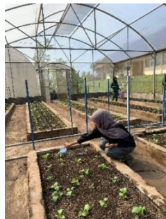
Gambar 17. Pemupukan

Pemupukan dilakukan sebanyak dua kali yaitu, pemupukan pertama dilakukan pada 7 HST dan pemupukan ke-2 pada umur 14 HST. Dapat dilihat pada gambar 17 merupakan proses kegiatan pemupukan.