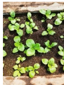
Gambar 10. Kondisi Tanaman

Gambar 10 menunjukkan bahwa tanaman yang disiram secara konsisten menunjukkan daun yang lebih segar, dan tidak menunjukkan gejala stres air seperti layu atau klorosis daun dan media tanam tetap dalam kondisi lembab namun tidak tergenang.