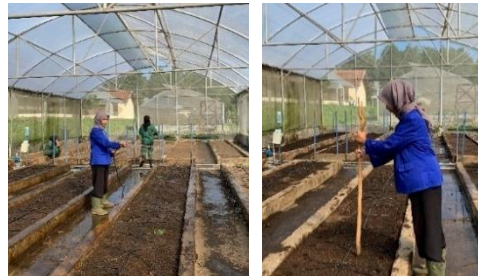
Gambar 7. Penyiraman dan Pembuatan Lubang Tanam

Penanaman pakcoy setelah persemaian dilakukan selama 14 HST atau ketika bibit sudah memiliki 3-4 helai daun sejati. Penggunaan bibit sehat sangat penting karena akan memengaruhi tingkat keberhasilan pertumbuhan di lapangan karena bibit yang terlalu muda rentan terhadap stres. Kegiatan penanaman di screen house 5 BBPP Lembang dilakukan setelah media tanam dipersiapkan dan bibit telah berumur sekitar 14 hari setelah semai (HSS). Bibit pakcoy yang telah memiliki 3-4 helai daun sejati dipindahkan dari tray semai ke bedengan. Jumlah populasi tanaman pakcoy yang dibudidayakan pada screen house 5 BBPP Lembang sebanyak 1.500 tanaman. Pada gambar 8 di bawah ini merupakan kegiatan penanaman pakcoy pada screen house 5.