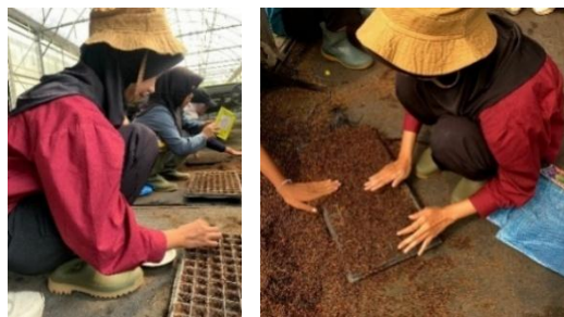
Gambar 6. Persemaian

Persemaian dilakukan dengan menyiapkan tray semai dan isi dengan media tanam dari campuran cocopeat dan arang sekam dengan perbandingan 1:1. Benih pakcoy disebar secara merata ke dalam tray semai dengan cara satu lubang dua benih pakcoy, kemudian tutup kembali dengan campuran cocopeat dan arang sekam. Setelah benih disebar merata, tray ditutup dengan menggunakan kain/penutup berwarna hitam selama 3 hari, ini berguna untuk mempercepat proses perkecambahan pakcoy. Penyemaian benih dilakukan selama kurang lebih selama 14 hari. Gambar 6 merupakan proses persemaian pakcoy untuk budidaya pada screen house 5 BBPP Lembang.