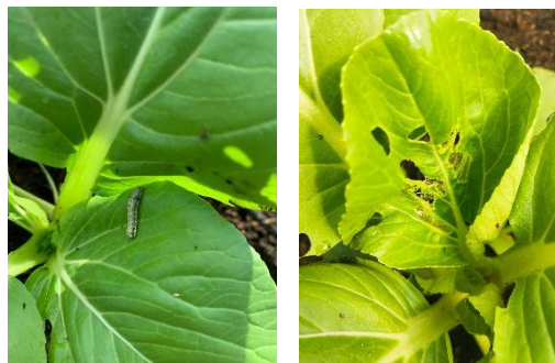
Gambar 19. Hama Ulat Daun ( Plutella xylostella ) dan Gejala yang Diberikan

pakcoy di screen house 5 BBPP Lembang menjadi salah satu hama yang paling banyak ditemukan. Populasinya yang banyak mampu merusak tanaman pakcoy dengan memakan bagian-bagian daun pakcoy yang membuat daun menjadi berlubang hingga rusak. Dapat dilihat pada gambar 19 merupakan gambar hama ulat daun dan gejala yang diberikan.