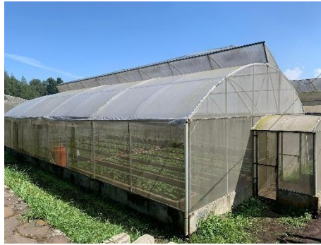
Gambar 3. Screen House 5 BBPP Lembang

Screen house 5 di BBPP Lembang merupakan salah satu sarana penting dalam mendukung budidaya hortikultura modern, khususnya untuk sayuran daun seperti pakcoy secara intensif. Dapat dilihat pada gambar 3 di bawah, ini merupakan screen house 5 di BBPP Lembang.