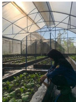
Gambar 14. Pembumbunan

Tujuan utama dari pembumbunan ini adalah untuk menguatkan posisi tanaman, memperbaiki struktur tanah di sekitar akar, dan merangsang pertumbuhan akar lateral. Pada gambar 14 merupakan kegiatan pembumbunan pada budidaya pakcoy di screen house .