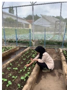
Gambar 12. Penyiangan

Adapun jenis gulma yang banyak ditemukan pada screen house 5 adalah gulma bandotan ( Ageratum conyzoides ), gulma asam kecil ( Oxalis corniculata L.), dan gulma krokot ( Portulaca oleracea ). Pada gambar 13 merupakan gulma yang ditemukan di bedengan.