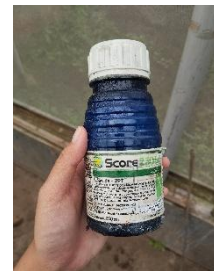
Fungisida + ZPT