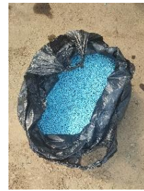
Pupuk NPK majemuk (16:16:16)