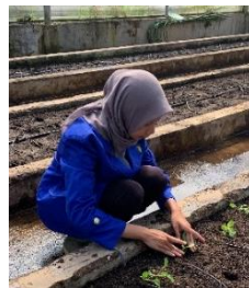
Gambar 8. Penanaman

Penanaman pakcoy setelah persemaian dilakukan selama 14 HST atau ketika bibit sudah memiliki 3-4 helai daun sejati. Penggunaan bibit sehat sangat penting karena akan memengaruhi tingkat keberhasilan pertumbuhan di lapangan karena bibit yang terlalu muda rentan terhadap stres. Kegiatan penanaman di screen house 5 BBPP Lembang dilakukan setelah media tanam dipersiapkan dan bibit telah berumur sekitar 14 hari setelah semai (HSS). Bibit pakcoy yang telah memiliki 3-4 helai daun sejati dipindahkan dari tray semai ke bedengan. Jumlah populasi tanaman pakcoy yang dibudidayakan pada screen house 5 BBPP Lembang sebanyak 1.500 tanaman. Pada gambar 8 di bawah ini merupakan kegiatan penanaman pakcoy pada screen house 5.