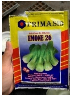
Gambar 5. Benih Pakcoy

Persemaian dilakukan dengan menyiapkan tray semai dan isi dengan media tanam dari campuran cocopeat dan arang sekam dengan perbandingan 1:1. Benih pakcoy disebar secara merata ke dalam tray semai dengan cara satu lubang dua benih pakcoy, kemudian tutup kembali dengan campuran cocopeat dan arang sekam. Setelah benih disebar merata, tray ditutup dengan menggunakan kain/penutup berwarna hitam selama 3 hari, ini berguna untuk mempercepat proses perkecambahan pakcoy. Penyemaian benih dilakukan selama kurang lebih selama 14 hari. Gambar 6 merupakan proses persemaian pakcoy untuk budidaya pada screen house 5 BBPP Lembang.