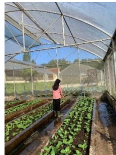
Gambar 9. Penyiraman

Selama pelaksanaan praktik kerja lapangan di screen house 5, kegiatan penyiraman dilakukan secara teratur menggunakan sistem manual, yaitu dengan cara menyiramkan air melalui selang. Tanaman disiram sebanyak 2 kali sehari (pagi dan sore) setiap pukul 08.00 WIB dan 15.00 WIB selama fase pertumbuhan vegetatif, dan dikurangi menjadi 1 kali tergantung pada kondisi kelembaban media tanam. Dapat dilihat pada gambar 9 merupakan proses kegiatan penyiraman pakcoy pada screen house 5.