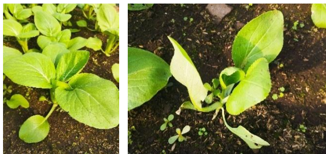
Gambar 15. Perlakuan Pembumbunan dan Tidak Diperlakukan Pembumbunan

Tanaman yang mendapatkan perlakuan pembumbunan akan terlihat lebih tegak dan kokoh dibandingkan dengan tanaman yang tidak dibumbun, terutama saat mendekati fase akhir vegetatif. Dapat dilihat pada gambar 15 merupakan gambar perbedaan antara pakcoy yang mendapat perlakuan pembumbunan dan pakcoy yang tidak mendapat perlakuan pembumbunan.