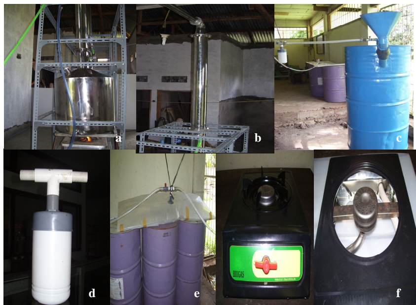
Gambar 1. a) Tungku dan tangki masak, b) dehidrator, c) degister, d) katup pengaman, e) penampung gas dan f) kompor biogas

Etanol atau etil alkohol adalah zat kimia organik berwarna jernih, berbau khas alkohol, mudah terbakar dan dapat dibuat dari biomassa maupun fraksi minyak bumi. Etanol yang dibuat dari bahan nabati dikenal dengan sebutan bioetanol. Pada pengolahan pati sagu menjadi etanol, terlebih dahulu pati diubah