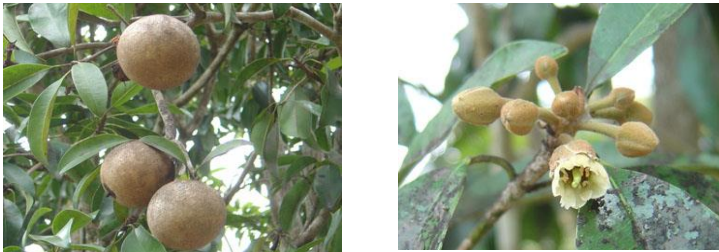
Gambar 2. Sawo budidaya ( Manilkara zapota )