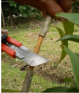
a.pengupasan kulit batang

Urutan pelaksanaan pencangkakan sawo dapat dilihat pada Gambar 4.