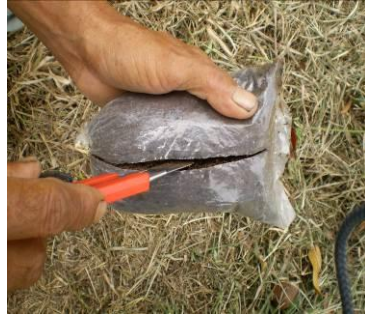
b.pengupasan kantong plastik berisi media