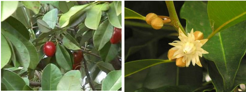
Gambar 1. Sawo kecil ( Manilkara kauki )

ukiran. Sawo Kecil biasanya digunakan sebagai batang bawah Sawo ( Manilkara zapota ). Kerabat sawo lainnya adalah sawo Durian ( Chrysophyllum cainito ). Tanaman ini dinamakan sawo Durian karena aromanya mirip aroma durian. Sawo Durian biasanya tumbuh di daerah dengan curah hujan tinggi. Sawo Durian dikelompokkan ke dalam 2 jenis yaitu sawo Durian Merah dan sawo Durian Hijau.