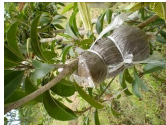
d. pencangkakan telah selesai