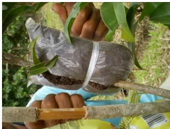
c. cabang yang sudah dikupas kulitnya dimasukkan ke dalam kantong media