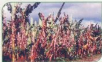
Gambar : Tanaman pisang terserang penyakit layu yang akan di eradikasi