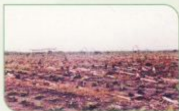
Gambar : Lahan pisang setelah di eradikasi

Untuk lahan bekas tanaman pisang yang terserang layu fusarium, setelah eradikasi disarankan untuk tidak menanam pisang yang rentan terhadap ras yang ditemukan pada lokasi tersebut. Sedangkan untuk lahan bekas serangan layu bakteri, setelah eradikasi, lahan dapat ditanami kembali dengan pisang setelah digilir dengan tanaman lain, terutama dengan tanaman gandum, jagung dan padi selama 2 tahun.