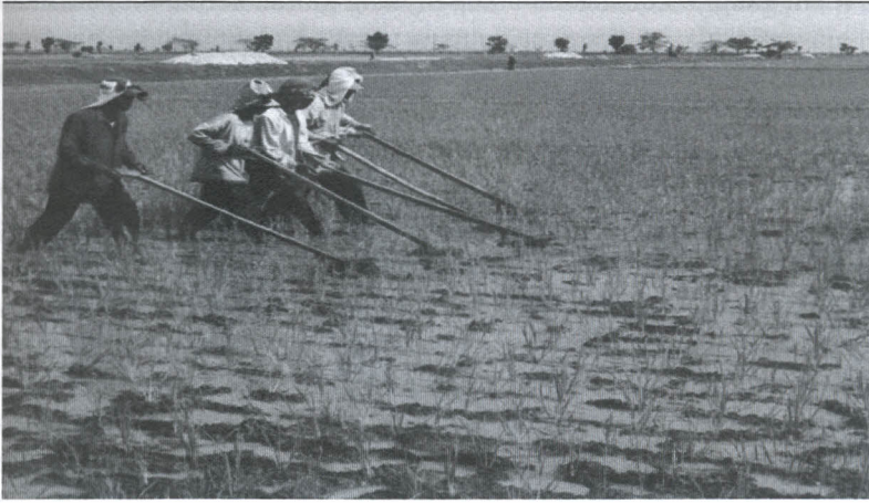
Gambar 20. Pengendalian gulma cara mekanis menggunakan alat penyiang gulma gasrok di lahan sawah