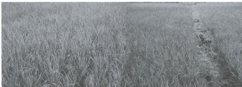
Gambar 21. Penggenangan pertanaman padi salah satu cara kultur teknis untuk mengendalikan gulma di sawah pasang surut

Gambar di atas menjelaskan bahwa lahan yang tergenang bebas dari gulma, sedangkan pada galangan/lahan yang tidak tergenang ditumbuhi oleh gulma. Pengendalian gulma dengan cara kultur teknis melalui penggenangan sangat baik, namun penerapannya memerlukan dukungan sistem pengelolaan air yang baik. Pengalaman di lapangan, perbedaan musim tanam padi yakni musim hujan dan musim kemarau memengaruhi pertumbuhan gulma. Pertanaman di musim hujan karena kondisi sawah selalu tergenang pertumbuhan gulma lebih terkendali, sedangkan pertanaman padi di musim kemarau karena kondisi lahannya berair sampai macak-macam mendorong pertumbuhan gulma lebih subur (Simatupang et al. , 1999a). Artinya, dengan cara melakukan pengelolaan air di sawah secara baik dapat menekan pertumbuhan gulma. Persoalan yang dapat muncul di lahan rawa pasang surut, tata air di kawasan ini pada umumnya masih belum tertata dengan baik