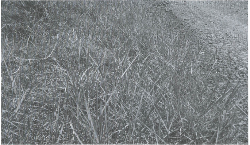
Gambar 18. Visualisasi pertumbuhan gulma yang merusak bagian pinggir jalan disebabkan penetrasi akar-akarnya

tumbuh tanpa pengendalian, maka gulma akan tumbuh lebih subur dari pada tanaman budi daya sehingga hasil tanaman padi menjadi rendah. Hasil penelitian dilaporkan penurunan hasil padi akibat persaingan gulma dapat mencapai 50% bahkan lebih besar pada kondisi tertentu (Simatupang, 2007a).