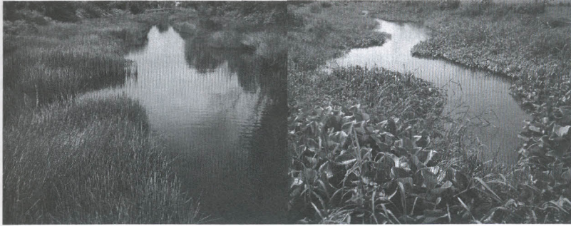
Gambar 17. Keadaan saluran sekunder yang terganggu akibat kehadiran gulma yang menutupi sebagian besar saluran

Selain gulma menjadi masalah pada saluran-saluran air, kehadiran gulma ditepi-tepi jalan dapat mengganggu/merusak jalan disebabkan penetrasi dan perkembangan akar-akarnya menembus ke badan jalan seperti pada gambar berikut (Gambar 18). Akibat pertumbuhan gulma ini, banyak jalan-jalan di desa menjadi rusak dan diperlukan biaya yang cukup besar untuk perbaikan dan biaya pemeliharaan jalan secara rutin.