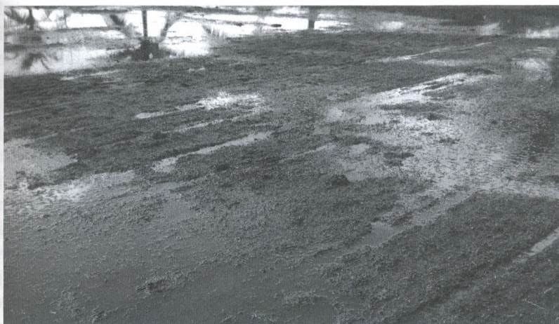
Gambar 16. Perkecambahan/pertumbuhan biji gulma seminggu setelah penyiapan lahan di sawah pasang surut (Koleksi Pribadi: Simatupang, 2014)

Sebaliknya bilamana keadaan lahan sawah kering biasanya seperti yang dijelaskan sebelumnya tanah-tanah pasang surut menjadi keras bahkan dapat pecah-pecah ( cracking ). Keadaan seperti ini kurang menguntungkan bagi gulma sehingga pertumbuhannya menjadi tertekan. Lahan sawah yang tergenang dengan kedalaman 5–10 cm merupakan kondisi yang kurang menguntungkan bagi beberapa jenis gulma karena dapat menekan pertumbuhan gulma. Meskipun demikian, ada beberapa jenis gulma yang masih dapat bertahan dan dapat tumbuh walaupun pertumbuhannya kurang subur atau tidak maksimal, dan ada juga akhirnya mati karena tidak tahan dengan genangan (Simatupang et al. , 1996b).