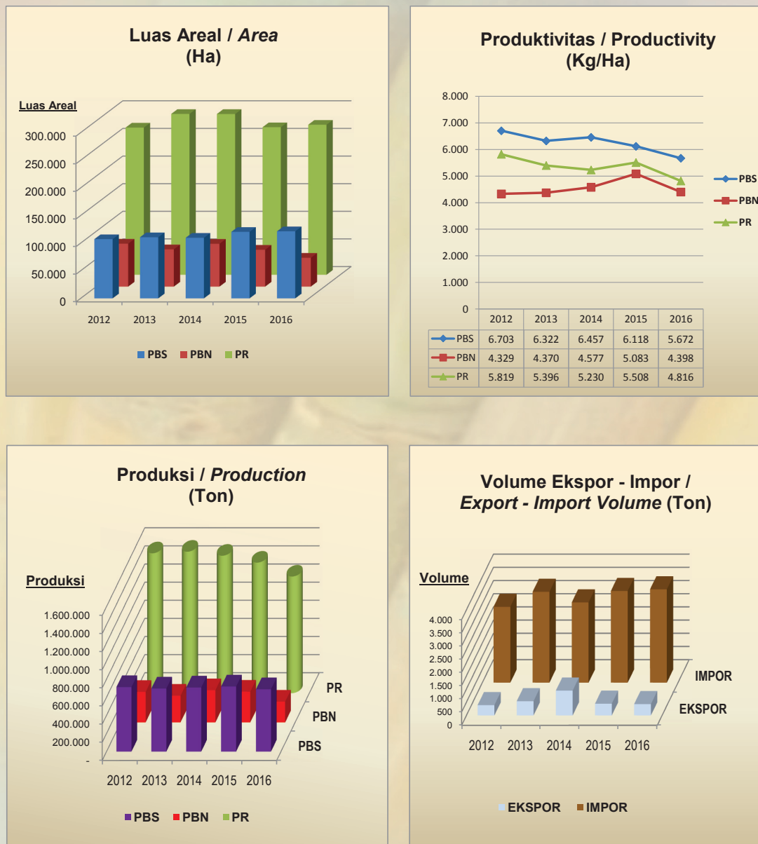
Figure Area, Production, Productivity and Export-Import Volume Trend Graph of Sugar Cane, 2012 - 2016