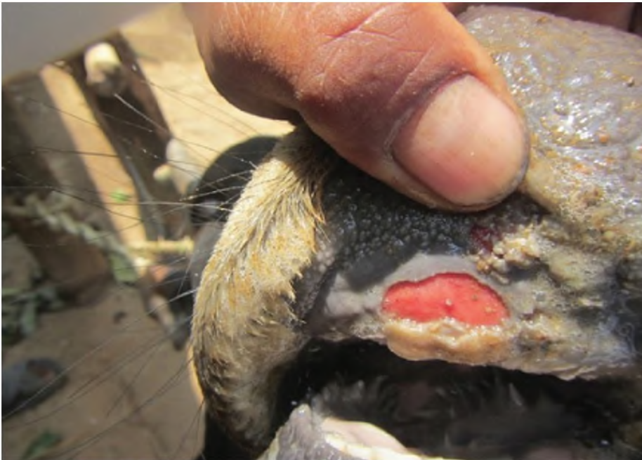
Lesi/luka pada gusi (sapi)