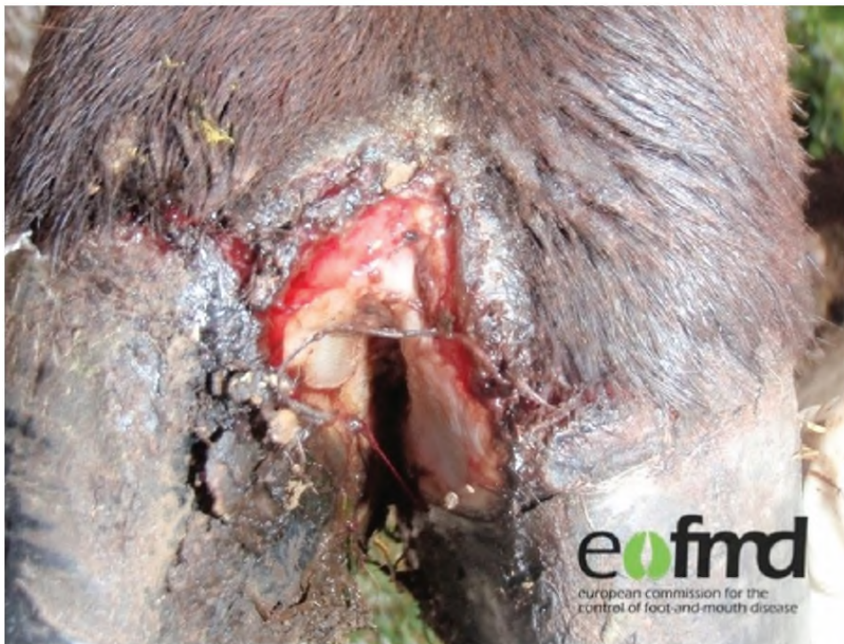
Lesi pada kuku