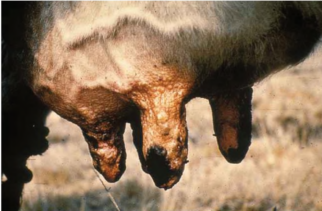
Lesi pada ambing