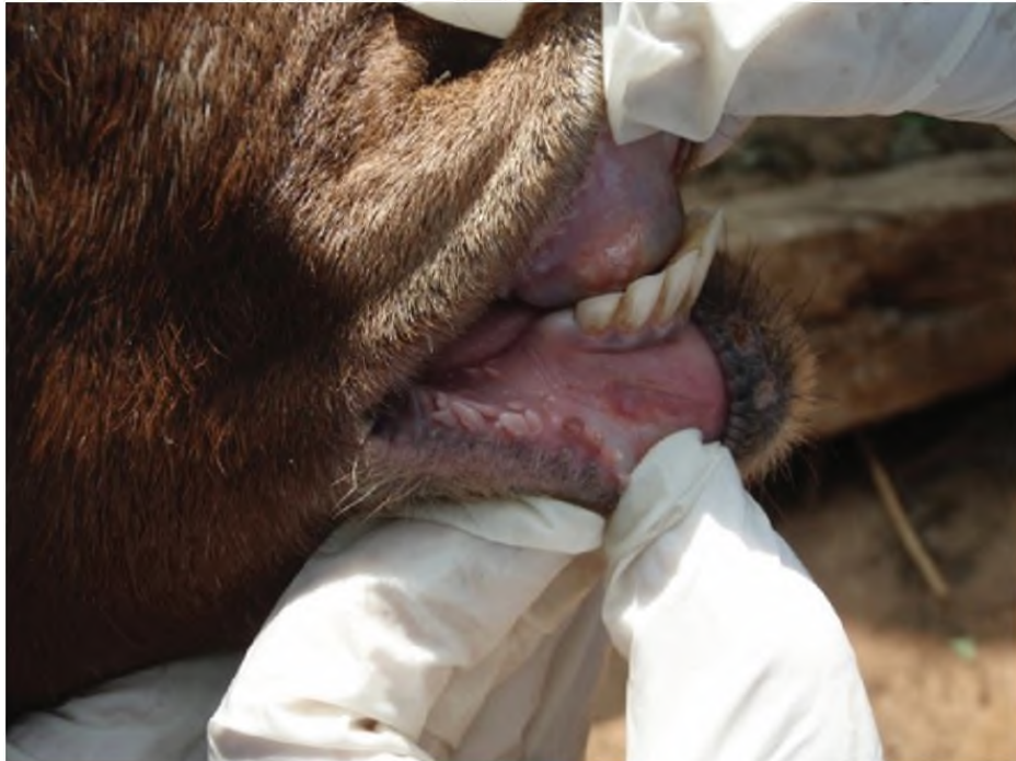
Lesi/luka pada gusi (kambing)