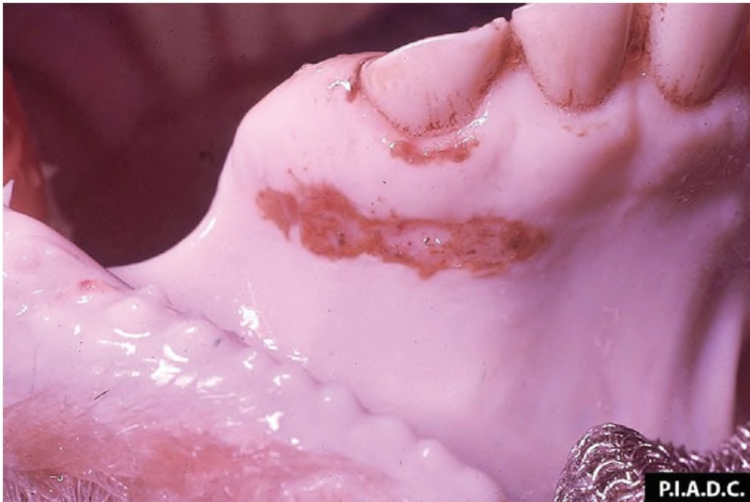
Vesikula pada gusi