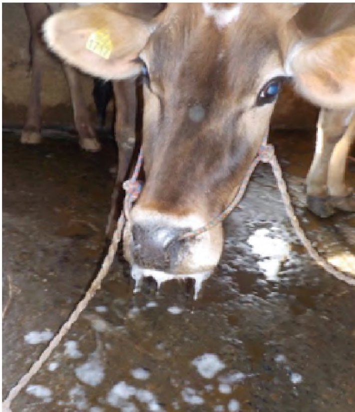
Mulut berbusa dengan liur berlebih