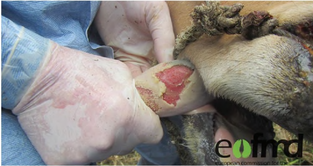
Lesi pada lidah