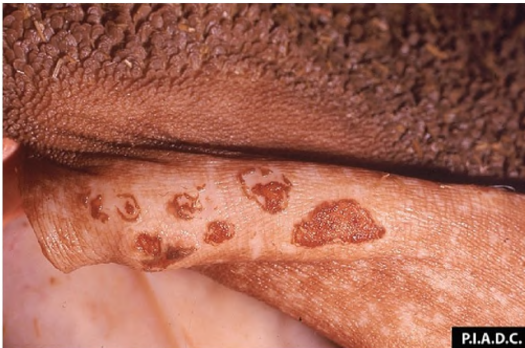
Vesikula pada pillar rumen