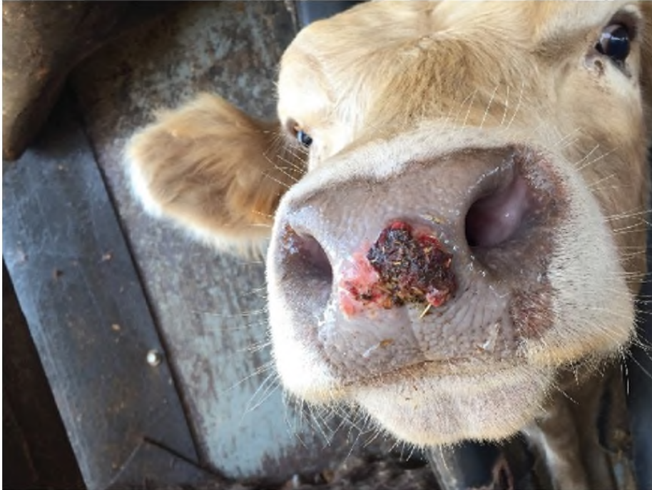
Erosi pada hidung