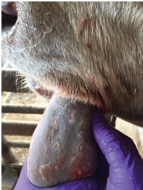
Erosi pada lidah