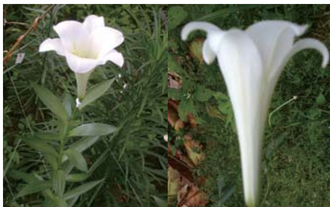
Gambar 6. keragaan bunga kerk lili dengan bentuk terompet seperti bunga-bunga pada varietas Candilongi ( Performance of lilium flower with trumpet shape flower on Candilongi variety )