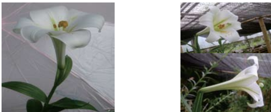
Gambar 3. Keragaan bunga kerk lili dengan bentuk lonceng seperti bunga-bunga pada individu 1 (kiri) ( Performance of lilium flower with bell shape flower on individual 1 (left) ), individu 2 (kanan atas) ( individual 2 (up right) ), dan individu 3 (kanan bawah) ( and individual 3 (down right) ).