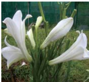
Gambar 1. Keragaan bunga aksesi LC-33 yang digunakan sebagai tetua betina ( Performance of LC-33 accession used as mother plant )