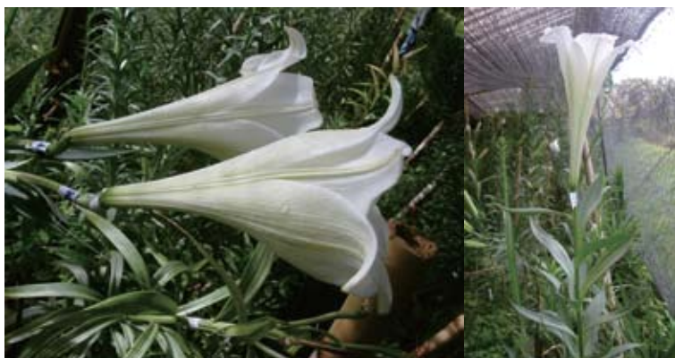
Gambar 4. Keragaan bunga kerk lili dengan bentuk corong seperti pada bunga-bunga individu 4 (kiri) ( Performance of lilium flower with funnel shape flower on individual 4 (left) ) dan individu 5 (kanan) ( and individual 5 (right) )

sedangkan tepala bunga keempat klon lainnya agak bergelombang dengan kategori lemah.