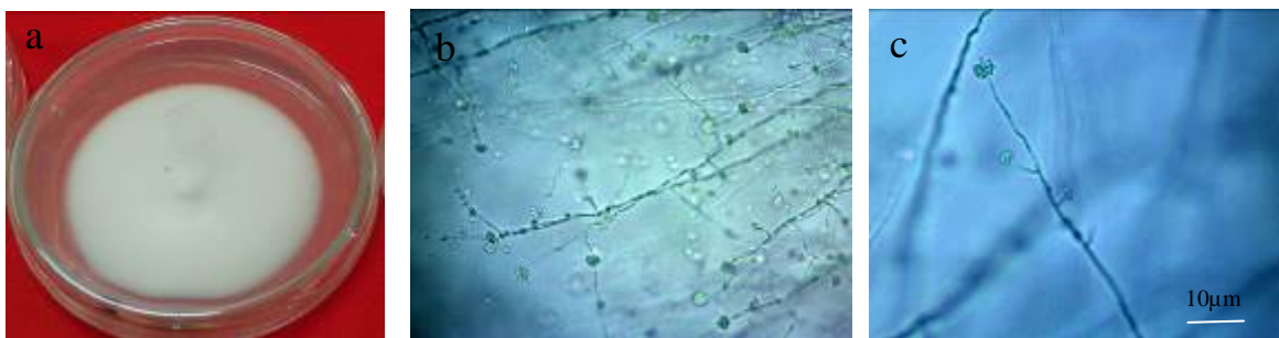
Gambar 1. Koloni (a) dan mikroskopis (b,c) cendawan L. lecanii (40X) pada media PDA

Karakteristik L. lecanii adalah koloni cendawan berwarna putih pucat dengan diameter 4,0-7,3 cm setelah 20 hari inokulasi pada media PDA ( Potato dextrose agar ) (Prayogo, 2009). Menurut Shinde et al. (2010), koloni cendawan L. lecanii berwarna putih (Gambar 1a), berukuran 3,3 x 2,8 cm, tumbuh pada suhu 23 °C. Konidiofor berbentuk seperti fialid ( whorls ) seperti huruf V, setiap konidiofor memproduksi 5-10 konidia yang terbungkus dalam kantong lendir (Aiuchi et al. , 2007). Bentuk konidia berupa silinder hingga elips, terdiri dari satu sel, tidak berwarna (hialin), berukuran 1,9-2,2 x 5,0-6,1 µm (Feng et al. , 2002). Hifa tidak berwarna (hialin) dengan diameter 2,8 µm (Gambar 1b).