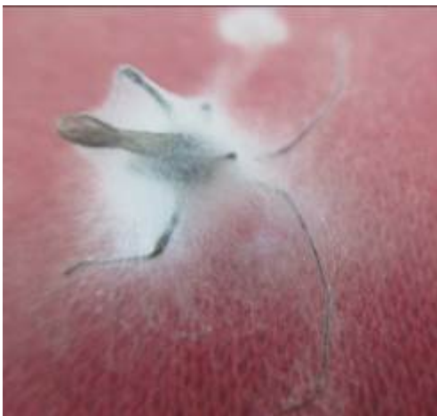
Gambar 2. Helopeltis antonii yang terinfeksi cendawa entomopatogen L. lecanii .

(Atmadja, 2003). Selain menyerang tanaman kakao H. antonii juga menyerang tanaman teh. Berdasarkan hasil pengamatan di lapang, daun muda (pucuk) teh yang terserang H. antonii akan terlihat bekas tusukan (bercak-bercak) coklat, bekas tusukan kelihatan menyatu makin lebar agak kering lama-kelamaan kering dan mati. Serangga imago betina menusuk dan menghisap cairan daun teh, di samping itu serangga tersebut meletakkan teluranya di bawah pucuk daun teh. Telur H. antonii yang diletakkan di bawah pucuk daun teh setelah 6-7 hari akan menetas menjadi nimfa instar 1 dan