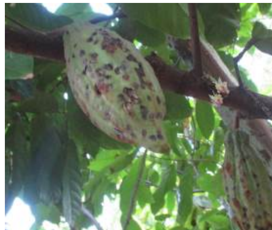
Gambar 3. Gejala serangan Helopeltis spp. pada buah kakao.

Serangga yang terinfeksi cendawan L. lecanii saat disentuh dengan kuas tidak bergerak lagi, ditumbuhi miselium berwarna putih pucat dengan tekstur halus yang menyelimuti permukaan tubuh serangga (Gambar 2). Hasil pengamatan serangga yang mati dalam beberapa hari tubuhnya mengeras dan kaku karena cairan tubuhnya telah habis digunakan untuk perkembangan cendawan di dalam tubuh serangga.