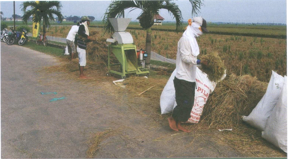
Gambar 3. Pengembalian jerami ke petakan sawah setelah panen

Agar potensi genetik tanaman muncul secara maksimum, dianjurkan untuk menanam satu bibit per lubang tanam. Penanaman bibit muda akan memberikan pertumbuhan dan perkembangan akar yang lebih baik, sehingga anakan yang terbentuk lebih banyak dan kemampuan adaptasi lingkungan yang lebih tinggi dibandingkan dengan penanaman bibit yang tua.