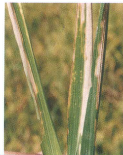
Hawar Daun Bakteri