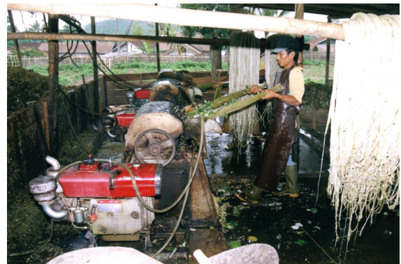
Gambar 2. Mesin dekortikator yang dioperasikan di Wonosobo

dibersihkan karena terdorong pada ruangan yang makin sempit. Selain itu keterampilan bagi operator sangat diperlukan, karena dapat terjadi kecelakaan akibat kelalaian operator, karena terlilit serat rami, dan terseret ke dalam bagian pemukul, sehingga tangan dapat luka bahkan bisa putus jemarnya. Sedikit kelalaian operator akan berakibat buruk terhadap serat yang dihasilkan, bahkan juga keselamatan dirinya. Selain itu pada proses penarikan adakalanya serat ikut terbang. Dalam keadaan kering serat ini kaku karena masih banyak mengandung gum , yang harus dihilangkan apabila serat rami akan dijadikan bahan tekstil.