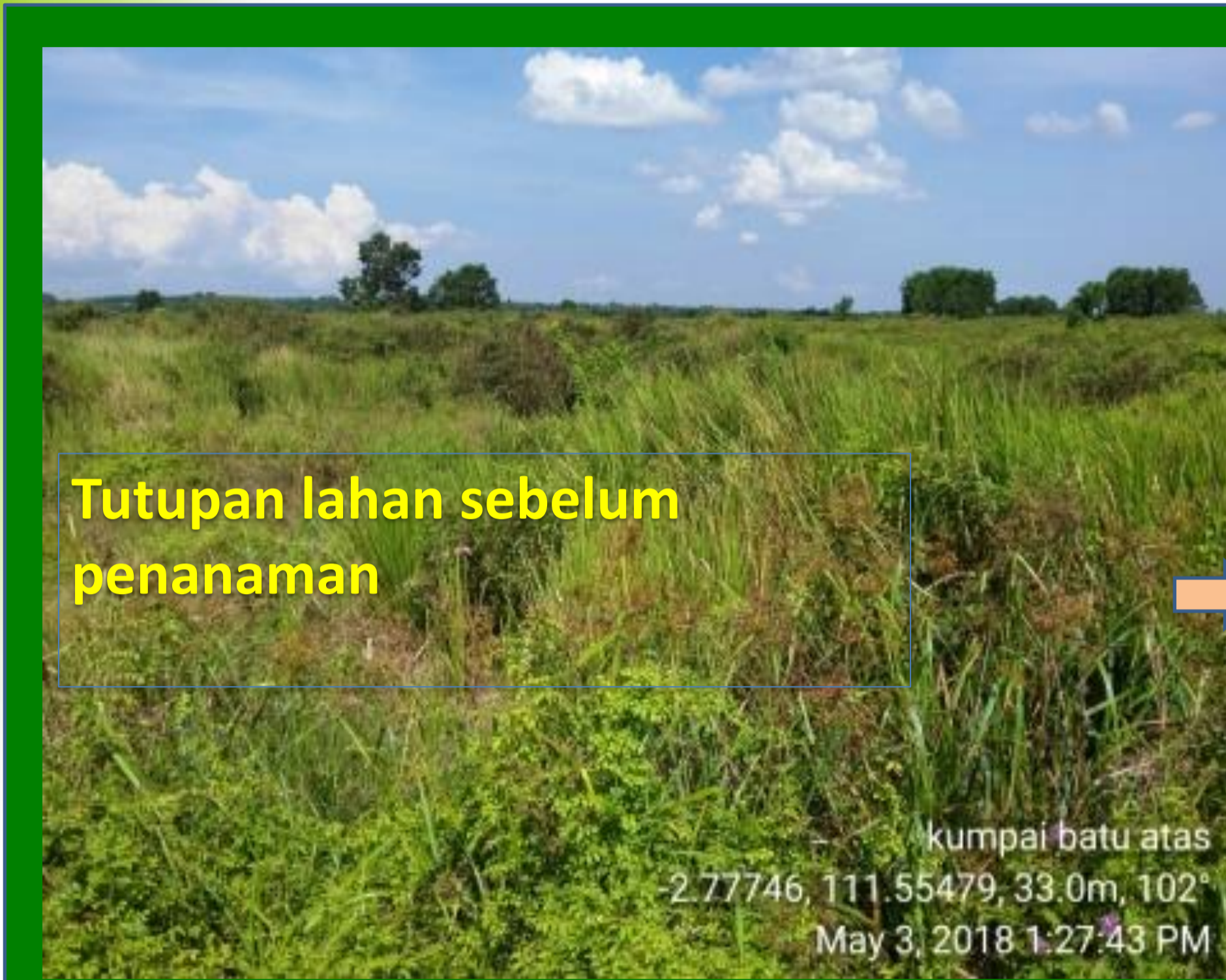
Tutupan lahan sebelum penanaman

Kumpulan (konsorsium) beberapa jenis fungi dapat membantu mempercepat pelapukan pangkasan gulma dan sisa tanaman menjadi kompos sehingga pembakaran tidak diperlukan