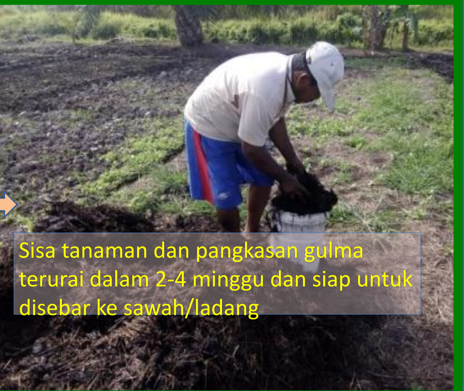
Sisa tanaman dan pangkasan gulma terurai dalam 2-4 minggu dan siap untuk disebar ke sawah/ladang