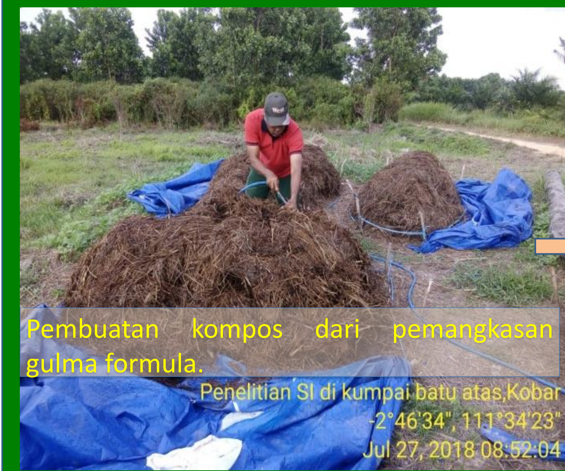
Pembuatan kompos dari pemangkasan gulma formula.