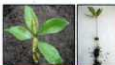
Gambar 6. Benih siap dipindah