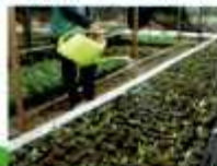
Gambar 7. Penyiraman benih

Pencegahan/Pengendalian : Semprot benih dengan fungisida berbahan aktif Mankozep sebanyak 3 g/l air.