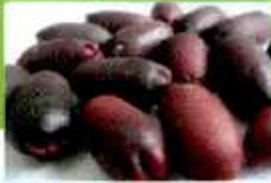
Gb 1. Buah cengkih masak fisiologis