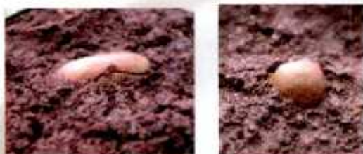
Gb 4. Cara menyemai benih