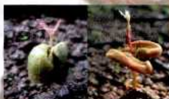
Gb 5. Benih tumbuh 2-3 minggu setelah semai