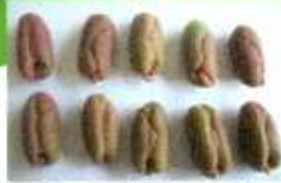
Gb 2. Benih siap semai