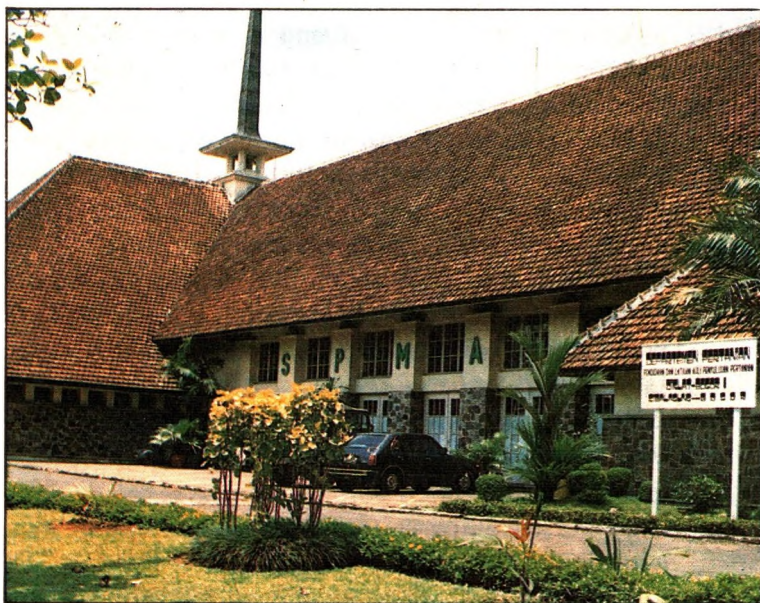
Gambar 3 Sekolah Pertanian Menengah Atas (SPMA) di Bogor ini adalah salah satu tempat bagi petani modern di masa depan dan calon-calon Penyuluh Pertanian digembleng untuk membangun pertanian.

dan waktu pelajarannya 2 hari @ 2 atau 3 jam perminggu.