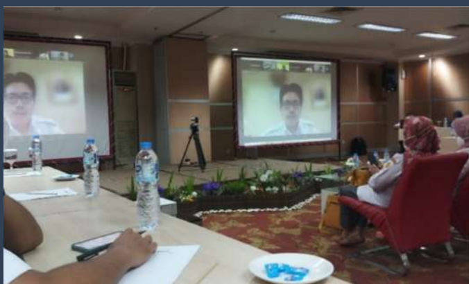
Gambar 3. Koordinasi Evaluasi Pasca Pelatihan di Bandung

Rangkaian Kegiatan Evaluasi pasca Pelatihan mendukung Food Estate di Kalimantan Tengah di tutup pada rapat koordinasi evaluasi pasca pelatihan mendukung program Food Estate Provinsi Kalimantan Tengah tahun 2021, dilaksanakan pada hari Rabu s.d. Jumat, 17 s.d. 19 November 2021, di Bandung Jawa Barat. Kegiatan dibuka secara resmi oleh Kepala Badan Penyuluhan dan Pengembangan Sumber Daya Manusia Pertanian dan dihadiri oleh Kepala Pusat Pelatihan Pertanian dan tim, Kepala Pusat Data dan Sistem Informasi Pertanian, Kepala Balai Besar Pelatihan Pertanian Binuang, seluruh kepala UPT Lingkup Puslatan, Kepala BPTU HPT Pelaihari, Puslitbangbung, Dinas Pertanian provinsi Kalimantan Tengah, Dinas Pertanian Kabupaten Kapuas dan Kabupaten Pulang Pisau, Tim Perumus Pusdatin, Koordinator 13 BPP kabupaten Kapuas dan Pulang Pisau, Koordinator serta Tim Evaluasi Pasca Pelatihan Balai Besar Pelatihan Pertanian Binuang Kalimantan Selatan ( Enumerator ), baik secara daring ( online ) maupun luring ( offline ).