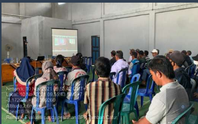
Gambar 1. Evaluasi Pasca Pelatihan di BPP Tamban Catur, Kecamatan Basarang, Kabupaten Kapuas, Kalimantan Tengah

Selanjutnya dilakukan rekonsiliasi dan pengolahan data hasil evaluasi pasca pelatihan di Depok pada tanggal 15 s.d. 16 November 2021 yang dilakukan bersama Tim dari Puslatan, BPP Binuang dan Pusdatin dimana data yang dikumpulkan oleh tim dari BPP Binuang akan diolah oleh tim Pusdatin dan dianalisis kedalam bentuk analisis deskriptif dari penerapan pasca pelatihan mendukung Food Estate , selanjutnya hasil rekonsiliasi data evaluasi pasca pelatihan dijadikan bahan pada rapat koordinasi evaluasi pasca pelatihan mendukung program Food Estate Provinsi Kalimantan Tengah.