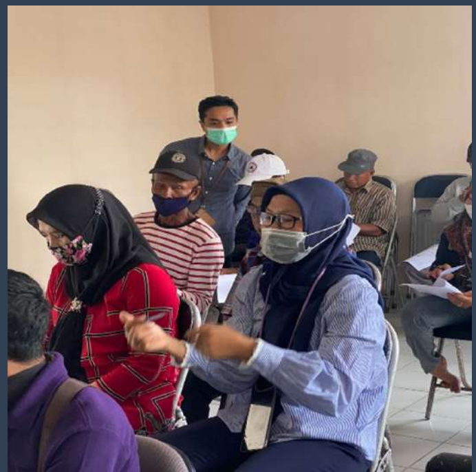
Gambar 2. Evaluasi Pasca Pelatihan di BPP Kapuas Murung, Kabupaten Kapuas, Kalimantan Tengah

Kegiatan evaluasi pasca pelatihan diawali dengan inventarisasi purnawidya pelatihan di 13 lokasi Food Estate yaitu Evaluasi Pasca