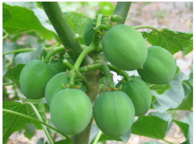
Gambar 2. Buah jarak pagar wangi