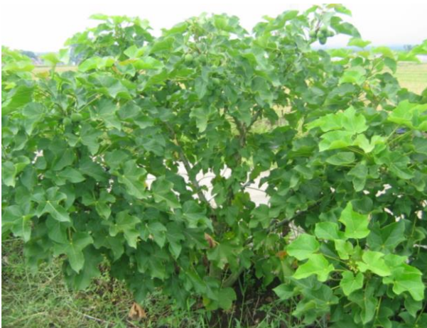
Gambar 1. Tanaman jarak pagar wangi

activities and potential applications. In Gubys. Mittelbachand Traby. Biofuel and Industrial Product from Jatropha curcas : 160–166