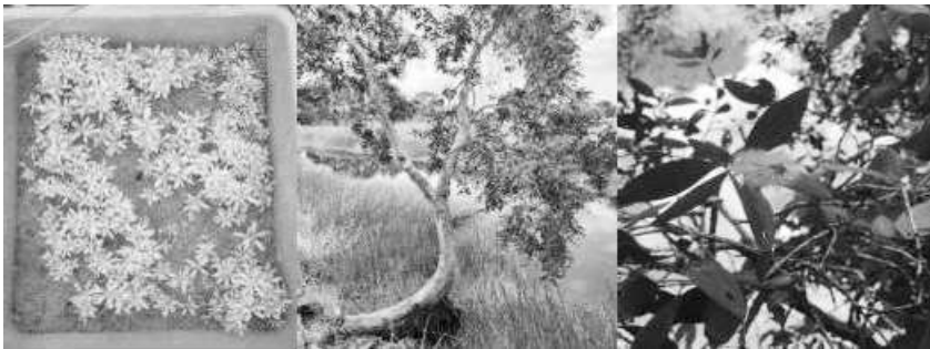
Gambar 49. Perkecambahan Biji Gelam (Gambar Kiri), Morfologi Batang (Gambar Tengah), Morfologi Daun Gelam (Gambar Kanan)

Pohon gelam memiliki daun tunggal, agak tebal, bertangkai pendek, letak berseling. Helaian daun berbentuk jorong atau lanset, panjang 4,5-15 cm dengan lebar 0,75-4,0 cm, ujung dan pangkalnya runcing, tepi daun rata, tulang daun hampir sejajar. Permukaan daun berambut, warna hijau kelabu sampai hijau kecoklatan. Daunnya jika diremas atau dimemarkan akan mengeluarkan aroma minyak kayu putih.