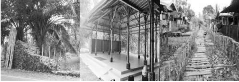
Gambar 52. Beragam Pemanfaatan Kayu Gelam (Kiri) sebagai Bahan Konstruksi Bangunan (Tengah dan Kanan)