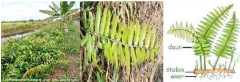
Gambar 55. Morfologi Tumbuhan Kalakai (Gambar Kiri), Daun Kalakai (Gambar Tengah), Stolon dan Akar Kalakai (Gambar Kanan)

Anatomi tumbuhan paku pada bagian epidermisnya mempunyai lapisan kutikula. Pada bagian akar, batang, dan daun sudah memiliki berkas pembuluh angkut, yaitu xilem yang mengangkut air dan garam mineral dari akar menuju tajuk untuk proses fotosintesis, dan floem yang berfungsi mengedarkan hasil fotosintesis ke seluruh bagian tumbuhan (Tjitrosoepomo 2009 dalam Jannah, 2012).