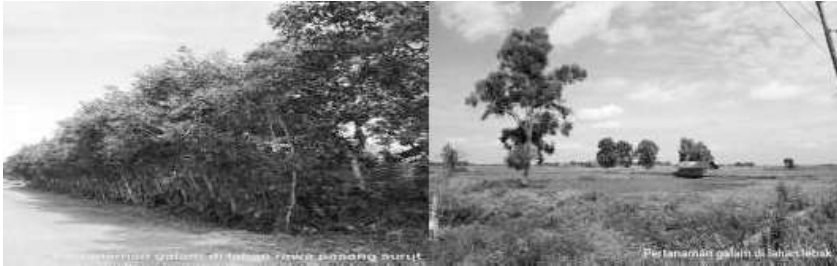
Gambar 48. Hutan Gelam di Lahan Rawa Pasang Surut dan Rawa Lebak

membedakan adalah kandungan minyak atsiri. Gelam minyak kayu putih lebih banyak mengandung minyak kayu putih dibandingkan gelam rawa. Gelam rawa di Kabupaten Barito Kuala terdapat dua jenis, yaitu gelam tembaga dan gelam putih. Gelam tembaga tumbuh di tepi-tepi sungai dengan penciri memiliki kulit kayu lebih tipis dan lebih licin dibandingkan gelam putih. Gelam putih tumbuh pada daerah yang agak ke jauh dari sungai (Karim, 2003).