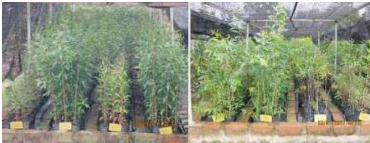
Gambar 51. Pertumbuhan Gelam dari Perkecambahan Benih (Gambar Kiri) dan Anakan Alam (Gambar Kanan)

Sudrajat (2016) melaporkan media perkecambahan yang terbaik untuk menumbuhkan benih gelam adalah campuran pasir dan arang sekam dengan perbandingan berdasarkan volume (1:1). Bastoni, et al. , (2010) melaporkan bahwa penampilan pertumbuhan bibit gelam yang berasal dari perkecambahan benih lebih baik dibandingkan dengan penampilan pertumbuhan bibit gelam yang berasal dari cabutan anakan alam.