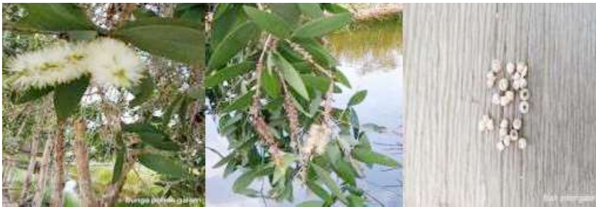
Gambar 50. Bunga Gelam (Kiri), Posisi Bunga dan Buah (Tengah), Buah Gelam (Kanan)

Biji gelam terdapat pada buah yang berbentuk kapsul. Biji gelam termasuk ke dalam benih yang mampu tersimpan lama hingga beberapa tahun dikenal dengan istilah canopy seed storage (Harris & Pannell, 2010) dan menempel pada tangkai daun yang sekaligus tangkai buah. Perkecambahan benih gelam membutuhkan periode pencahayaan 12 jam per hari. Periode pencahayaan yang semakin berkurang mengakibatkan daya dan kecepatan berkecambah juga semakin menurun. Benih dengan sifat demikian dikategorikan memiliki dormancy enforce atau dormansi relatif di mana benih tersebut dorman karena faktor lingkungan (suhu dan cahaya) dan dormansi dapat diatasi setelah faktor lingkungan yang menghambatnya dihilangkan (Mayer dan Mayber dalam Sudrajat, 2016). Sudrajat (2016) melaporkan bahwa letak posisi biji pada tangkai buah berpengaruh terhadap persentase perkecambahan benih. Benih yang berasal dari tangkai buah ke-2 dan 3 memiliki daya tumbuh lebih tinggi dibandingkan dari benih yang berasal dari tangkai buah 1.