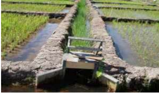
Gambar 47. Purun Tikus sebagai Biofilter dalam Saluran Air Masuk (Irigasi) dan Saluran Air Keluar (Drainase) di Lahan Pasang Surut Sulfat Masam