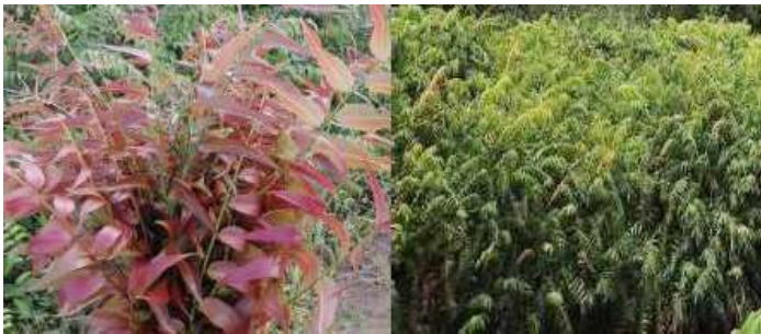
Gambar 54. Jenis Kalakai Merah (Kiri), Kalakai Hijau (Kanan)

Berdasarkan klasifikasi tumbuhan kalakai dimasukkan ke dalam spesies ( Stenochlaena palustris ), genus Stenochlaena , famili Blechnaceae , ordo Blechnales , kelas Pteridopsida , divisi Pteridophyta , kerajaan Plantae ( www.wikipedia.org ). Ada dua jenis kalakai yang sering ditemui di lapangan, yaitu kalakai merah dan kalakai hijau (Irawan, et al. , 2006).