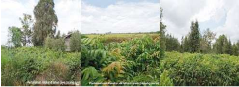
Gambar 53. Ekologi Tumbuhan Kalakai di Lahan Rawa Pasang Surut Kalimantan Selatan (Gambar Kiri dan Tengah) dan Kalimantan Tengah (Gambar Kanan)