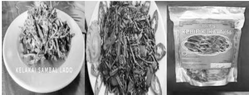
Gambar 56. Beragam Bahan Olahan dari Kalakai

kalakai untuk sayur antara lain bahan tumis sayuran, sayur bening atau direbus untuk lalapan, sedangkan bahan olahan kalakai digunakan untuk pembuatan keripik dan stik kalakai.