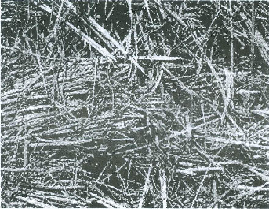
Gambar 2. Jerami kering padi yang belum termanfaatkan.

mengalami perubahan struktur, dan parenkim terurai. Pada perlakuan urea 6%, struktur jerami mulai hancur, menyatu. Inkubasi dalam cairan rumen mengakibatkan jaringan jerami sukar dibedakan, karena mengalami penguraian. Perlakuan amoniasi urea dapat mengubah struktur jerami padi lebih cepat dibandingkan dengan tanpa urea. Urea dapat dimanfaatkan dalam proses pembuatan kompos berbahan jerami di lahan sawah, sehingga diperoleh kompos dalam waktu singkat.