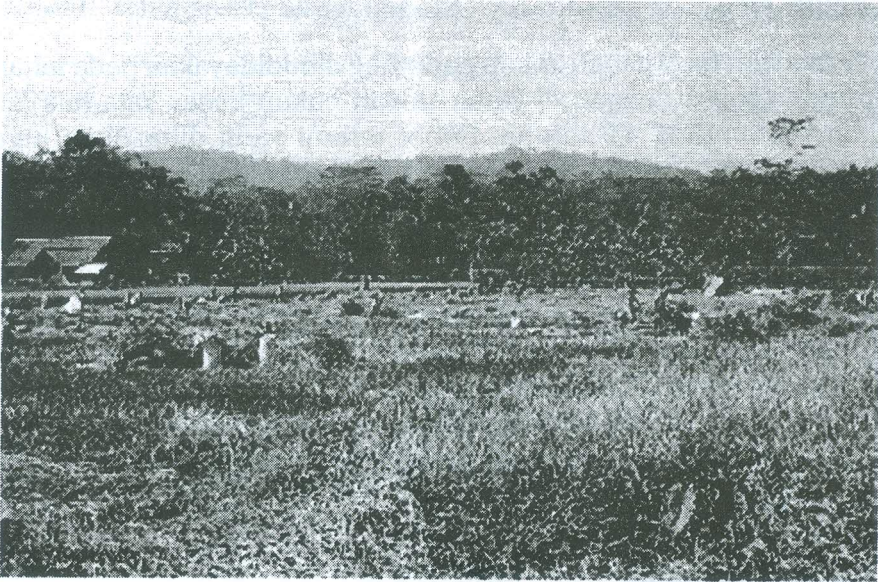
Gambar 1. Bagi sebagian besar petani, panen padi adalah panen gabah, tidak termasuk jerami.

dengan semakin berkembangnya ilmu pengetahuan dan teknologi, kendala tersebut dapat diatasi.