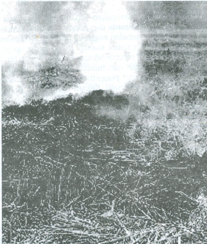
Gambar 5. Jerami sisa panen dibakar menghasilkan polusi asap dan hilangnya sejumlah hara tanaman.

Pemberian jerami ke tanah berdrainase buruk menyebabkan perombakan jerami berlangsung secara anaerobik. Asam-asam organik yang terbentuk dari perombakan jasad renik menyebabkan tanah masam, kadar besi-fero meningkat yang dapat me-