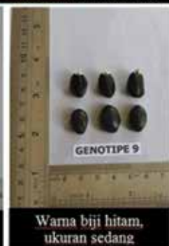
Warna biji hitam, ukuran sedang