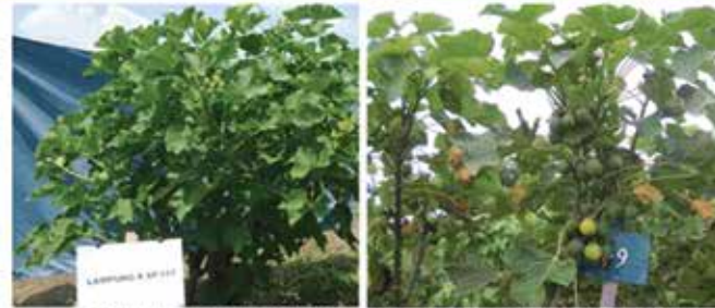
Tampilan genotipe No. 9 (Jet 2 Agribun) : kiri sedang berbunga, kanan berbuah.

Jet 2 Agribun variety is a plant with growth reaching more than 200 cm and has been released as new variety. Has an average yield potential of 1,078 kg / ha, Jet 2 Agribun variety is also resistant to P latus pest and has an oil content of 35.80%. This superior variety is potential to be developed as a renewable energy source.