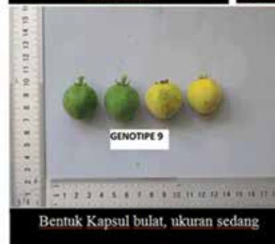
Bentuk Kapsul bulat, ukuran sedang