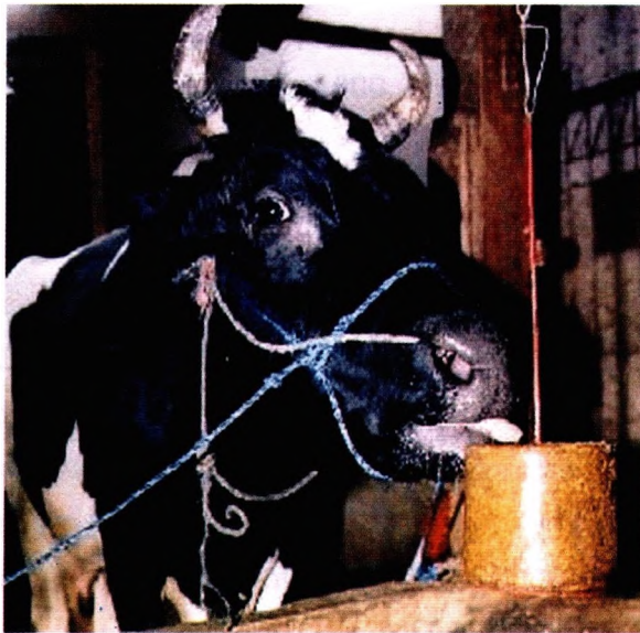
Gambar 2. Cara Pemberian FBS pada sapi

Cara pemberian FBS pada sapi sangat mudah dan tidak mempengaruhi kebiasaan peternak dalam memberikan pakan. FBS dikait dengan kaitan khusus kemudian digantung di depan sapi dengan jarak terjangkau oleh moncong sapi (Gambar 2). Dengan demikian sapi akan menjilat FBS tersebut apabila merasa membutuhkan. Satu blok FBS akan dapat bertahan cukup lama, yaitu sekitar 1 bulan. Setelah habis baru diberikan lagi.