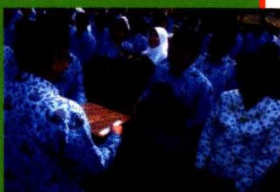
Penyerahan Hadiah Lomba Pemenang Lomba Web 2012