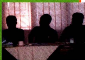
Peserta Pelatihan GPS

oleh : (1) Kebijakan Pembangunan Pertanian di Kabupaten Tegal oleh Asrori, SH Plt. Kepala Dinas Kabupaten Tegal; (2) Pengendalian Alih Fungsi Lahan dan Sosialisasi UU No. 41 tahun 2009 beserta 4 (empat) Peraturan Pemerintah turunannya dalam rangka pencapaian 10 juta ton surplus beras di tahun 2014 dan ketahanan pangan nasional oleh Dr. M. Luthful Hakim, Kepala Subbidang Data Prasarana Pusat Data dan Sistem Informasi Pertanian; (3) Pemaparan dari Drs. Kunto Dewandono BPS Kabupaten Tegal; (4) Keterkaitan Lahan Pertanian Pangan dengan Perencanaan RT RW oleh Teguh Dwijanto Rahadjo, ST, MT Kasubbid Pengembangan Infrastruktur, BAPEDA Kabupaten Tegal. Setelah dilakukan pemaparan, dilanjutkan dengan diskusi dan tanya jawab dengan peserta bimbingan teknis (notulen terlampir).