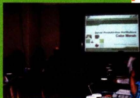
Pemaparan Oleh Ditjen Hortikultura dan BPS