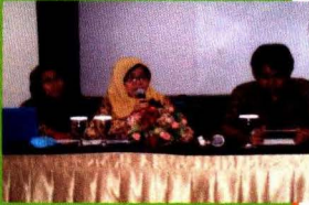
Moderator dan Penulis Outlook Komoditas Perkebunan dan Hortikultura