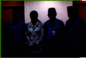
Pemenang Lomba Web 2012