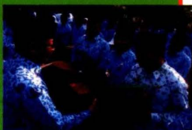
Penyerahan Hadiah Lomba Pemenang Lomba Web 2012

ditampilkan, mendukung percepatan pelaksanaan e-Government serta memanfaatkan situs web Kementerian Pertanian, SKPD lingkup pertanian provinsi, SKPD lingkup pertanian kabupaten/kota dan UPT Pusat lingkup pertanian sebagai sarana pelayanan kepada masyarakat. Sasaran dari lomba web adalah termotivasinya instansi pusat dan daerah untuk mengembangkan situs webnya, terpelihara dan diperbaharainya data dan informasi pertanian pada situs web pusat dan daerah dan terpetanya situs web lingkup pertanian pusat dan daerah. Peserta yang mengikuti lomba web tahun ini yaitu Eselon I lingkup Kementerian Pertanian, Satuan Kerja Perangkat Daerah (SKPD) lingkup pertanian Provinsi seluruh Indonesia yang telah memiliki website, Satuan Kerja Perangkat Daerah (SKPD) lingkup pertanian Kabupaten/kota seluruh Indonesia yang telah memiliki website serta Unit Pelayanan Teknis (UPT) Pusat lingkup pertanian yang telah memiliki website juga tentunya. Dampak positif dari penyelenggaraan lomba situs web tersebut adalah semakin teraturnya peremajaan situs web masing-masing Eselon I dan situs web SKPD lingkup pertanian provinsi serta SKPD lingkup pertanian kabupaten/kota. Hal ini menjadikan content (isi) situs web Kementerian Pertanian juga semakin diperkaya dengan adanya link ke masing-masing web tersebut.