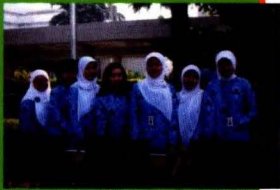
Tim Penyerahan Hadiah Lomba