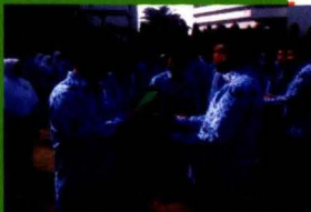
Penyerahan Hadiah Lomba Pemenang Lomba Web 2012