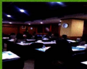
Peserta Workshop Aplikasi e-Office