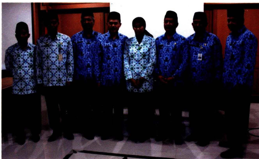
Pemenang Lomba Web Lingkup Kementerian Pertanian Tahun 2012

Pembangunan dan pengembangan Situs Web Kementerian Pertanian ( http://www.deptan.go.id ) telah dimulai sejak tahun 1996. Pusat Data dan Sistem Informasi Pertanian (Pusdatin) mengawali kegiatan tersebut dengan menyediakan beberapa menu yang menampilkan berbagai data dan informasi pertanian yang bersifat umum. Pengembangan situs web dilakukan dengan melengkapi menu yang menampilkan informasi dengan kategori fungsi unit kerja eselon I lingkup Kementerian Pertanian. Selain itu sesuai dengan perkembangan teknologi informasi, situs web Kementerian Pertanian dikembangkan sebagai media komunikasi yang interaktif dalam penyebarluasan data dan informasi pertanian. Selanjutnya, sebagai wujud komitmen terhadap pelayanan prima dalam hal penyediaan dan penyebarluasan data dan informasi kepada seluruh pengguna, sejak tahun 2002 telah dibentuk Pokja Pengelola Situs Web Deptan dan Tim Redaksi yang dikukuhkan dengan Keputusan Menteri Pertanian Nomor 508 dan 509 Kpts/Kp.150/9/2002. Melalui keberadaan Pokja dan Tim Redaksi yang beranggotakan para pengelola data dan informasi di seluruh unit kerja eselon II lingkup Kementerian Pertanian, kegiatan pengisian dan peremajaan data dan informasi menjadi lebih terkoordinasi. Selain itu, secara bertahap dibangun situs web Eselon I yang menyediakan informasi sesuai fungsinya masing-masing dalam bentuk tampilan situs web eselon II.