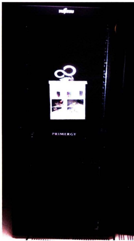
Rak Server bantuan Informasi Geospasial

INA-SDI (Indonesia Geospasial Data Infrastruktur) BIG berperan sebagai penghubung simpul jaringan nasional, keanggotaannya Kementerian Pertanian, diantaranya Kementerian Dalam Negeri, Kementerian Perhubungan, Kementerian Pariwisata dan Ekonomi Kreatif, LAPAN, PU, BPS, ESDM, Kehutanan, KKP, KLH, BPN dan ditambah dengan Bapeten, Kementerian Pembangunan Daerah Tertinggal. Kegiatan yang berkaitan dengan INA-SDI di bulan Desember untuk Kementerian Pertanian diawali dengan distribusi hardware dan software di Pusdatin Kementan dan Rapat Koordinasi Nasional (Rakornas) Informasi Geospasial 2012.