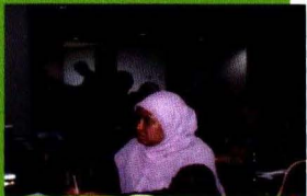
Peserta Workshop Outlook komoditas Perkebunan dan Hortikultura