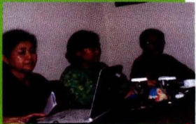
Penulis Outlook komoditas Perkebunan dan Hortikultura