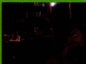
Pegawai Dinas Pertanian Tanaman Pangan yang menerima Hibah Aset