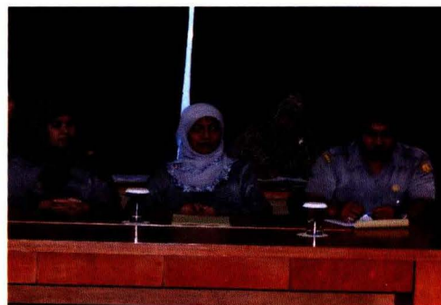
Panitia Workshop Analisis dan Penataan Data Sarana Pertanian

"Workshop Analisis dan Penataan Data Sarana Pertanian"