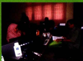
Pusdatin sedang melakukan inventarisasi hibah aset di Dinas Pertanian di Daerah