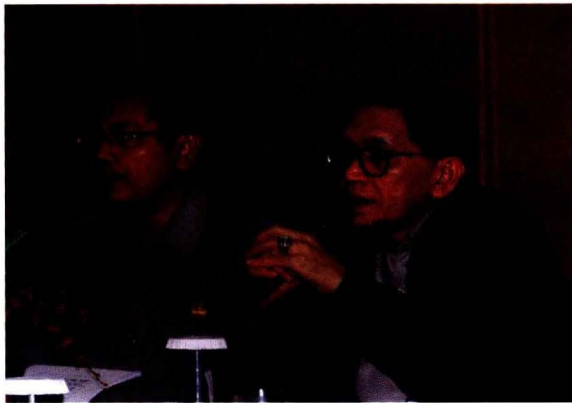
Pembukaan Workshop Oleh Kapusdatin dan Kasubbid Data Prasarana

Kontribusi sektor pertanian terhadap Produk Domestik Bruto (PDB) berada pada urutan kedua setelah sektor industri pengolahan yaitu 14,78% pada tahun 2011. Hal ini menunjukkan peranan sektor pertanian cukup penting dalam menunjang kegiatan perekonomian di Indonesia. Peran penting sektor pertanian lainnya adalah dalam penyediaan kebutuhan pangan dan penyerapan tenaga kerja yang cukup besar (33,51%) dibandingkan sektor lainnya. Sementara sebagian besar rumah tangga miskin bekerja di sektor pertanian (>50%). Menurut BPS (Badan Pusat Statistik), jumlah penduduk miskin pada tahun 2011 mencapai 29,89 juta orang, sebanyak 6,21 juta kepala rumah tangga bekerja diberbagai lapangan usaha dan 3,13 juta kepala rumah tangga (50,40%) di antaranya bekerja di sektor pertanian.