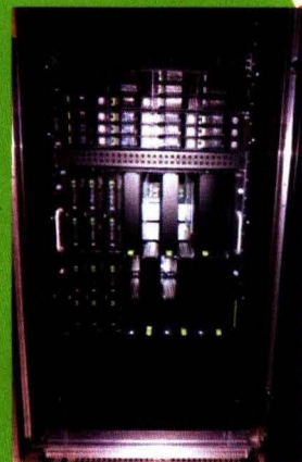
Server Harddisk bantuan dari Informasi Geospasial