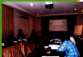
Pemaparan Oleh IPB dan Pusdatin