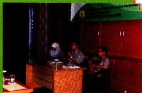
Narasumber Workshop Analisis dan Penataan Data Sarana Pertanian