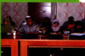
Peserta Workshop Analisis dan Penataan Data Sarana Pertanian

"Workshop Analisis dan Penataan Data Sarana Pertanian"