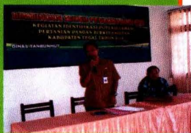
Pembukaan Pelatihan GPS oleh Kasubbid Data Prasana