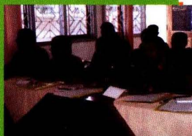
Peserta Pelatihan GPS