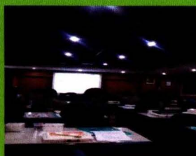
Peserta Workshop Aplikasi e-Office

workshop outlook komoditas perkebunan dan hortikultura sebanyak 1 (satu) kali pada bulan Desember 2012. Pelaksanaan workshop didasarkan pada SK Kuasa Pengguna Anggaran (KPA) Pusat Data dan Sistem Informasi Pertanian No.81F/Kpts/KU.110/A6/01/2012 Tanggal 16 Januari 2012 tentang Honor Tim Penyusunan Outlook Komoditas Perkebunan dan Hortikultura, Penunjukan Narasumber, Moderator, dan Peserta Workshop Penyusunan Outlook Komoditas Perkebunan dan Hortikultura Tahun 2012.