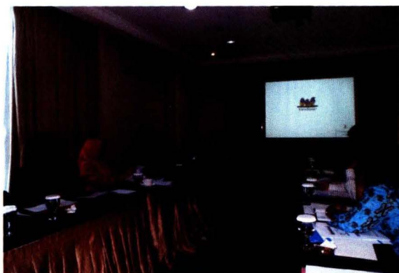
Pembukaan Workshop Oleh Kapusdatin

Komoditas hortikultura yang mencakup sayuran, buah-buahan, tanaman hias dan obat-obatan merupakan salah satu komoditas unggulan sektor pertanian karena memberikan kontribusi yang cukup besar terhadap devisa negara, bahkan beberapa komoditas, seperti cabe, sangat besar pengaruhnya terhadap tingkat inflasi. Oleh karena itu, perencanaan dan penanganan komoditas hortikultura, khususnya cabe, yang dilakukan secara tepat akan dapat memberikan dampak yang sangat baik bagi perekonomian Indonesia.