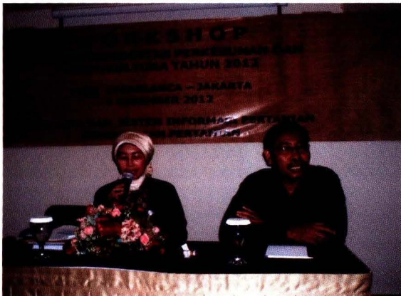
Pembukaan Workshop Oleh Kabid Data Komoditas Pusdatin dan Kasubdit Budidaya Tanaman Terna dan Merambat Direktorat Jenderal Hortikultura

Sub sektor perkebunan dan hortikultura sebagai bagian integral dari sektor pertanian merupakan sub sektor yang mempunyai peranan penting dan strategis dalam pembangunan nasional. Tanaman hortikultura mempunyai peranan sebagai penyedia kalori cukup tinggi, merupakan sumber vitamin, mineral, serat alami dan anti-oksidan, sehingga selalu diperlukan oleh tubuh sebagai sumber pangan maupun nutrisi. Sementara, peranan tanaman perkebunan terlihat nyata dalam penerimaan devisa negara melalui ekspor,