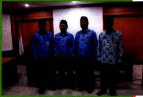
Pemenang Lomba Web 2012