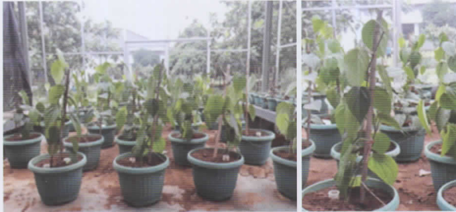
Gambar 2. Kondisi tanaman sebelum perlakuan stres kekeringan umur ± 4 bst

bagian atas tanaman baik daun maupun ulurnya sudah mengering (Gambar 3d). Hasil penelitian Zaubin (1992) terhadap 6 varietas lada di Lampung, tanaman lada secara umum sudah mengalami gangguan fisiologis pada kondisi air tanah 60% kapasitas lapangan dan pada kapasitas lapangan 45% mengalami cekaman berat. Tanaman mencapai titik layu permanen ketika kadar lengas tanah mencapai <20% dan KAN mencapai <38% (Gambar 3e). Hal ini, terlihat setelah tanaman disiram air walaupun mencapai titik jenuh.