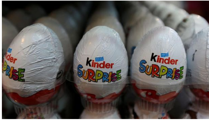
Foto: Telur coklat Kinder Surprise