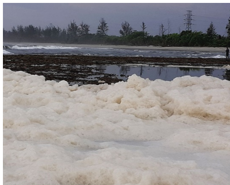
Pantai Teluk Sepang yang tercemar.

Mongabay Indonesia juga beberapa kali melakukan pemantauan di sekitar kolam air bahang. Tampak air limbah itu mengeluarkan busa tebal berwarna cokelat disertai bau menyengat.