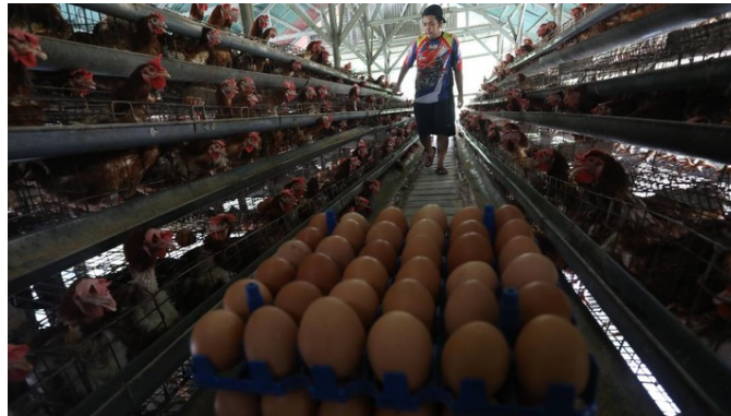
Foto: Peternak memanen telur ayam di salah satu peternakan di kawasan Gunung Sindur, Bogor, Jawa Barat, Rabu (28/12/2021). Menjelang akhir tahun mayoritas harga bahan pokok merangkak naik secara signifikan.