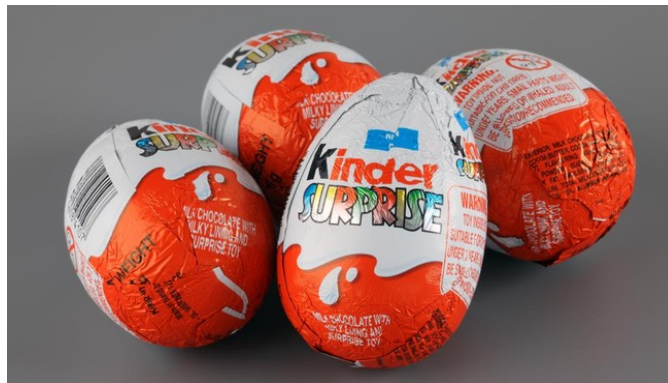
Ilustrasi. Bahaya bakteri Salmonella pada cokelat Kinder Surprise bisa memicu dehidrasi parah.

Judul : Bahaya Salmonella, Bakteri yang Bikin Peredaran Cokelat Kinder Disetop Penulis : - Waktu terbit : 12 Apr 2022 Sumber : https://www.cnnindonesia.com/gaya-hidup/20220412072046-255-783506/bahaya-salmonella-bakteri-yang-bikin-peredaran-cokelat-kinder-disetop