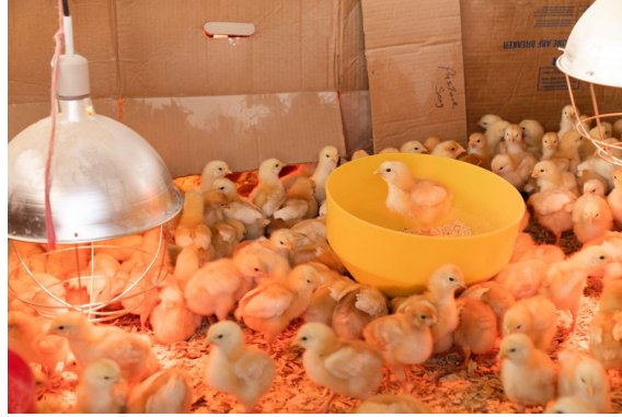
potret anak ayam

Infectious Bronchitis Virus (IBV) menyebabkan penyakit pernapasan yang menyebar sangat cepat pada anak ayam.