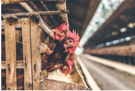
potret ternak ayam

Penyakit Marek merupakan penyakit unggas yang menyerang sistem limfoid dan sistem saraf. Penyakit Marek merupakan penyakit yang penting disorot, karena sifatnya yang proliferasif dan sangat menular.