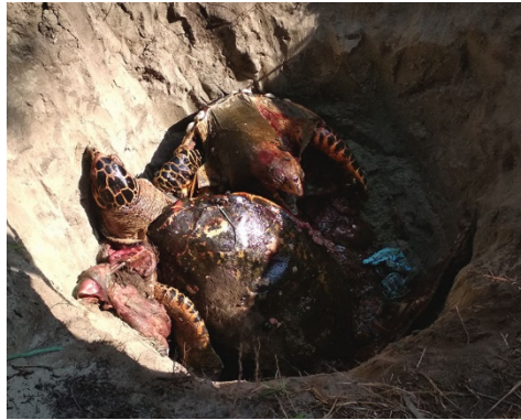
Empat bangkai penyu sisik yang ditemukan mati di Pantai Teluk Sepang dikuburkan setelah dilakukan nekropsi.

Dia juga mengatakan, kondisi ini juga menyebabkan angin mengarah ke daratan, sehingga ketika ada biota laut mati akan terbawa gelombang lalu menepi ke darat.