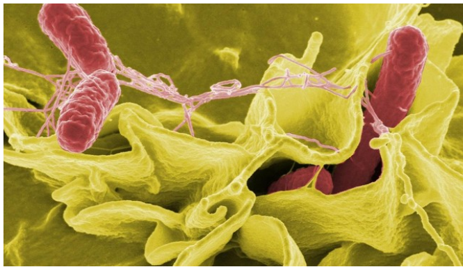
Bakteri Salmonella (Wikimages/Pixabay)

Sumber : https://www.cnnindonesia.com/gaya-hidup/20220407075839-255-781443/8-gejala-infeksi-salmonella-yang-paling-umum-dialami