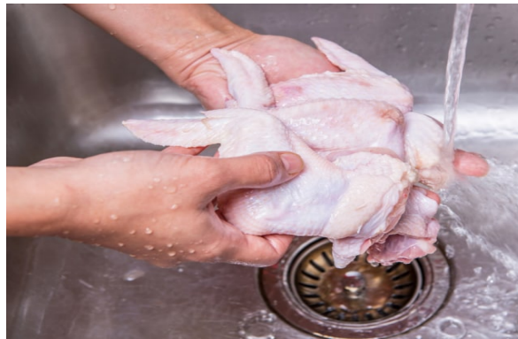
Ilustrasi mencuci ayam mentah

Salmonellosis adalah penyakit menular yang disebabkan oleh infeksi bakteri dari genus Salmonella yang menyerang saluran pencernaan, termasuk lambung, usus halus dan usus besar. CDC ( Centers for Disease Control and Prevention ) menuturkan gejala umum yang dirasakan pasien yang terinfeksi bakteri Salmonella yakni diare akut, demam tinggi dan kram perut serta muntah berkepanjangan hingga dehidrasi. Gejala biasanya dimulai 6 jam sampai 6 hari setelah tubuh terinfeksi dan gejala bertahan 4 sampai 7 hari.