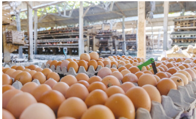
Ilustrasi telur ayam. Caption: Ilustrasi telur ayam.