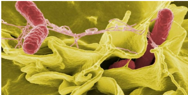
Ilustrasi Bakteri Salmonella

Judul : Mahasiswa UGM Temukan Senyawa Baru untuk Atasi Salmonellosis Penulis : Agus Setiawan Waktu terbit : 25 Oktober 2023