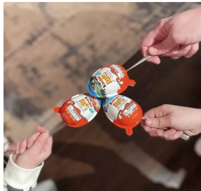
Produk Kinder Joy. /Instagram @kinderus

Sumber : https://arahkata.pikiran-rakyat.com/gaya-hidup/pr-1284235769/kinder-joy-ditarik-bpom-apa-itu-salmonella-dan-gimana-cara-pencegahannya?page=all