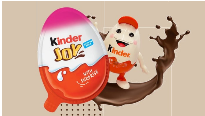
Ilustrasi Kinder Joy.

Judul : BPOM Izinkan Kembali Penjualan Cokelat Kinder Joy di Indonesia Penulis : Farid Nurhakim., Bayu Septianto Waktu terbit : 28 April 2022 Sumber : https://tirto.id/bpom-izinkan-kembali-penjualan-cokelat-kinder-joy-di-indonesia-grEx