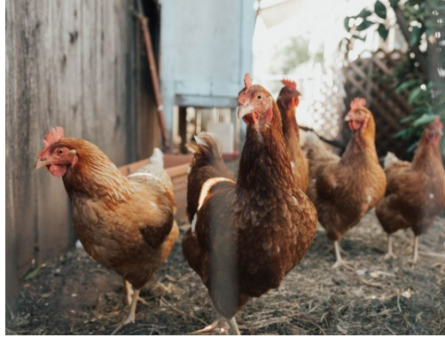
potret ternak ayam

Dilansir dari jurnal berjudul Epidemiology, control, and prevention of Newcastle disease in endemic regions: Latin America , New Castle Disease virus (NDV) mampu mempengaruhi banyak spesies ayam.