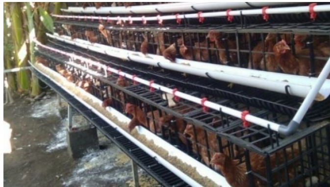
Lagi heboh penolakan telur ayam dari peternakan kandang baterai.

Diketahui, bahwa belakangan ini ada sebuah petisi www.change.org/AWIndonesia yang meminta rantai restoran A&W berkomitmen untuk tidak membeli telur dari peternakan kandang