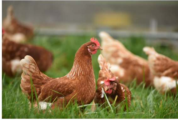
potret ternak ayam

Salmonellosis adalah penyakit enterik dan penyakit diare kronis dan bahkan kematian pada manusia dan hewan.