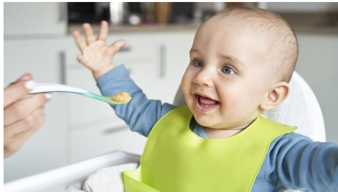
Ilustrasi MPASI.