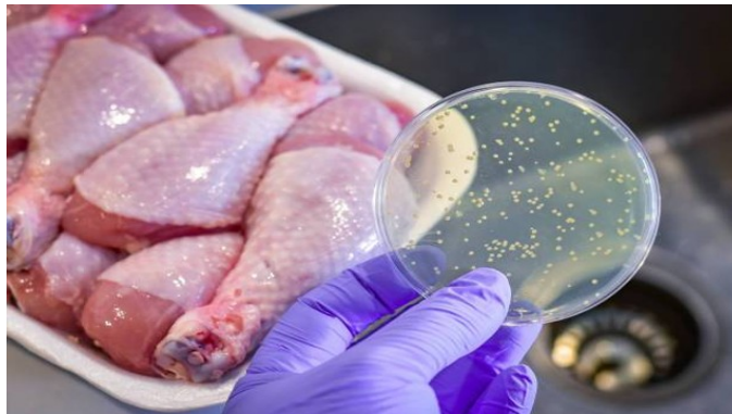
Ilustrasi bakteri berbahaya pada pangan mentah.