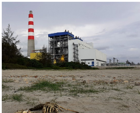
PLTU Teluk Sepang.

"Pembuangan limbah uji coba PLTU Teluk Sepang melanggar peraturan menteri," katanya.