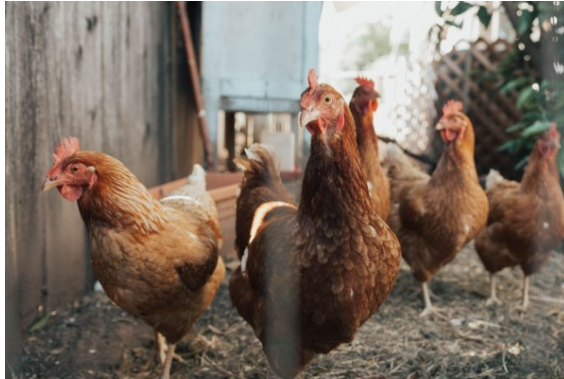
potret ternak ayam ( https://unsplash.com/@relentlessjpg )

Ayam adalah sumber protein yang banyak dikonsumsi orang di dunia. Menurut penelitian, orang Amerika mengonsumsi lebih banyak ayam daripada masyarakat lainnya dengan angka sekitar 93 pon per kapita per tahun. Sedangkan di Indonesia, menurut data Organisasi Kerjasama Ekonomi dan Pembangunan, konsumsi daging ayam Indonesia hanya sebesar 8,1 kilogram per kapita pada 2021.