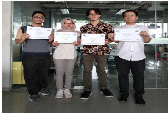
Empat mahasiswa pengembang bakteri salmonella menjadi obat kanker serviks.

Judul : Pertama di Indonesia, Bakteri Salmonella untuk Bunuh Sel Kanker Serviks Penulis : Citra Larasati Waktu terbit : 02 Januari 2024 Sumber : https://www.medcom.id/pendidikan/riset-penelitian/JKRdG1pb-pertama-di-indonesia-bakteri-salmonella-untuk-bunuh-sel-kanker-serviks